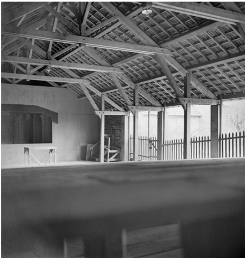
[La scène et le côté est, vus de la salle]. 1937. 21, Alise-Sainte-Reine, 4 impasse du Théâtre