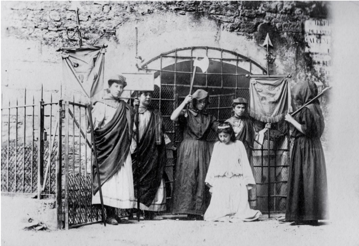
[Sainte Reine devant la fontaine]. S.d. [fin 19e ou début 20e siècle].

21, Alise-Sainte-Reine, 4 impasse du Théâtre