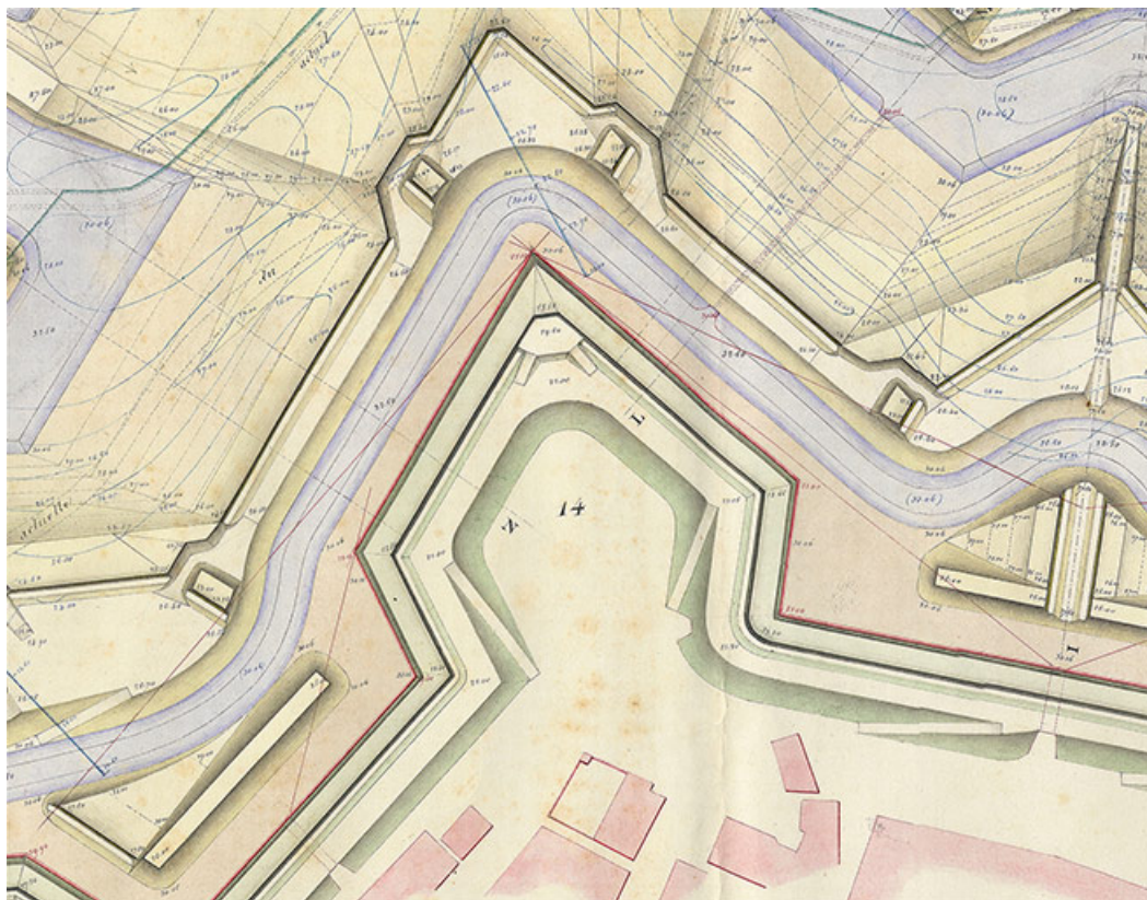
[Détail du bastion de Kehl]. 1843. 21, Auxonne rue de Labergement