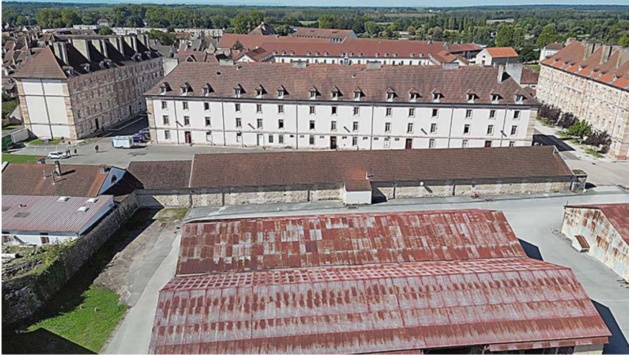
Vue aérienne du rempart reliant les bastions du Gouverneur et du Cygne.