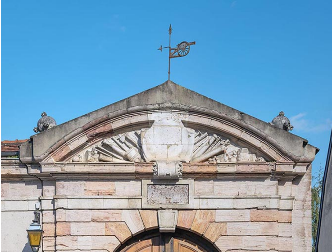
Fronton et son décor (de la rue du Capitaine Landolphe). 21, Auxonne rue Carnot