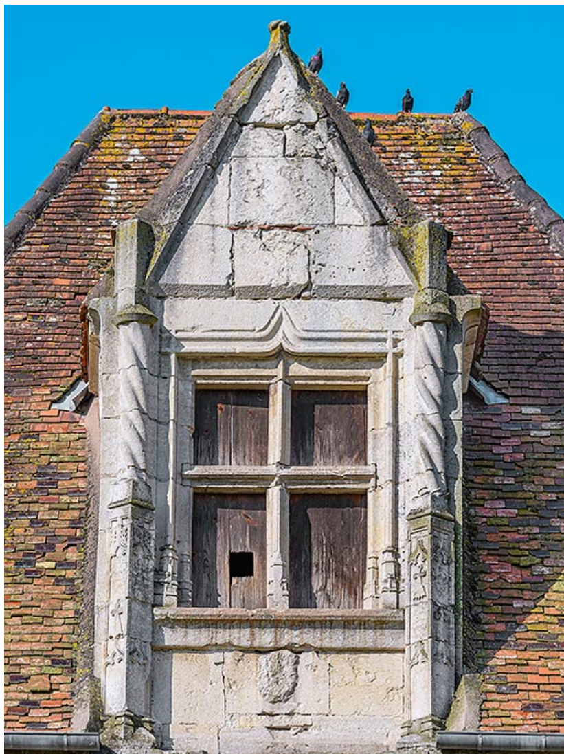
Vue de la baie à meneau.