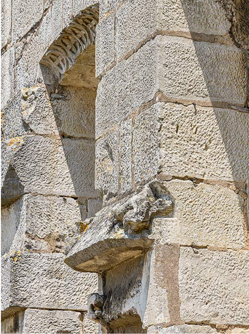
Détail sur la maçonnerie en pierre de taille. 21, Auxonne boulevard Pasteur