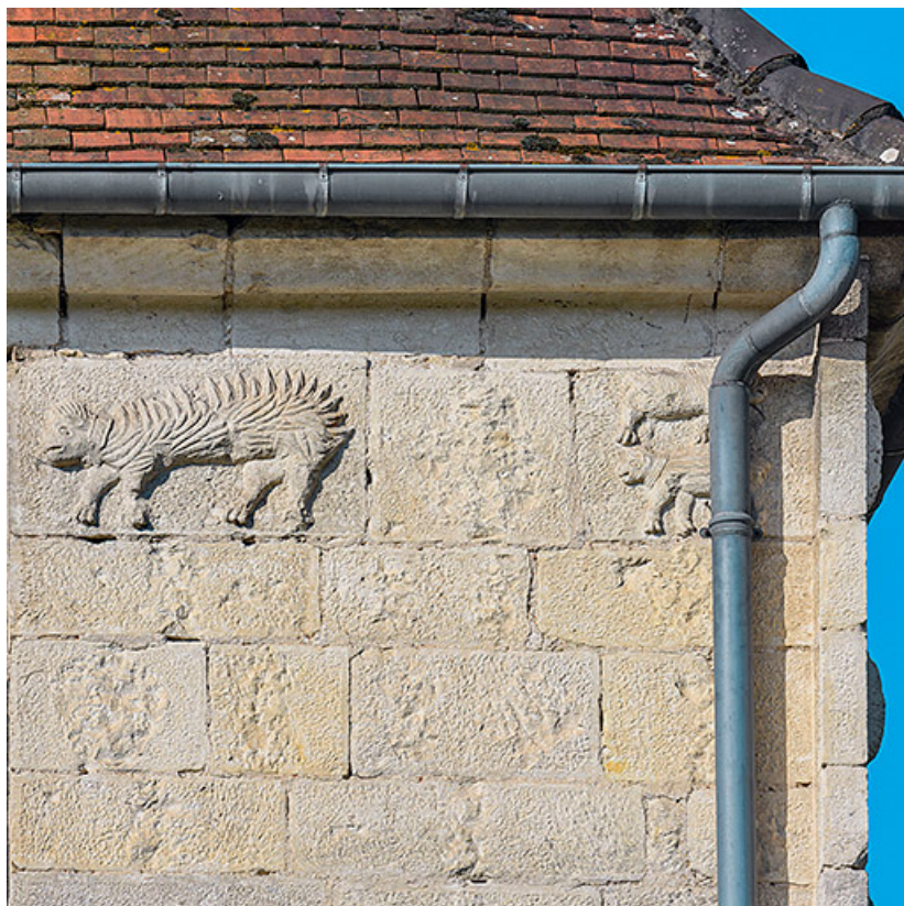
Porc épics, emblème du roi Louis XII.