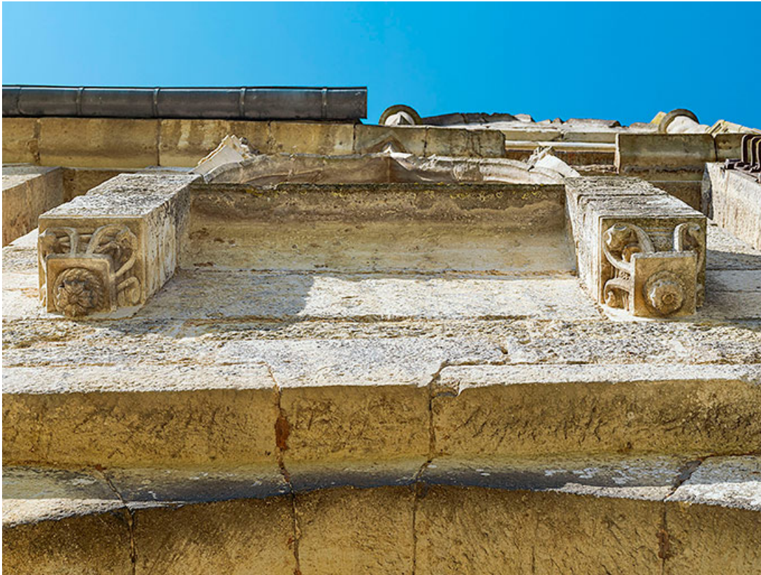
Base des piliers supportant les pinacles.