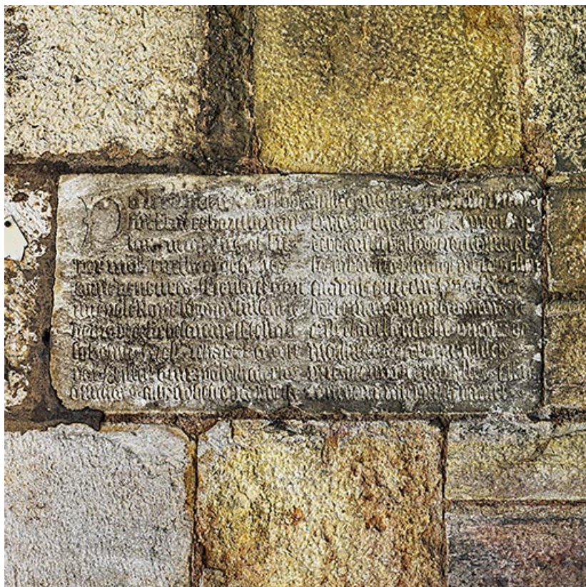
Inscription sous la voûte du passage.