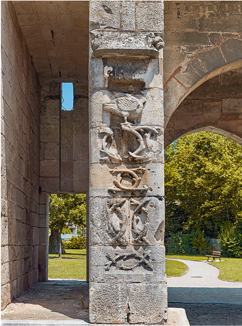
Pilier séparant les parties piétonne et cochère de la porte, côté ville. 21, Auxonne boulevard Pasteur