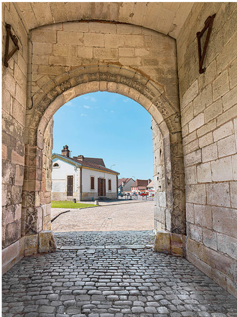
Le passage voûté et l'ancien corps de garde. 21, Auxonne boulevard Pasteur