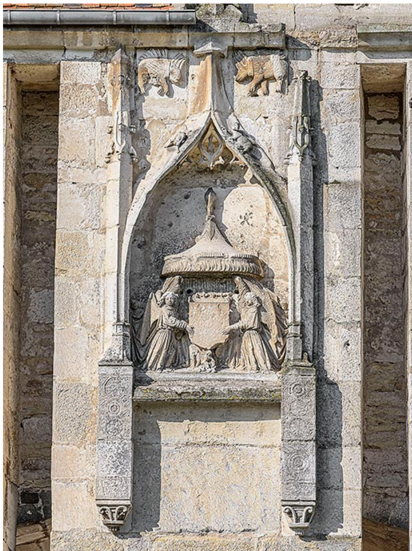
Groupe sculpté, façade côté campagne.