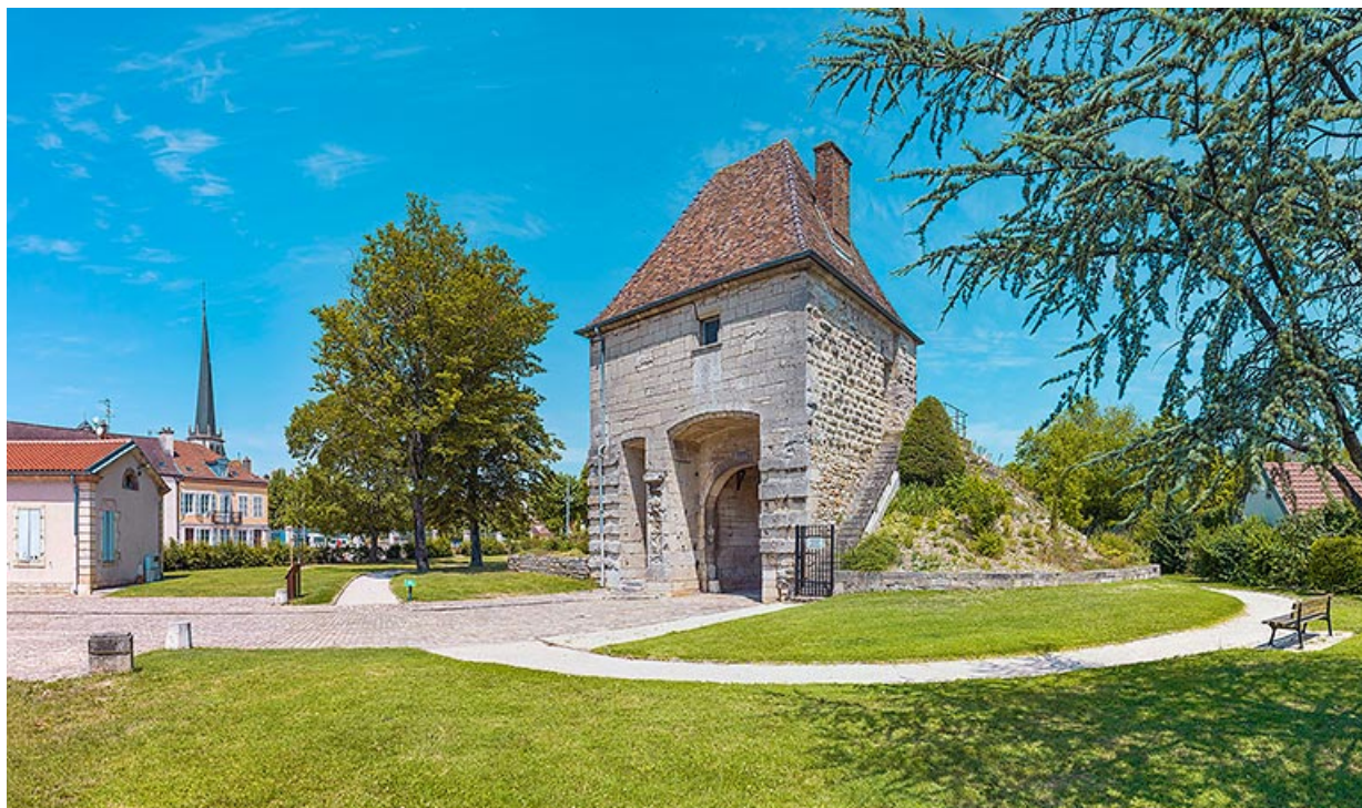
La porte côté ville : vue de trois quarts droite. 21, Auxonne boulevard Pasteur