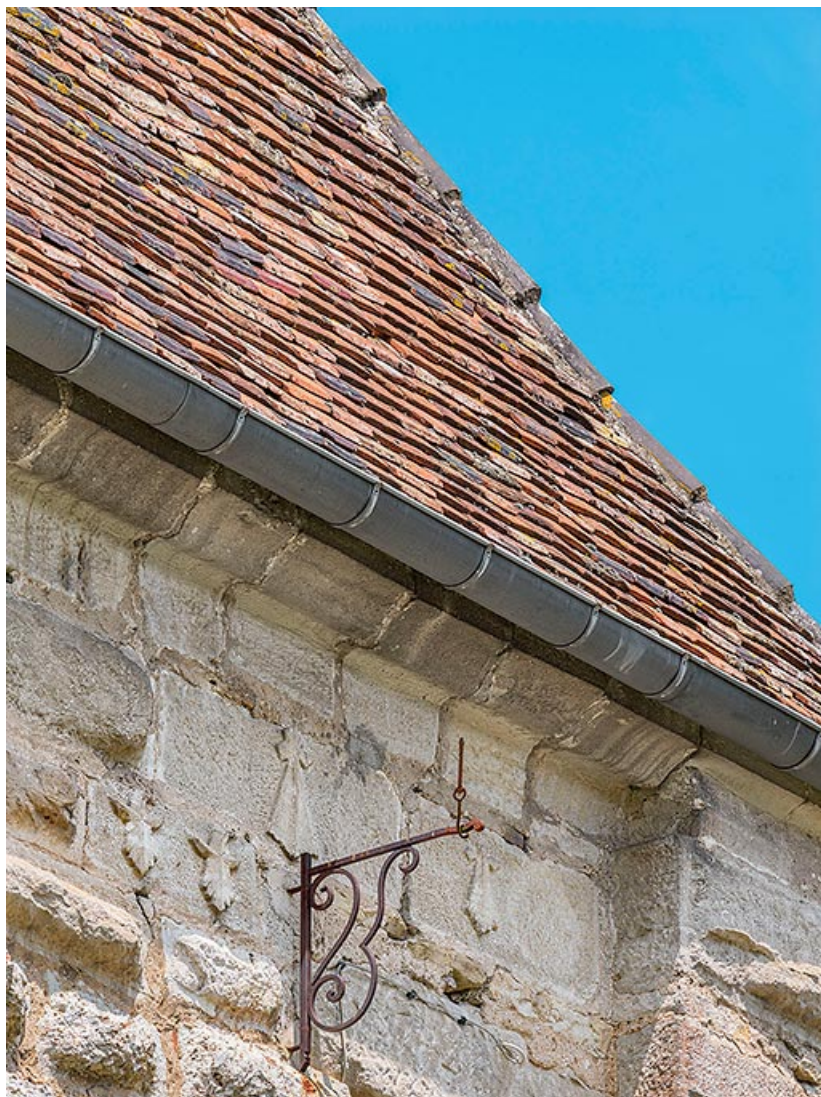
Détail de la corniche et de la couverture en tuile.