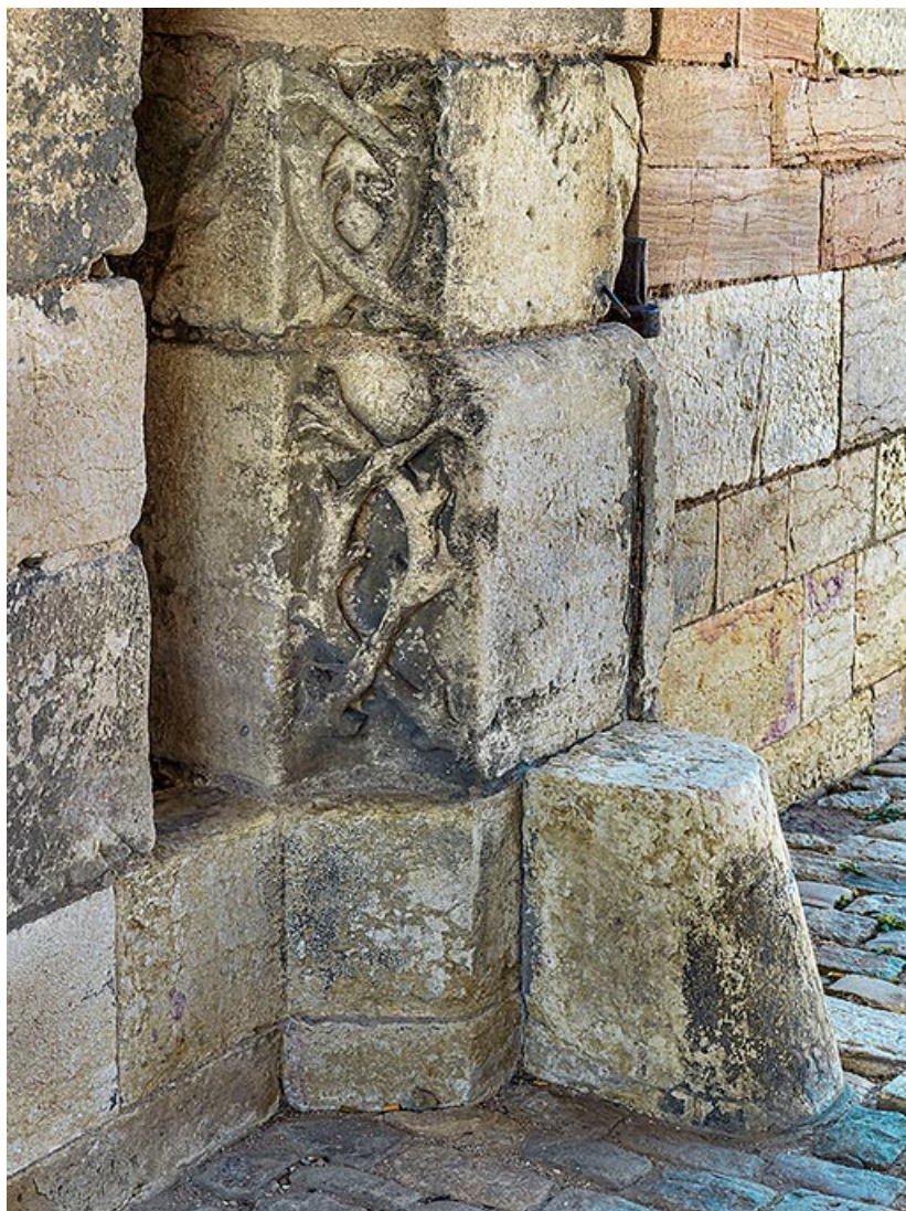
Détail sur la partie basse du chambranle.