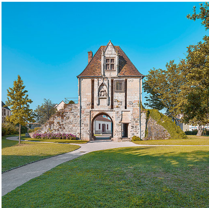
Vue générale de la façade côté campagne.