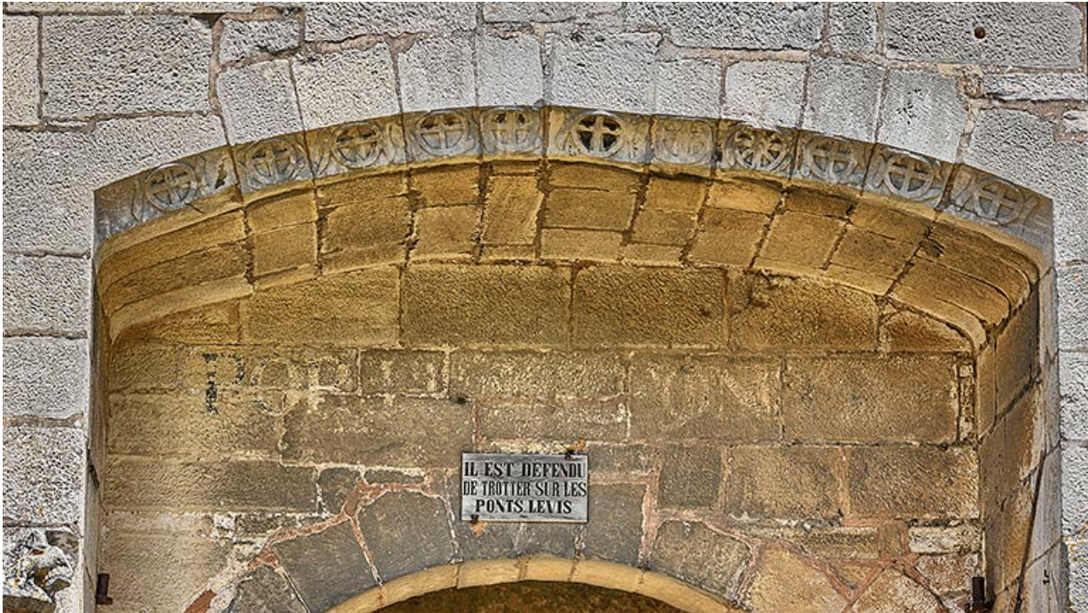
Détail d'une ancienne information à ceux qui passaient cette porte.