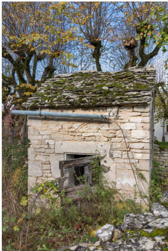
Vue de la façade sud.