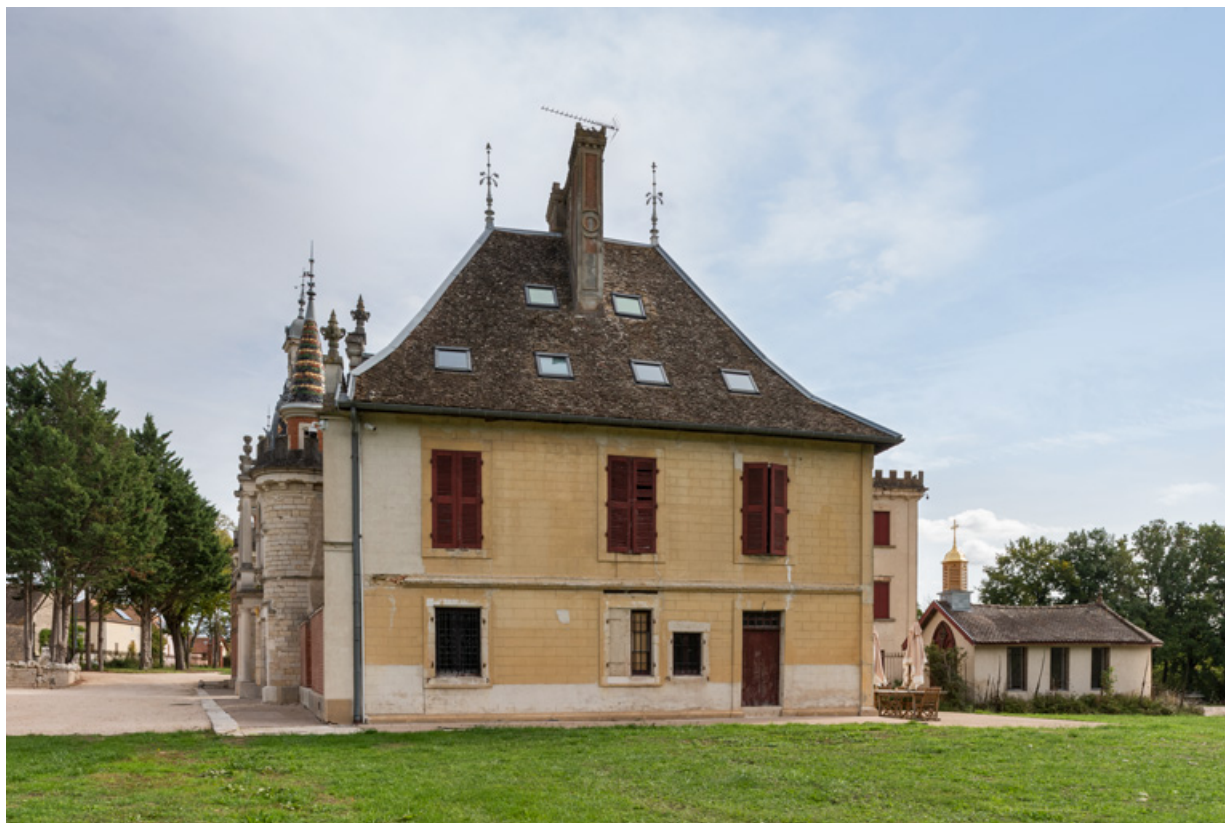
Elévation postérieure (ouest).