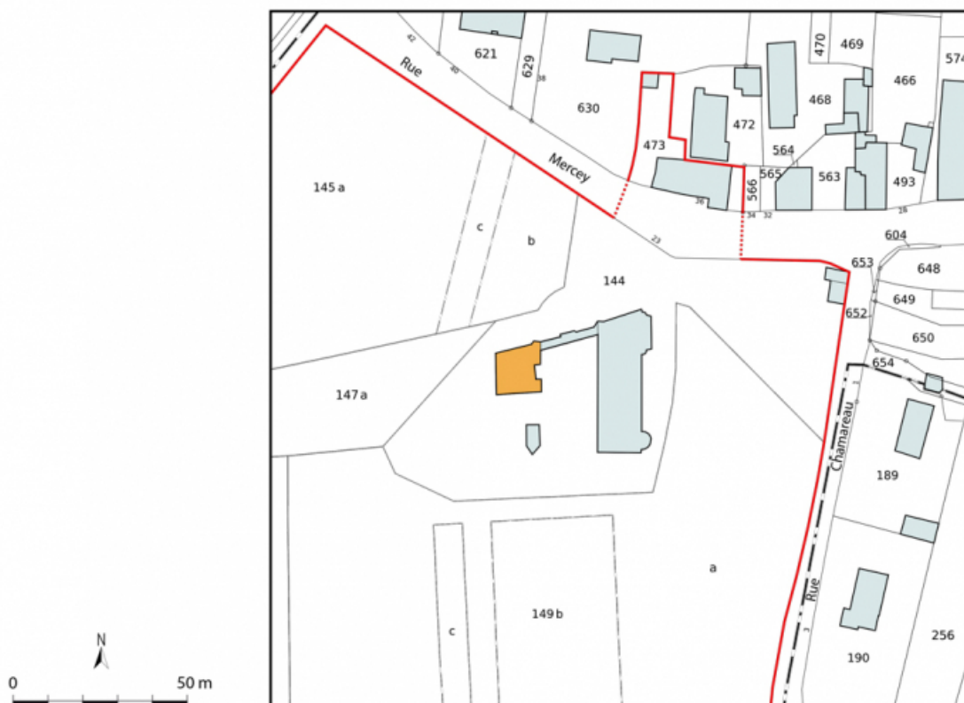
Plan-masse et de situation. Extrait du plan cadastral, 2021, section D, 1/1 250 agrandi à 1/1 000. 21, Chevigny-en-Valière, 2 rue Mercey