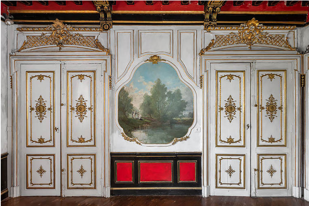
Salon : portes provenant de l'ambassade de Russie, rue du Faubourg Saint-Honoré à Paris. 21, Chevigny-en-Valière, 2 rue Mercey