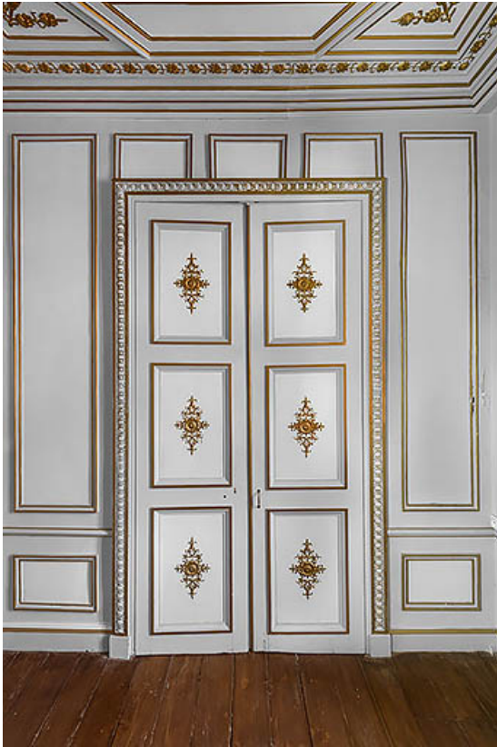
Bureau à l'étage : porte du palais des Tuileries, à Paris.