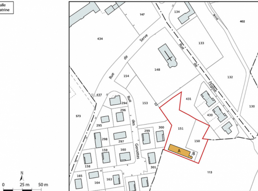
Plan-masse et de situation. Extrait du plan cadastral, 2021, section AC, 1/1 000 réduit à 1/1 250. 21, Lacanhe rue de l'Église