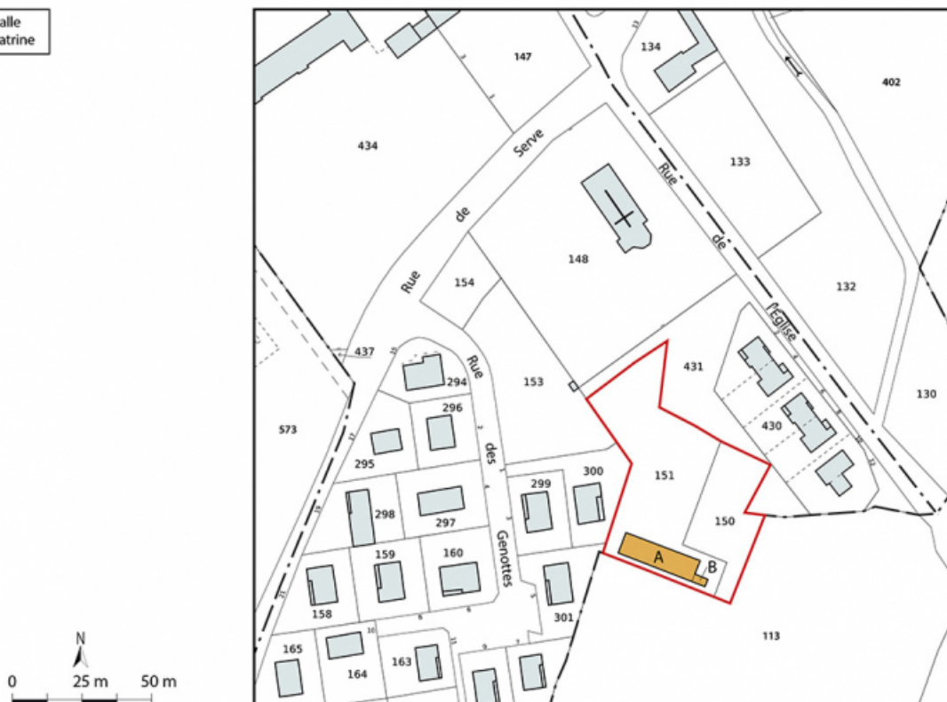
Plan-masse et de situation. Extrait du plan cadastral, 2021, section AC, 1/1 000 réduit à 1/1 250. 21, Lacanhe rue de l'Église