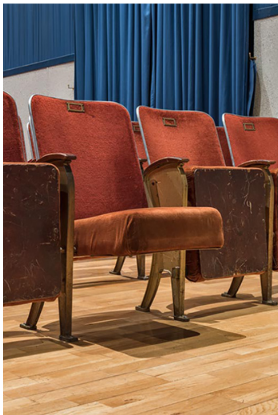
Salle, première rangée : siège assise ouverte. 21, Lacanhe rue de l' Église