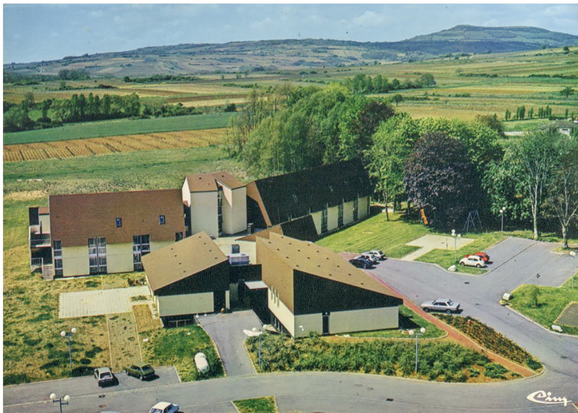
Centre thermal de 1978. 21, Santenay