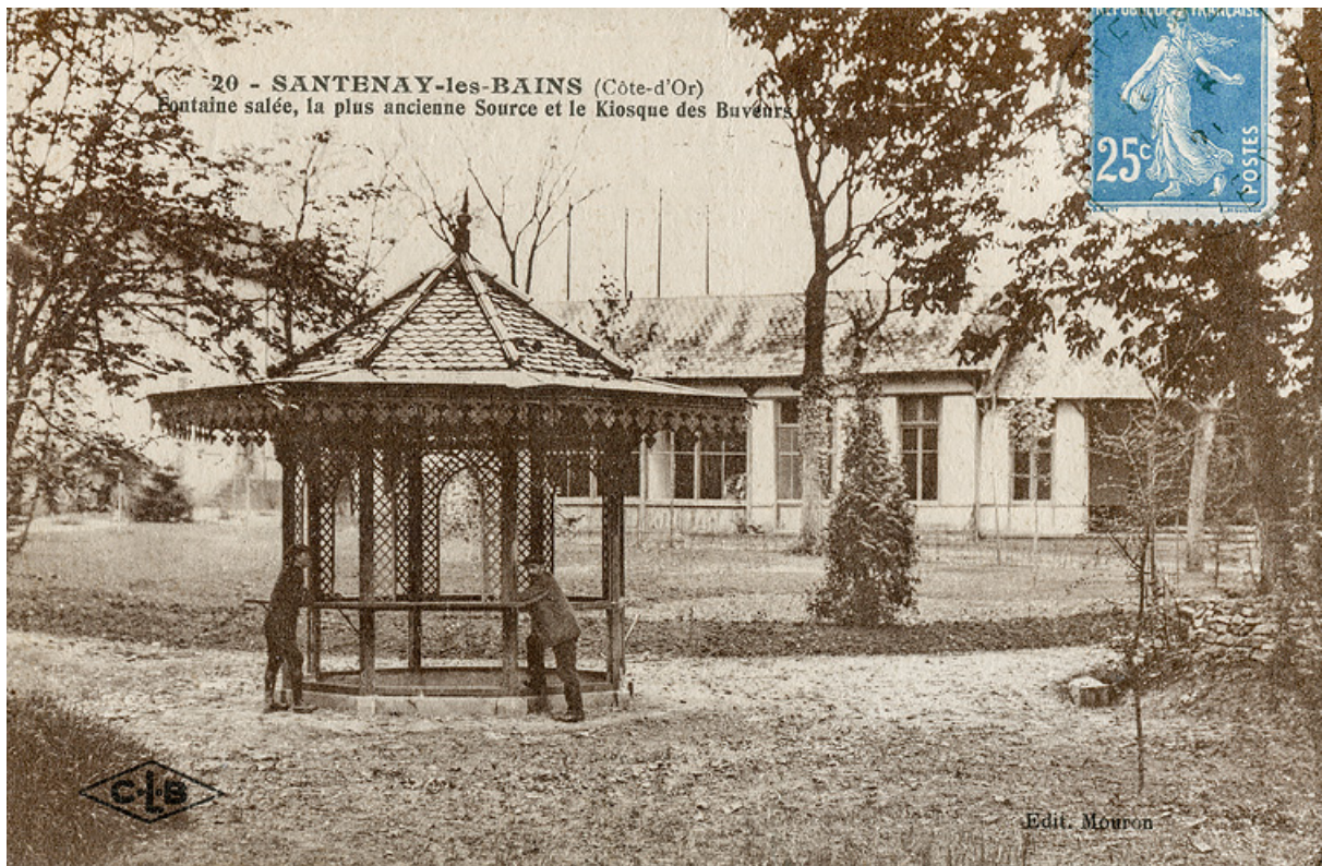
Établissement thermal de la Fontaine Salée.