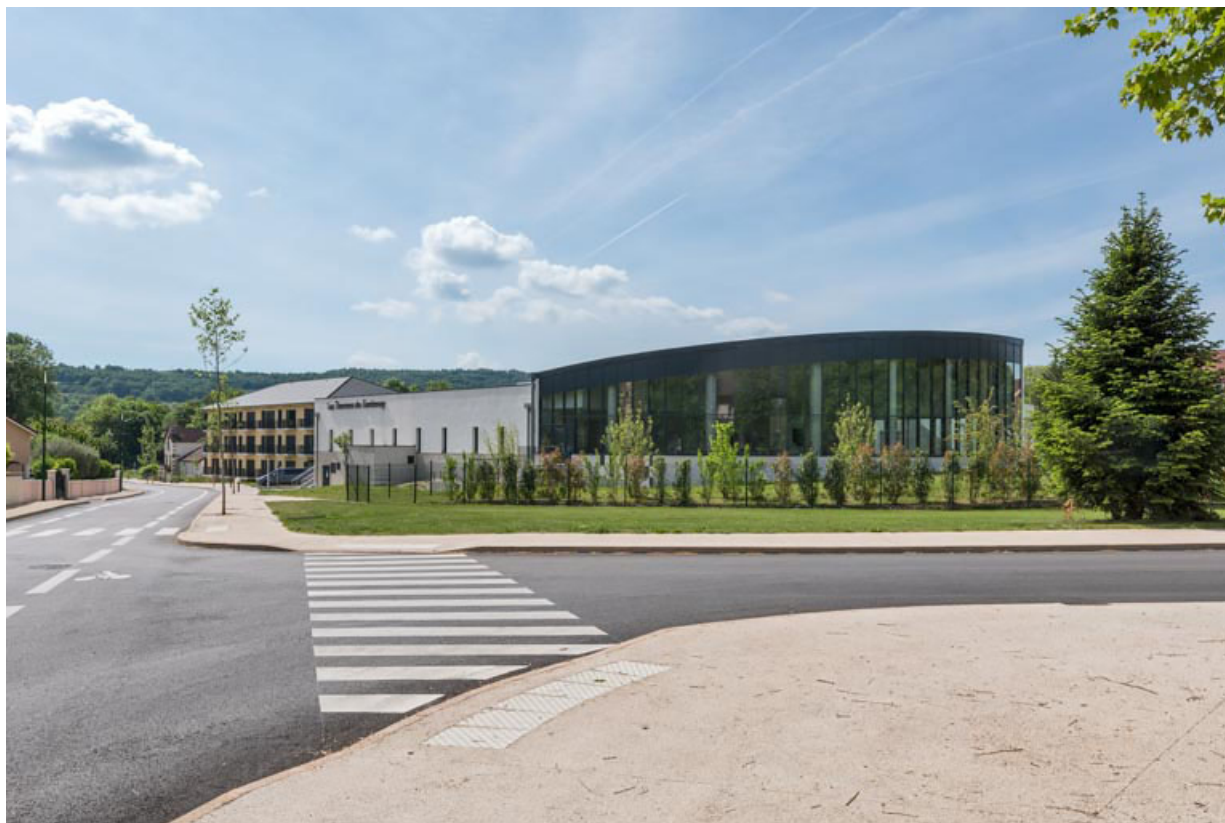
Centre thermal de 2021.