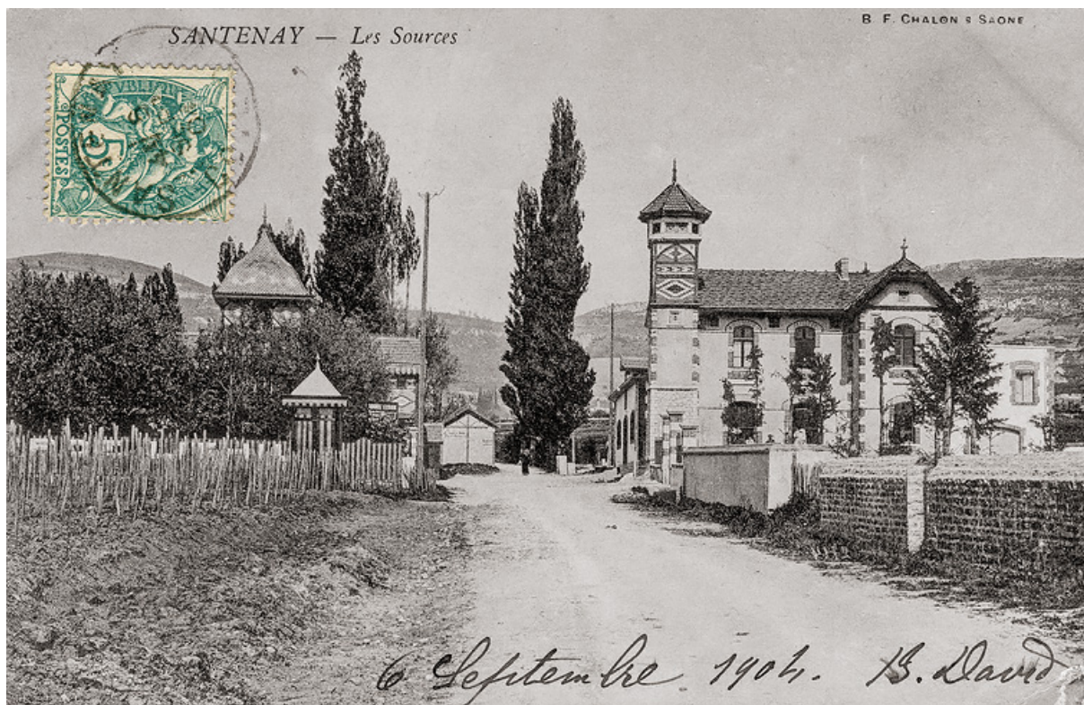
Vue depuis l'avenue des Sources (établissement à droite). 21, Santenay