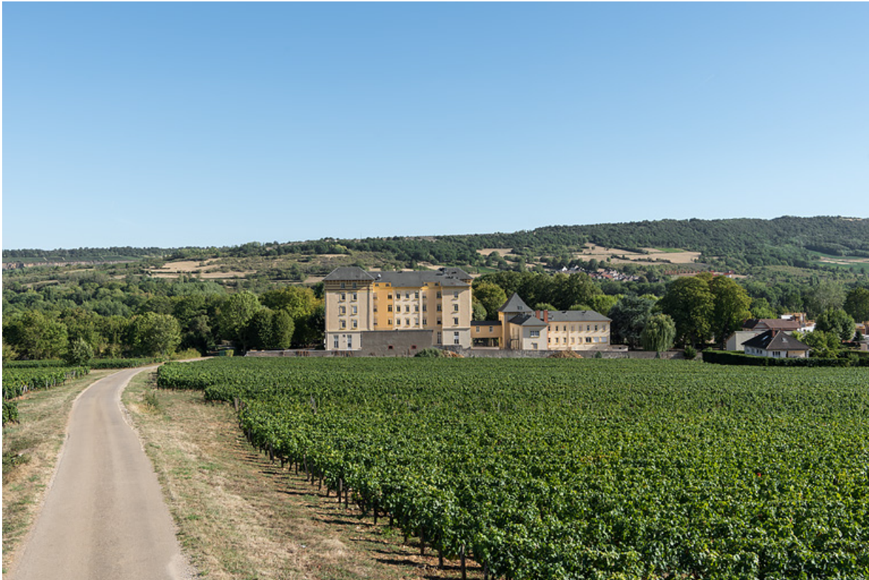
Chemin du potet en direction du Grand Hôtel des Bains. 21, Santenay