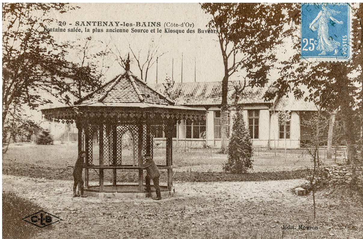
Établissement thermal de la Fontaine Salée.