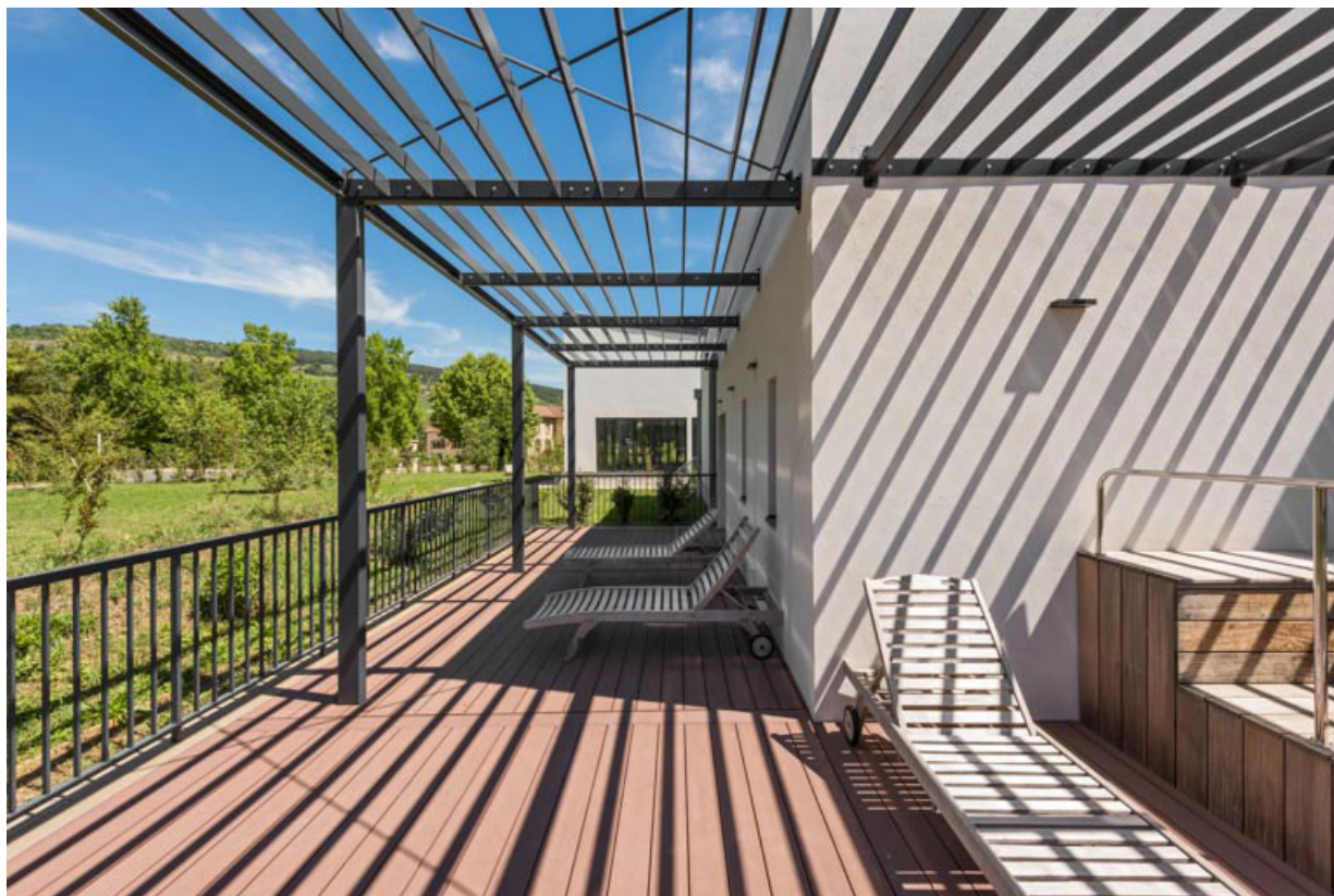
Centre thermal de 2021.