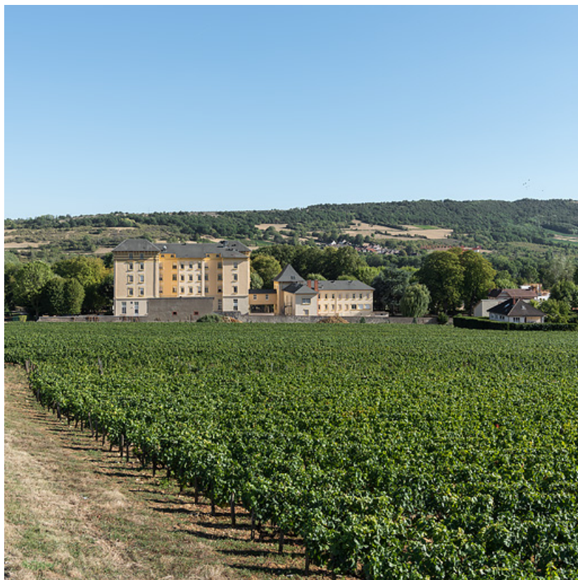
Chemin du potet en direction du Grand Hôtel des Bains.