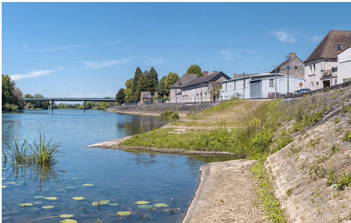
Les quais se poursuivent en aval du pont : rampe d'accès à la rivière.

21, Seurre quai du Midi, lieudit : PK 186,5