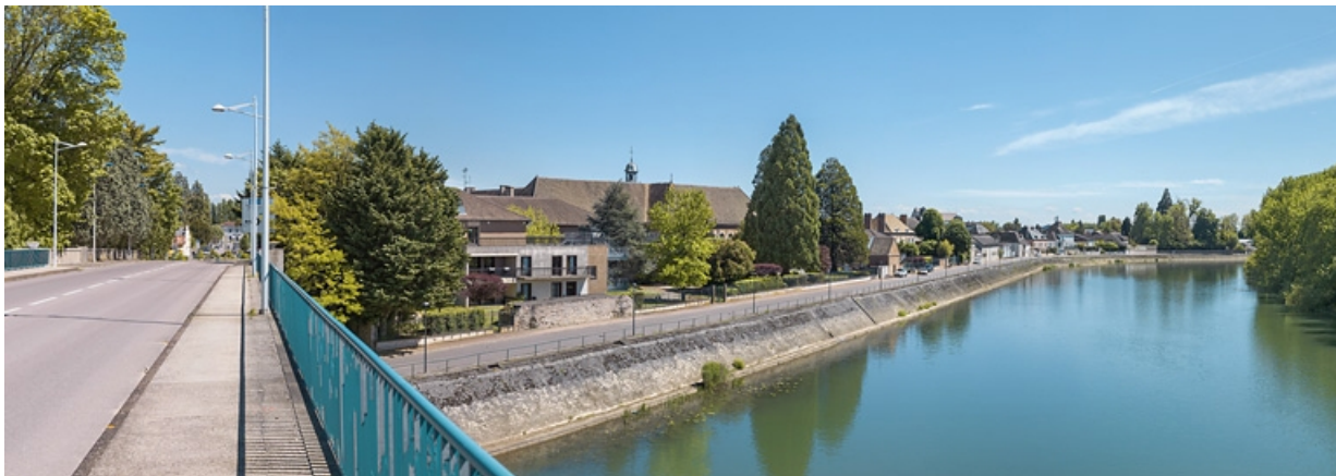
Vue des quais, en aval du pont routier de Seurre. On distingue les toits de l'hôtel-Dieu.

21, Seurre quai du Midi, lieudit : PK 186,5