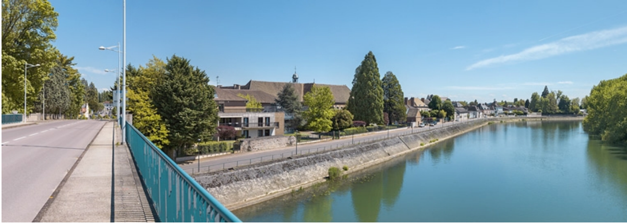
Vue des quais, en aval du pont routier de Seurre. On distingue les toits de l'hôtel-Dieu.

21, Seurre quai du Midi, lieudit : PK 186,5