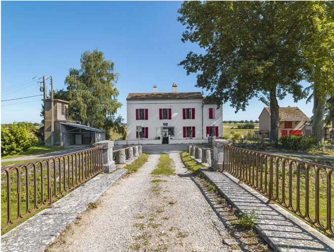
Le pont vu du dessus, au fond, la maison éclusière.