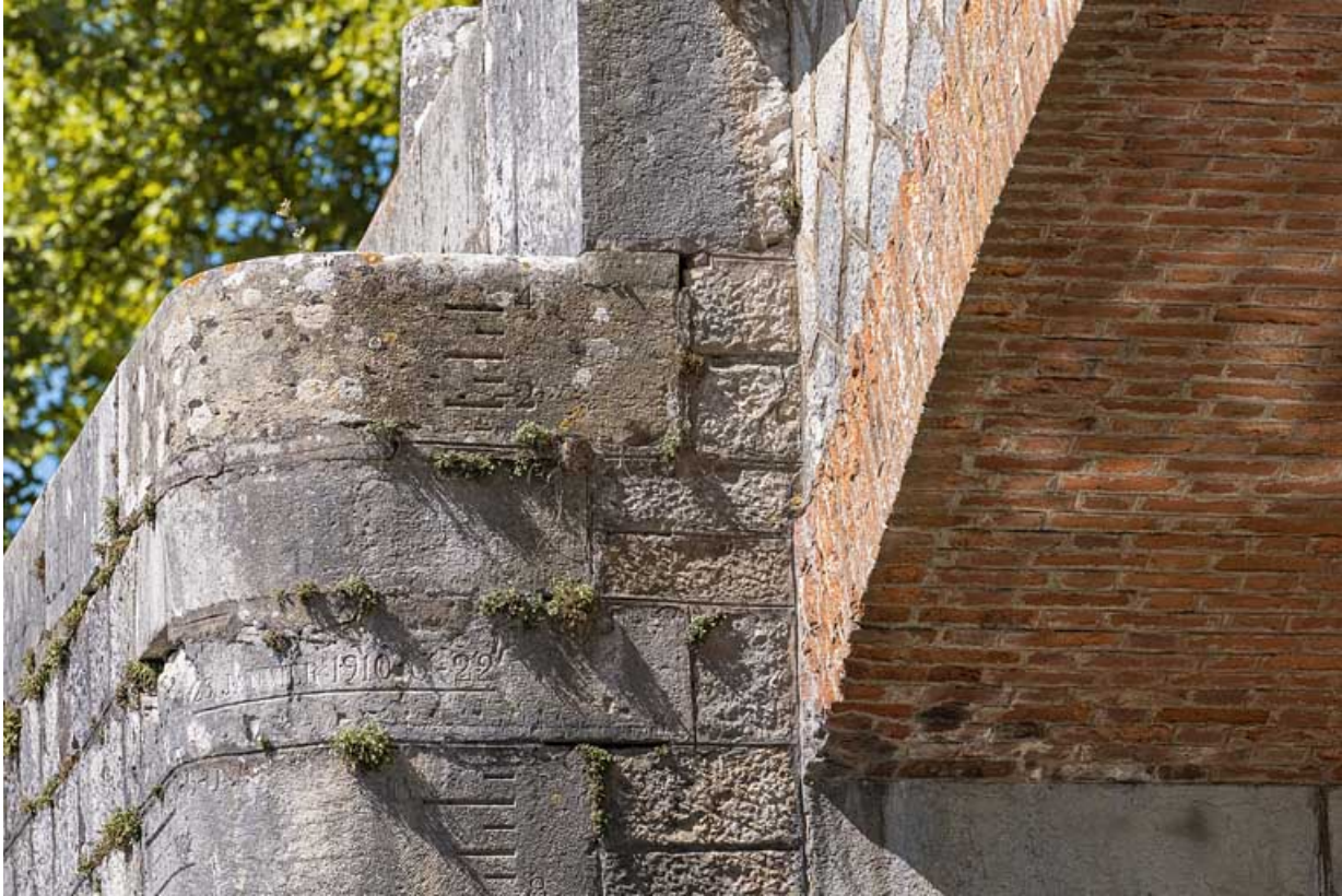
Détail de la voûte en brique et de l'échelle de crue sur la culée.