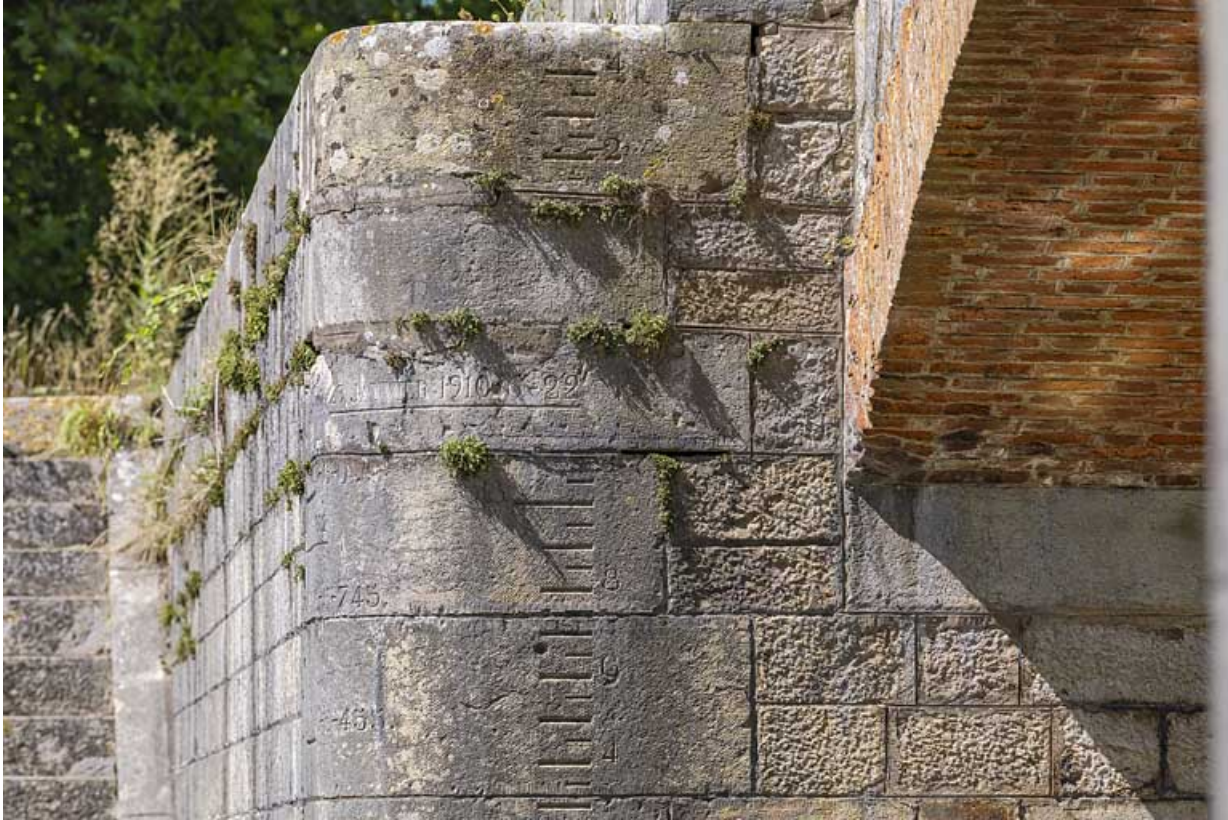
Détail de la voûte en brique et de l'échelle de crue sur la culée.