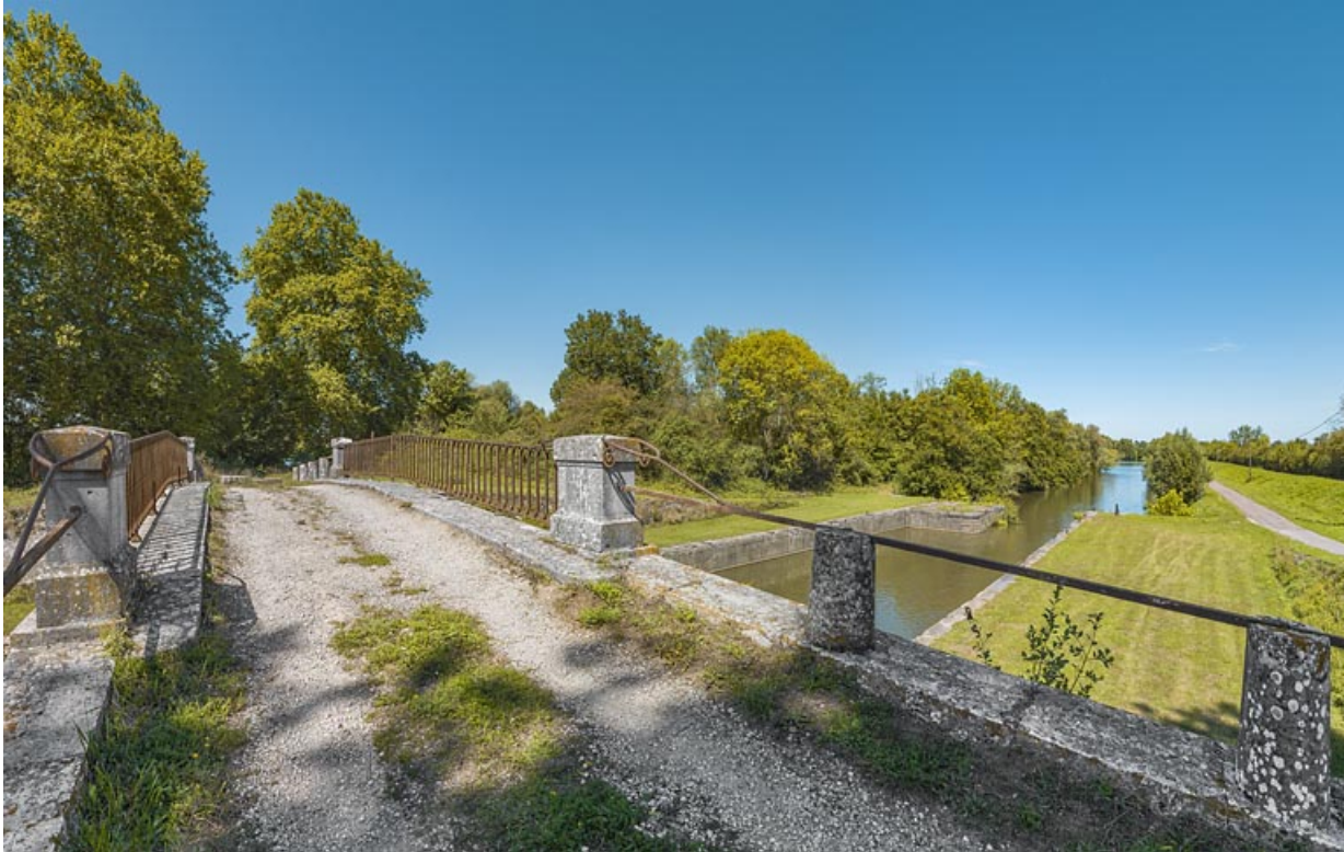
Vue d'ensemble du pont et de l'ancienne dérivation de Seurre.