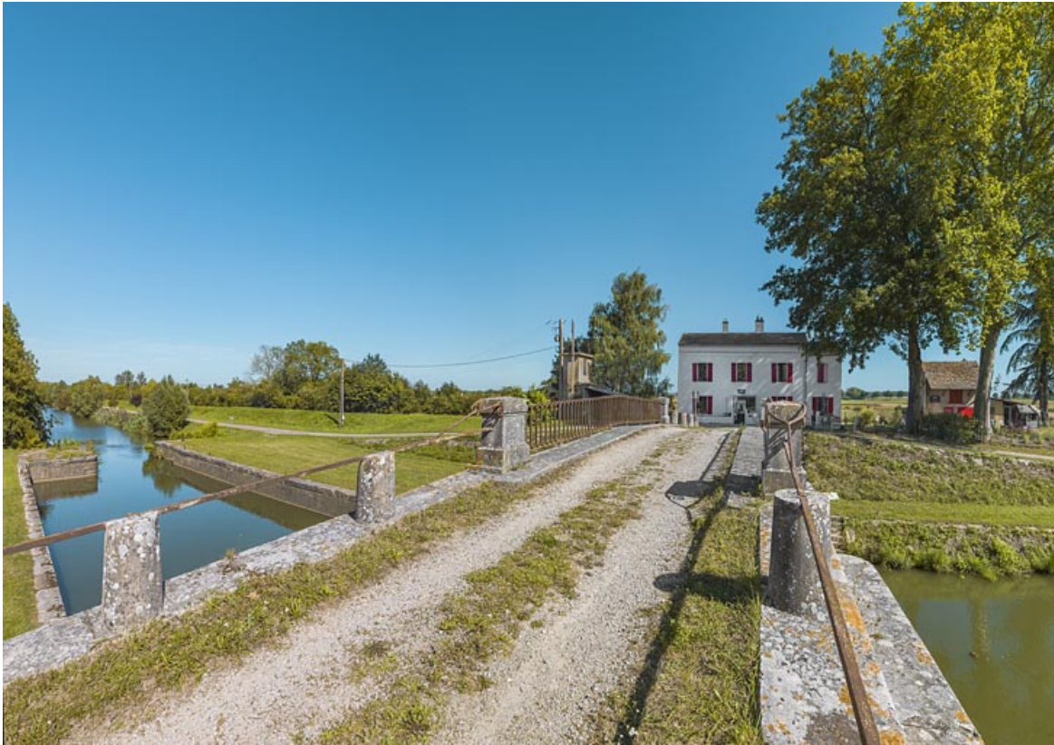
Le pont vu du dessus.