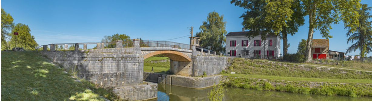
Vue d'ensemble du site avec le pont sur écluse vu d'aval.