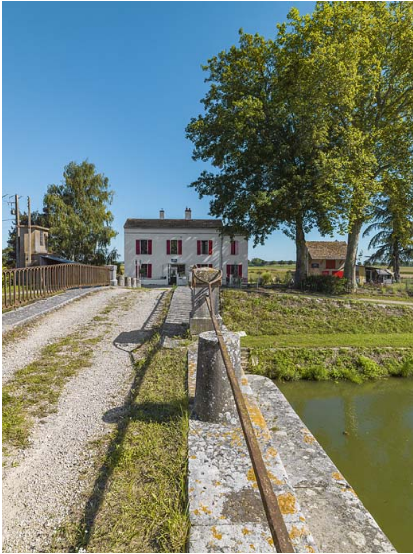
Le pont vu du dessus.