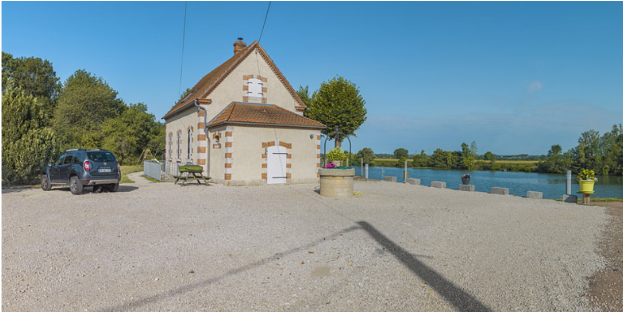
Vue de 3/4 : annexe latérale et face arrière. Au premier plan, le puits.