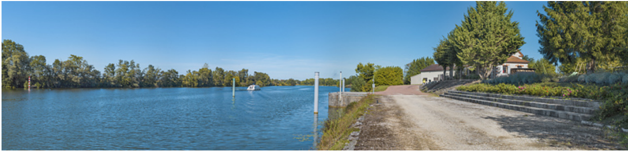
Le site de l'ancien barrage et la maison du barragiste, d'aval. Au fond, le bâtiment de VNF.