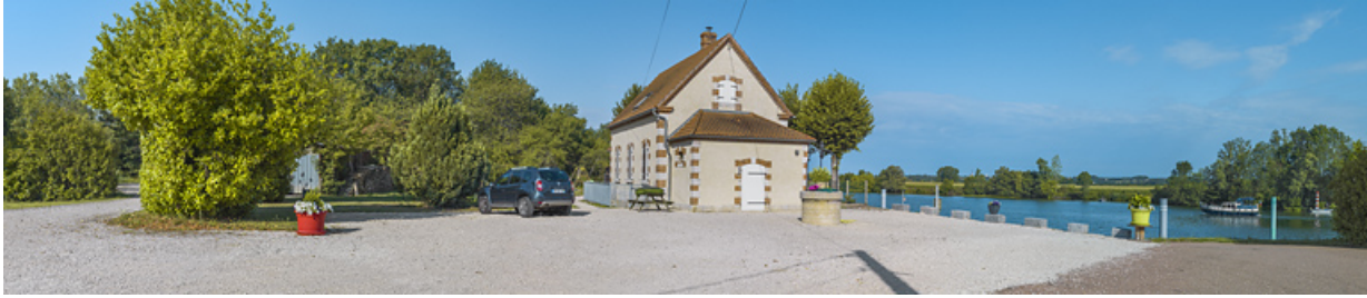
La maison du barragiste et le site de l'ancien barrage.