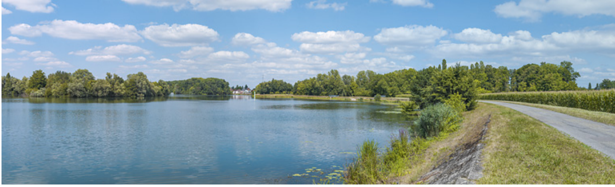
Vue d'ensemble d'aval des aménagements de rive à hauteur de Jallanges. En arrière-plan, la ville de Seurre. 21, Jallanges, lieudit : PK 186