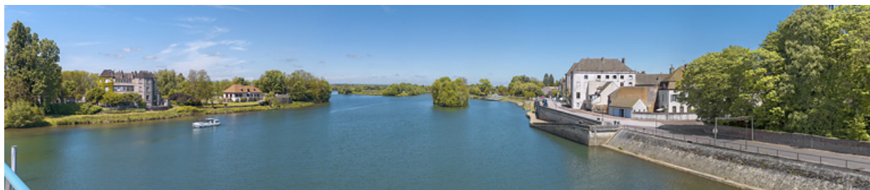
Panorama de Seurre : au centre, la Saône et à droite, les quais et la ville.