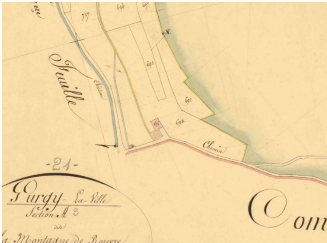
Extrait du plan cadastral dit napoléonien (archives départementales 21 : 3 P 320/4).

21, Gurgy-la-Ville, lieudit : Fourneau (le)