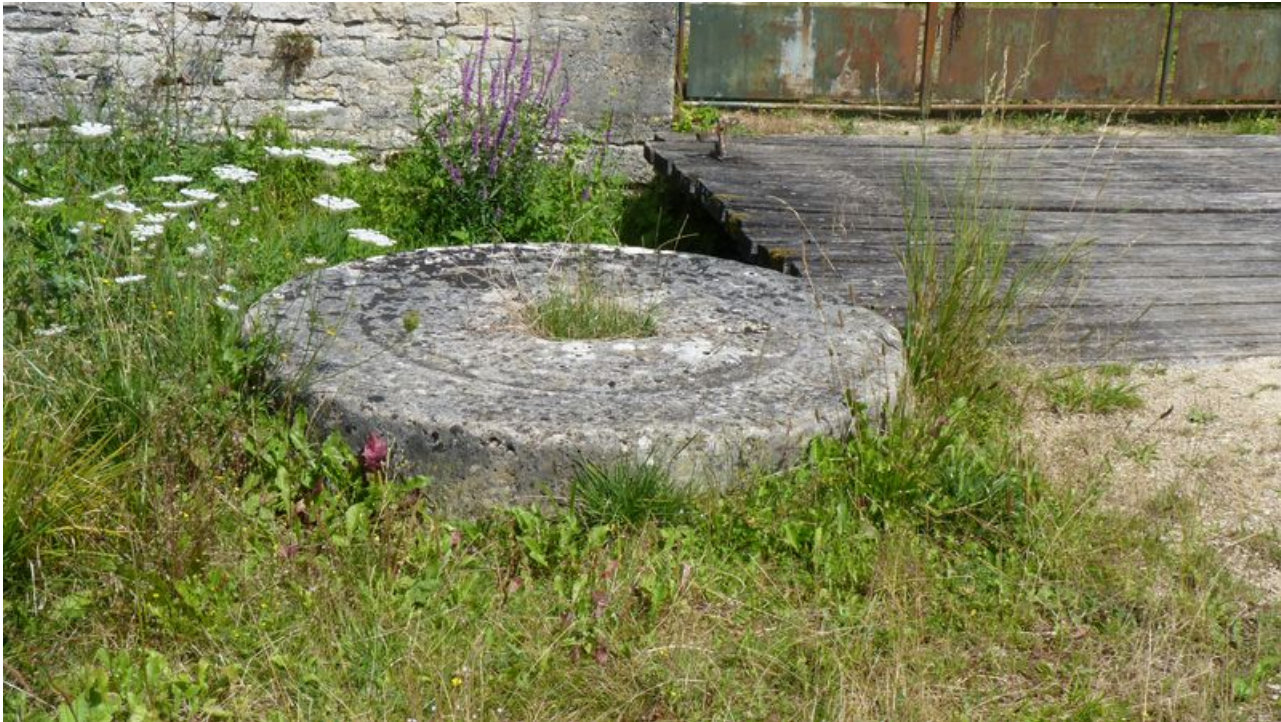
Vue des anciennes meules entreposées au pied de l'édifice.