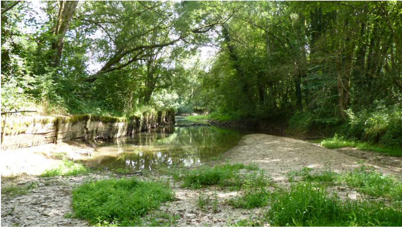
Vue du bief qui dessert le moulin.