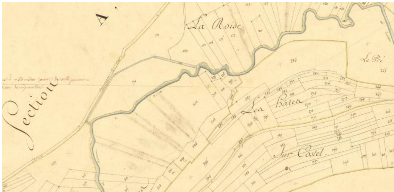
Plan cadastral napoléonien (AD 21 : 3 P 347/1).

21, Lignerolles, lieudit : Le Patouillet