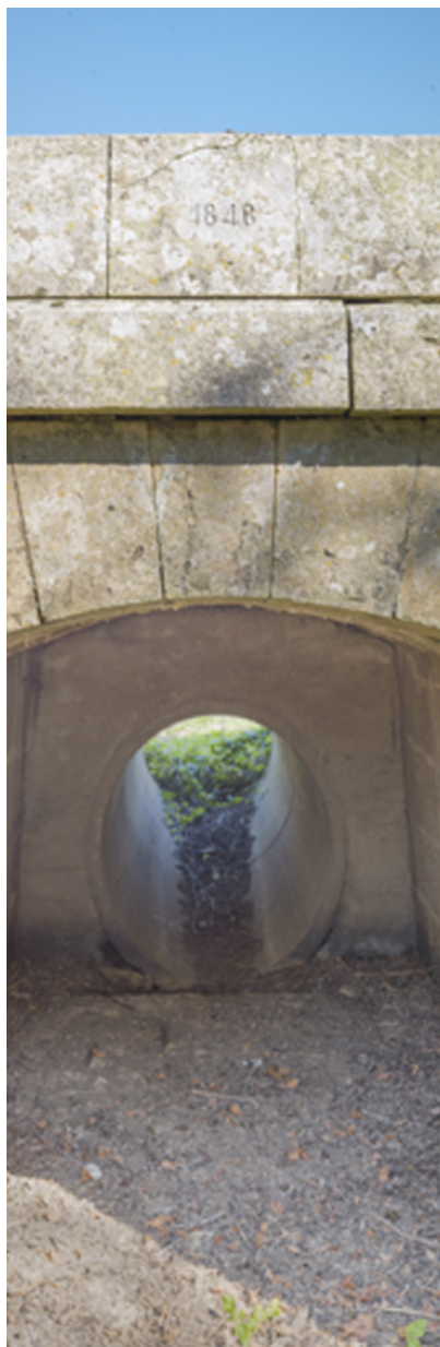
Détail de la maçonnerie en pierre de taille, particulièrement soignée.