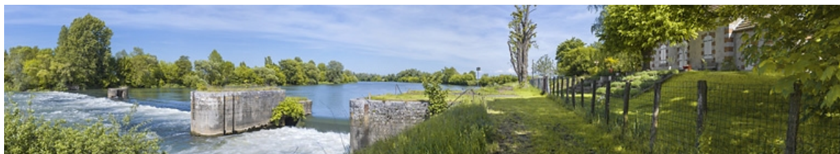
Vue d'ensemble de l'ancien barrage : au premier plan, le pertuis et à droite, la maison du barragiste.