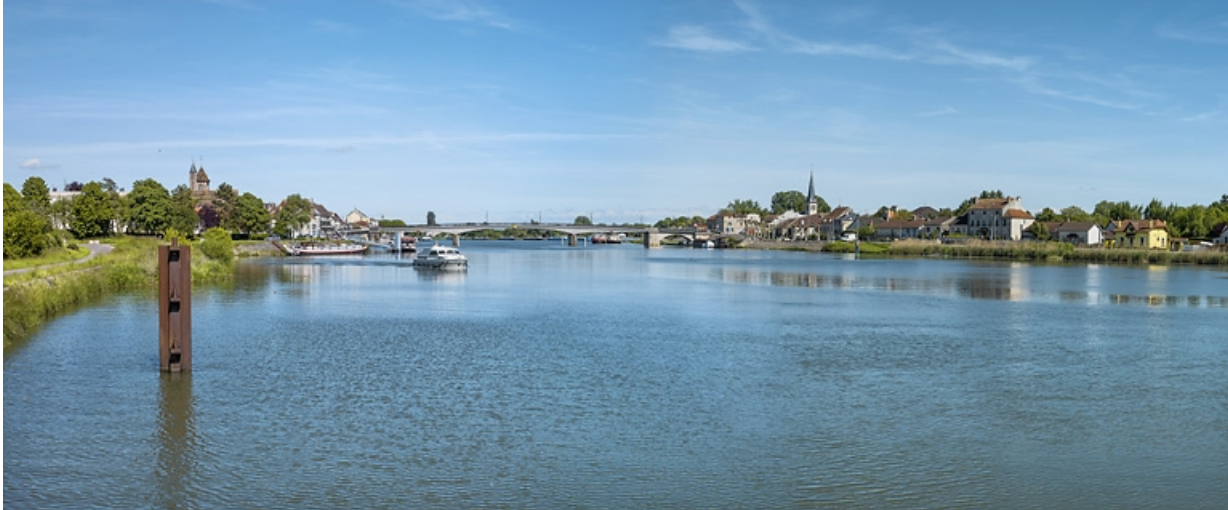
Vue d'ensemble de Losne, sur la rive gauche de la Saône.