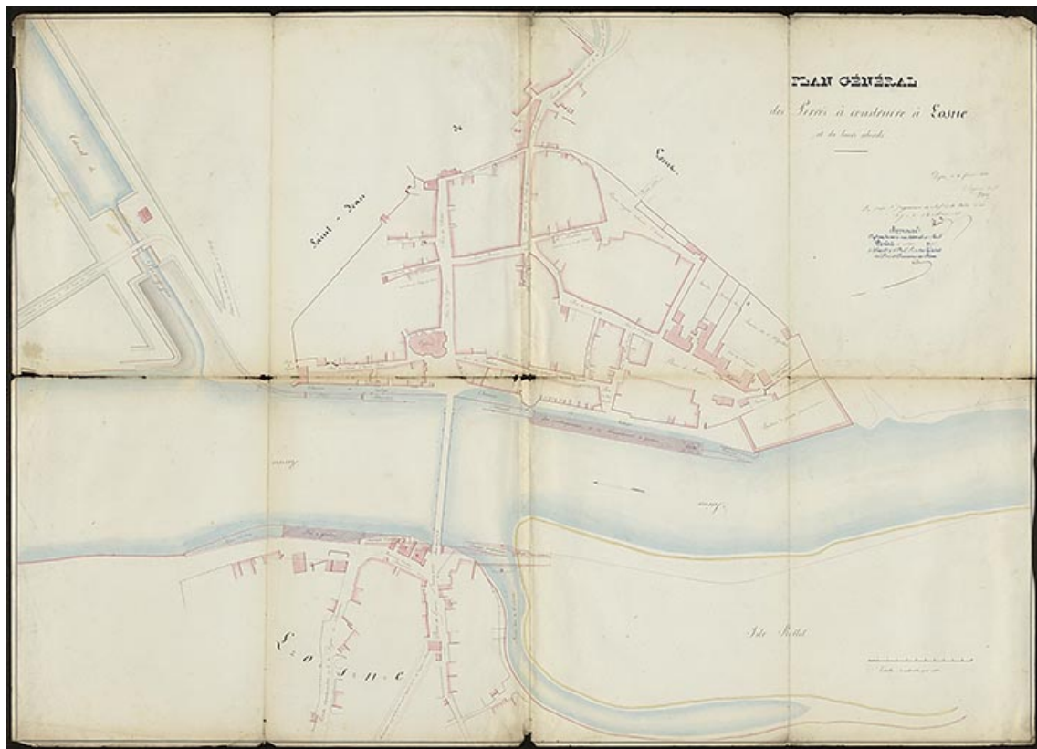
Plan général des perrés à construire à Losne et de leurs abords. 1838.