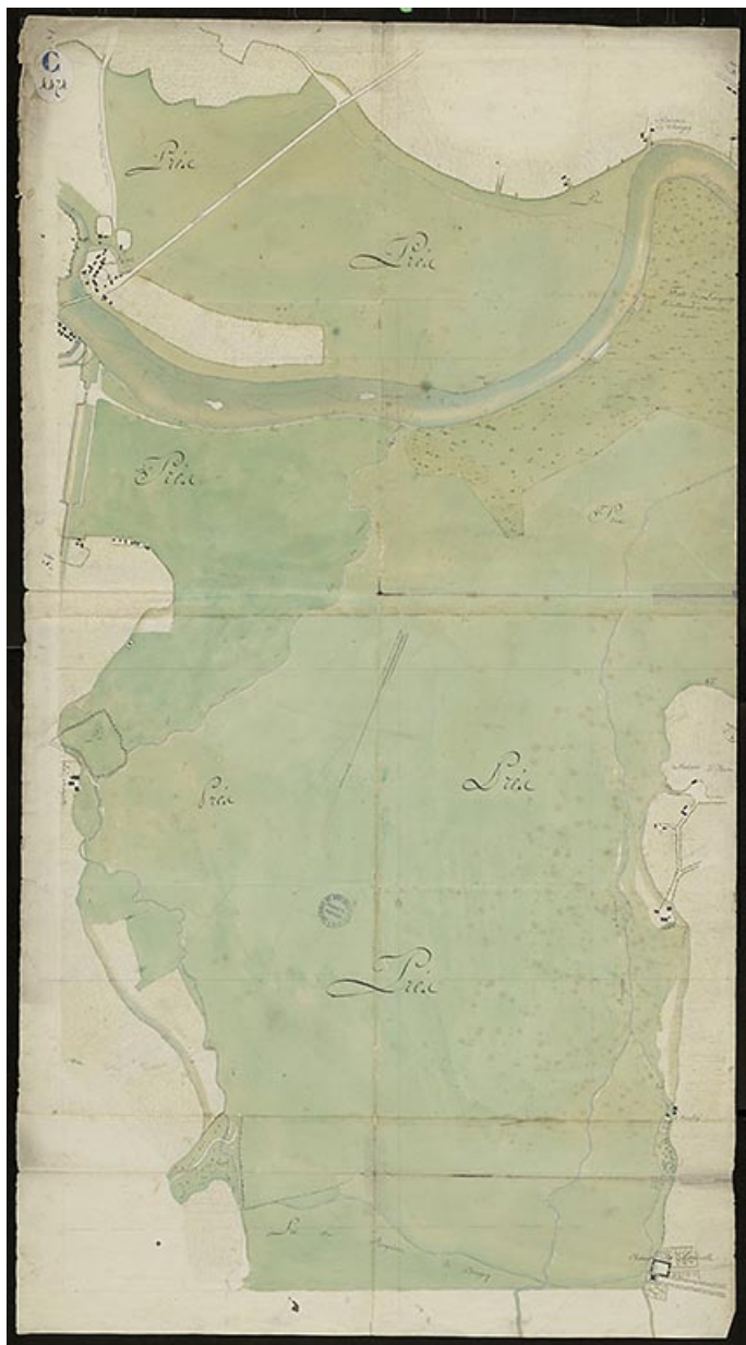
Plan n°13 du cours de la rivière sur les territoires de Losne, Chaugey et Esbarres. 1785.

Archives départementales de la Côte-d'Or. Série C : C 4474. Plan n°13 du cours de la Saône sur les territoires de Losne, Chaugey et Esbarres. 1785 ?.