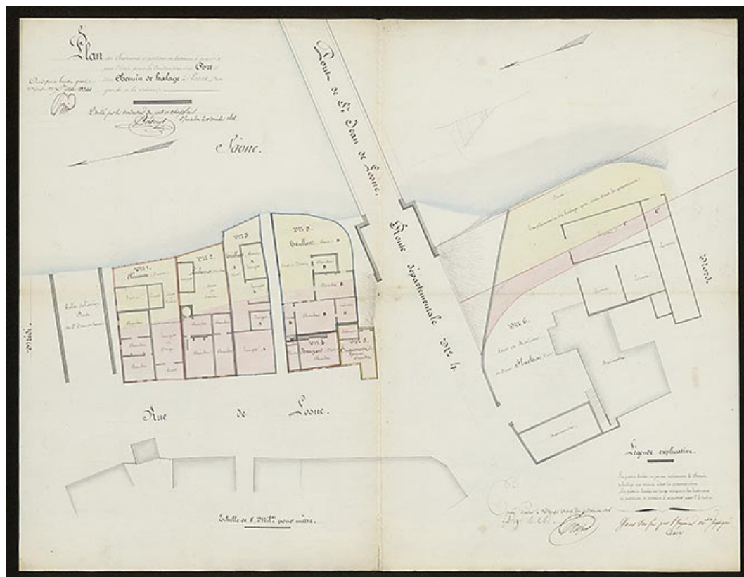
Plan des bâtiments et portions de terrains à acquérir par l'Etat pour la construction d'un port et d'un chemin de halage à Losne (rive gauche de la Saône). 1838.