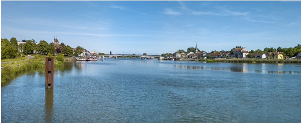
Vue d'ensemble de Losne, sur la rive gauche de la Saône.