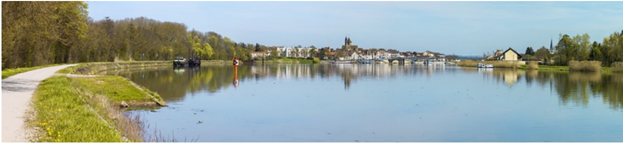
Vue d'ensemble de Saint-Jean-de-Losne, sur la rive droite de la Saône.