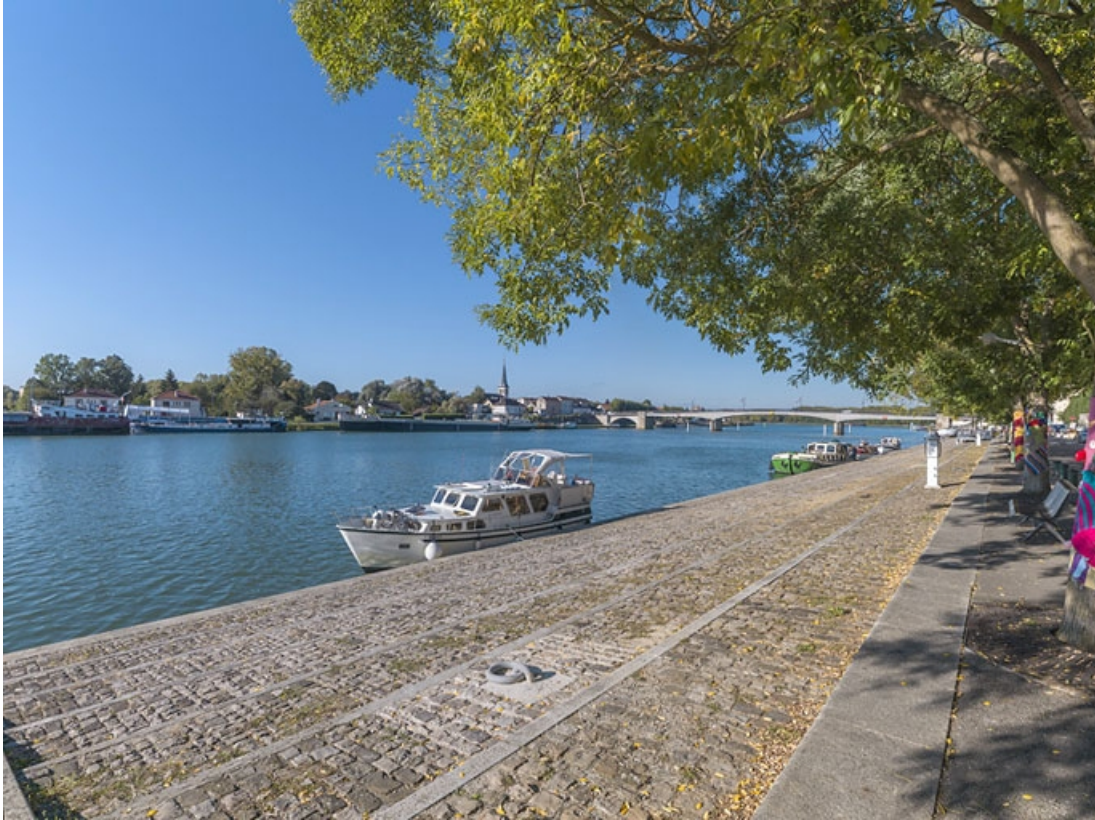
Vue d'ensemble des quais à gradins de Saint-Jean-de-Losne.