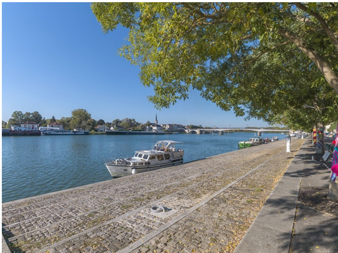
Vue d'ensemble des quais à gradins de Saint-Jean-de-Losne.