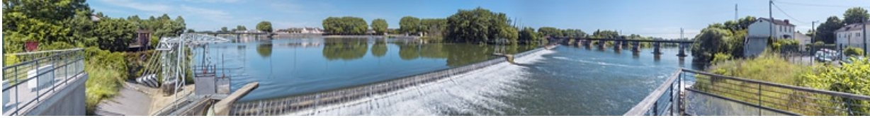
La ville vue depuis la rive droite de la Saône, au belvédère du barrage. 21, Auxonne