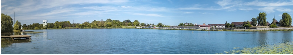
La ville vue depuis la rive droite de la Saône. Au centre, le Port Royal. 21, Auxonne