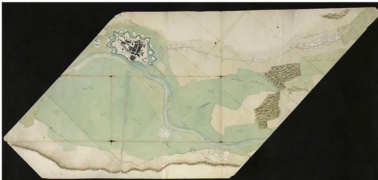
Plan n° 8 du cours de la rivière sur les territoires d'Auxonne et de Labergement. 1785.

Archives départementales de la Côte-d'Or : C 4469. Plan n°8 du cours de la Saône sur les territoires d'Auxonne et de Labergement. 1785 ?.