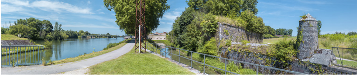
Le pont et les fortifications de la ville, depuis le chemin de halage. A droite, le contre-fossé longeant la dérivation d'Auxonne. 21, Auxonne