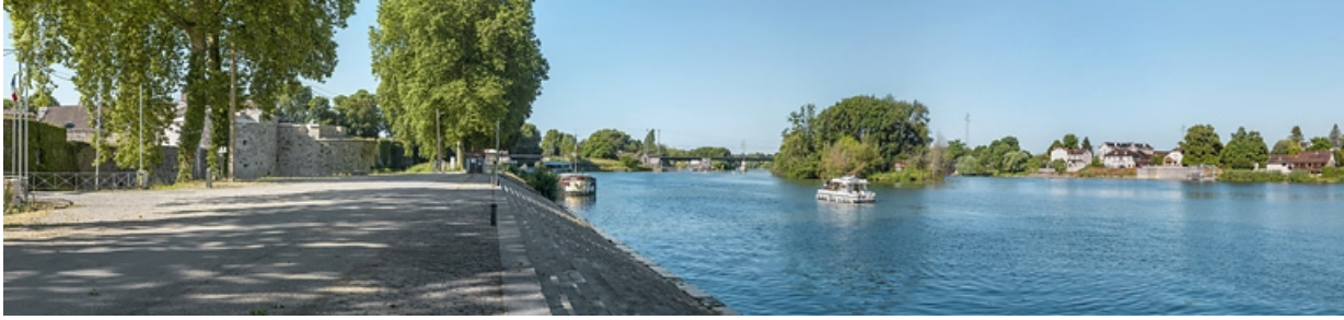
Le château, l'entrée de la dérivation, le pont ferroviaire et la gare d'Auxonne vus depuis les quais. 21, Auxonne