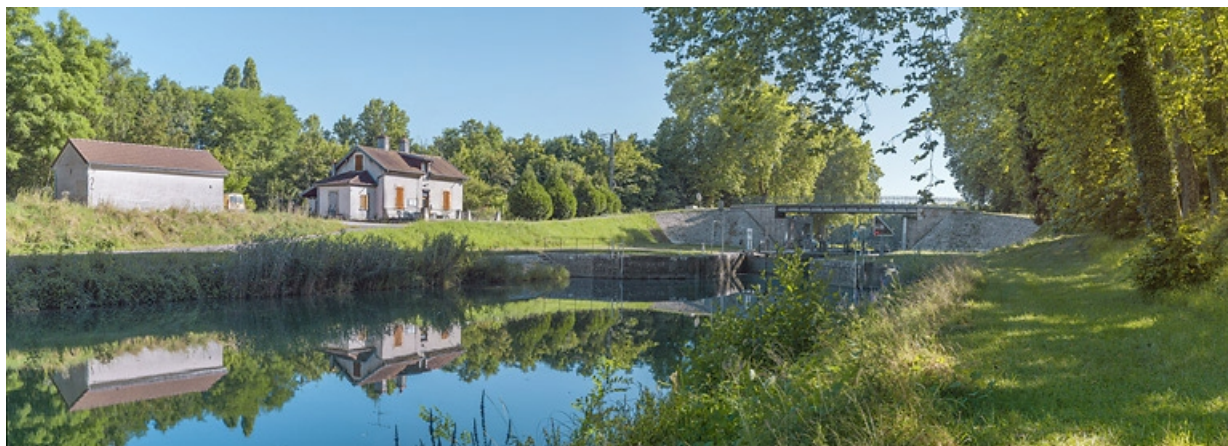
Vue d'ensemble : à gauche, la maison éclésièr et au centre, le sas et le pont sur écluse. 21, Auxonne, lieudit : PK 229,8