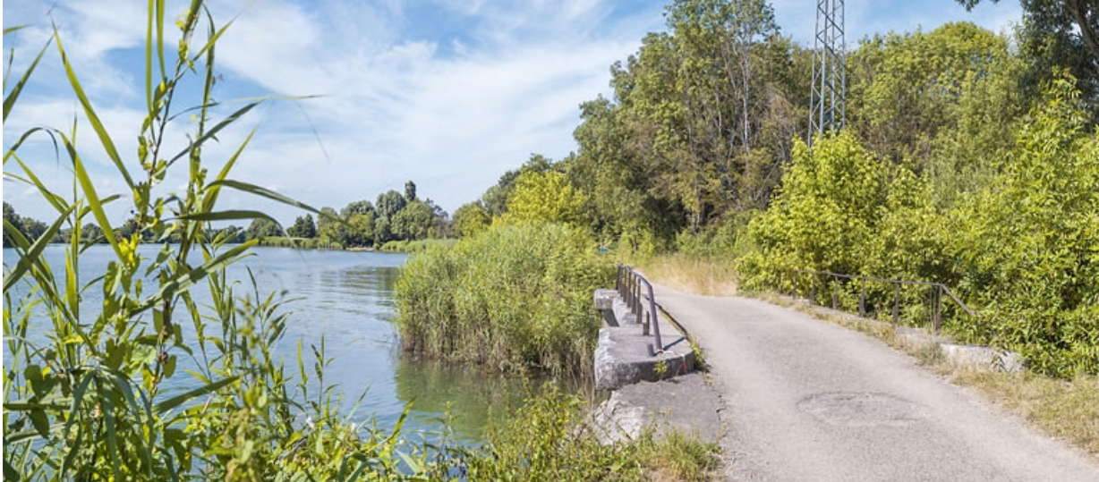
Vue d'ensemble. A gauche, la Saône.