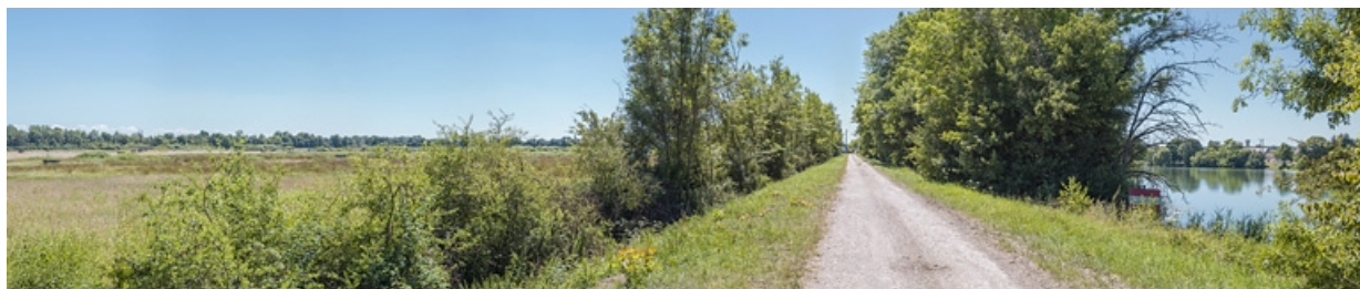
La Saône à hauteur de Flammerans, sur le chemin conduisant au barrage de Poncey. A gauche, on aperçoit de nombreux puits et à droite, la Saône.