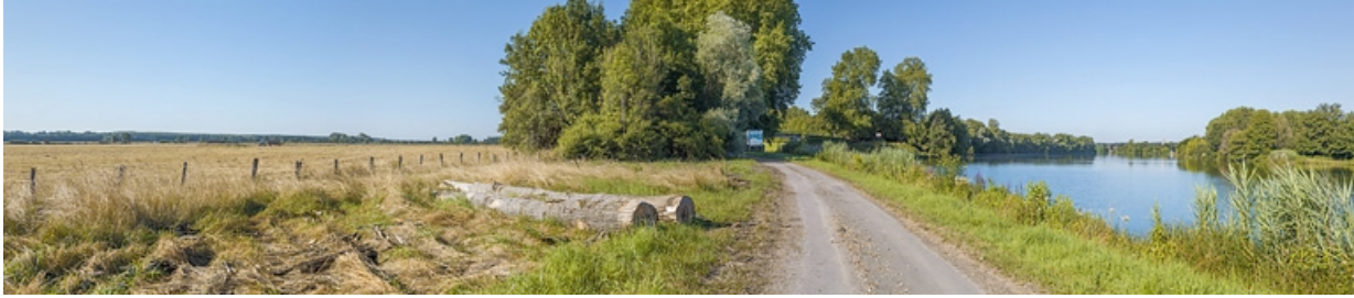
L'entrée de la dérivation, rive gauche de la Saône.