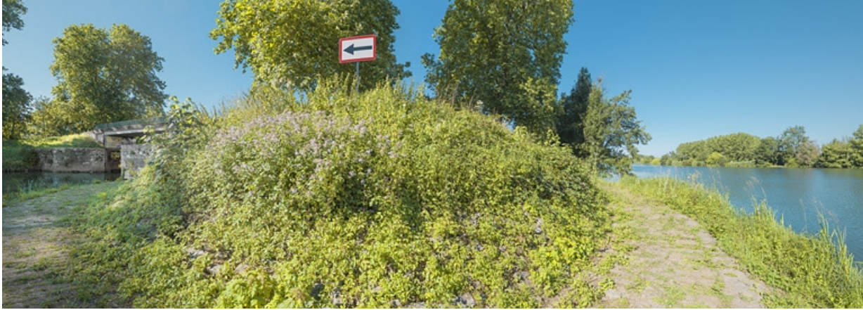
A gauche, l'entrée de la dérivation et à droite, la Saône. 21, Flammerans