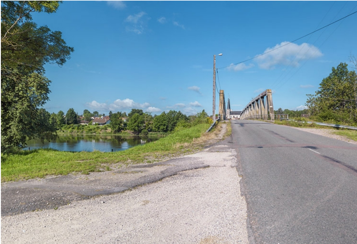
Vue d'ensemble, rive gauche.

21, Lamarche-sur-Saône route départementale 116, lieudit : PK 245,6