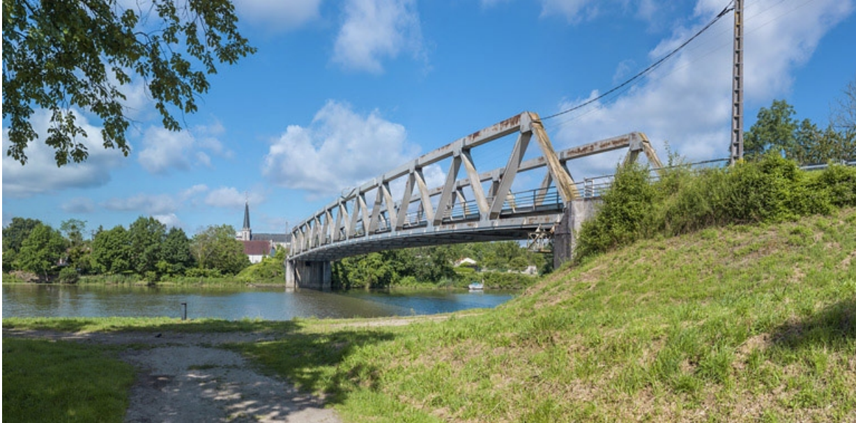
Pont routier de Lamarche-sur-Saône (21).