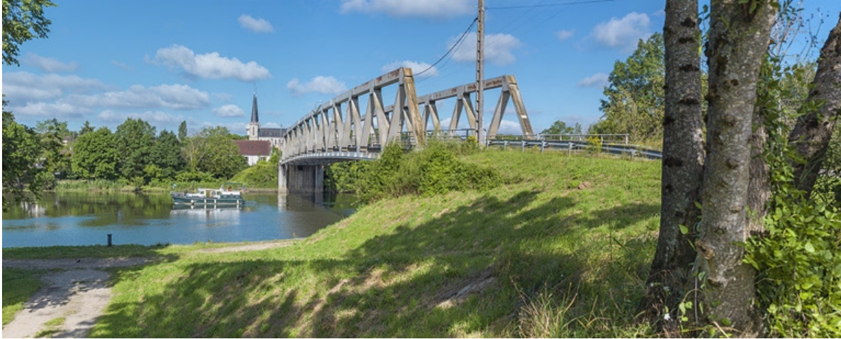
Vue d'ensemble, rive gauche.