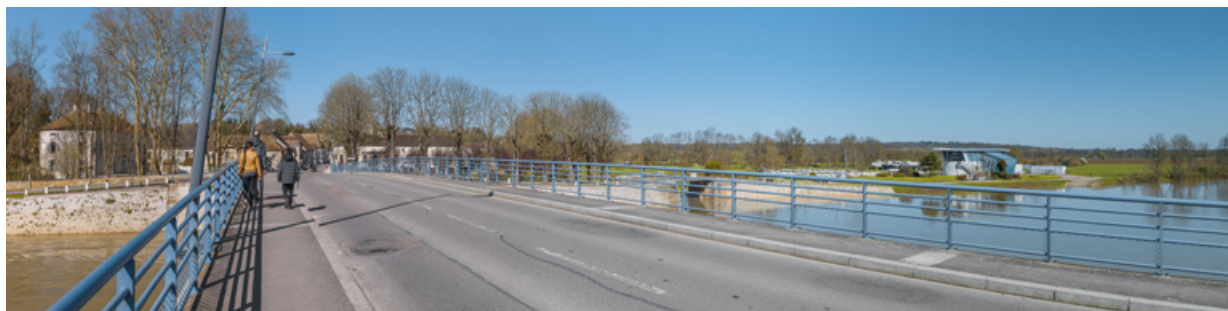
Vue d'ensemble du village de Pontaller-sur-Saône et du port, depuis le pont.

21, Pontaller-sur-Saône route départementale 959, lieudit : PK 251.5