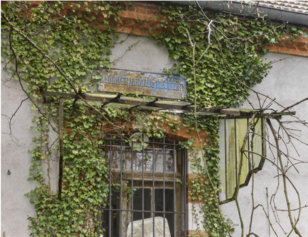
Détail de la plaque indiquant "barrage mobile d'Heuilley", au-dessus de la porte d'entrée.

21, Heuilley-sur-Saône, lieudit : Ile de Fley