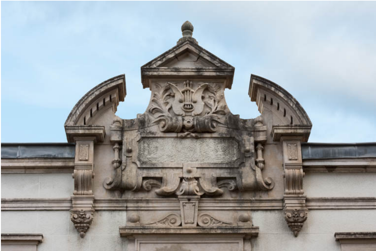
Façade antérieure : fronton échancré sculpté.