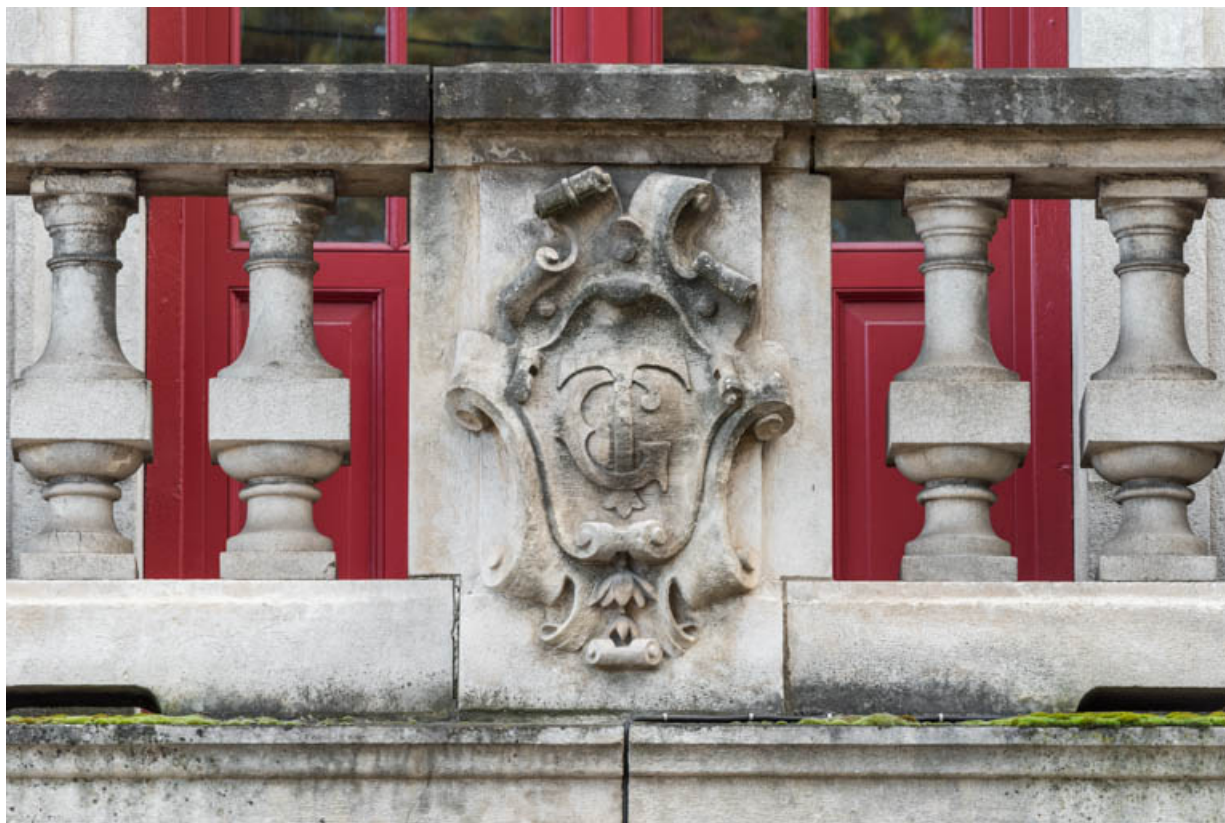
Façade antérieure : décor sculpté du balcon (cuir découpé et initiales C T). 21, Beaune, 12 boulevard Jules Ferry