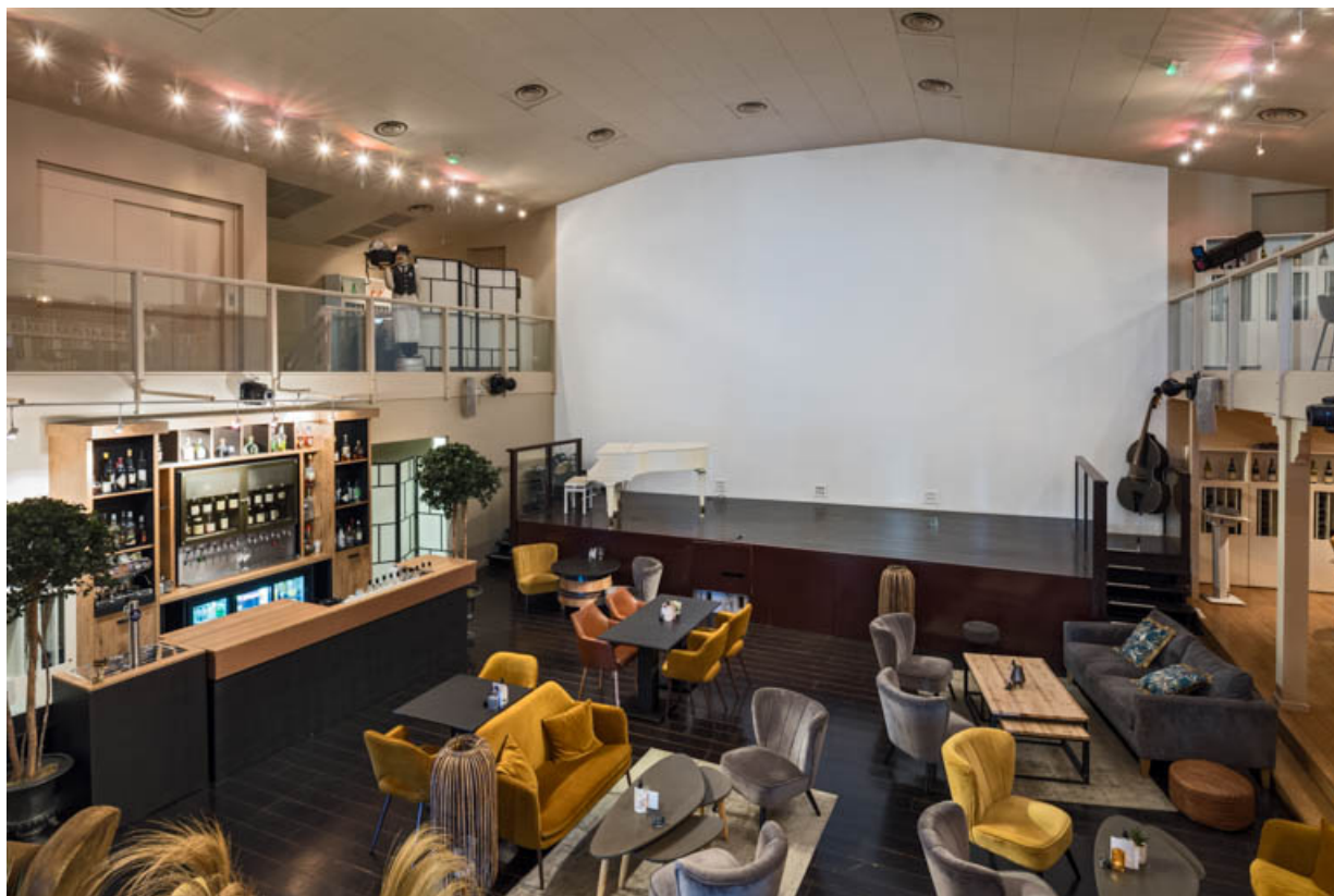
Intérieur de la salle.