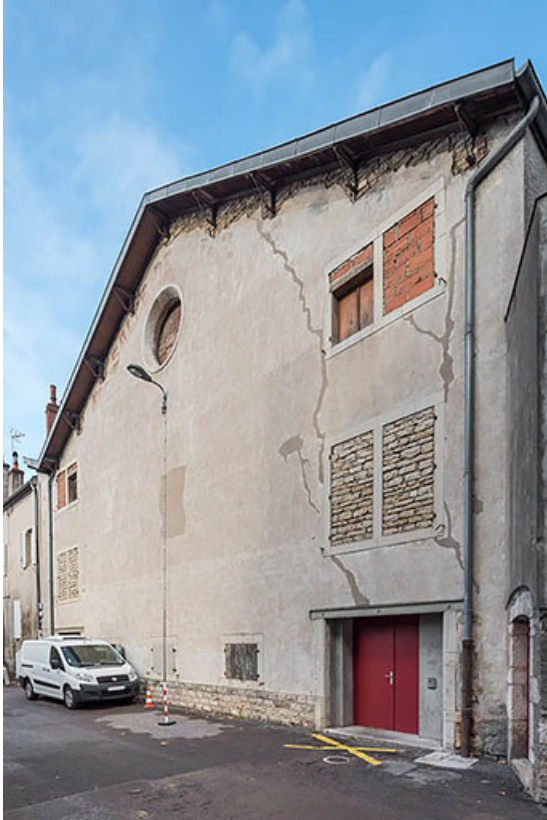
Façade postérieure, de trois quarts droite.