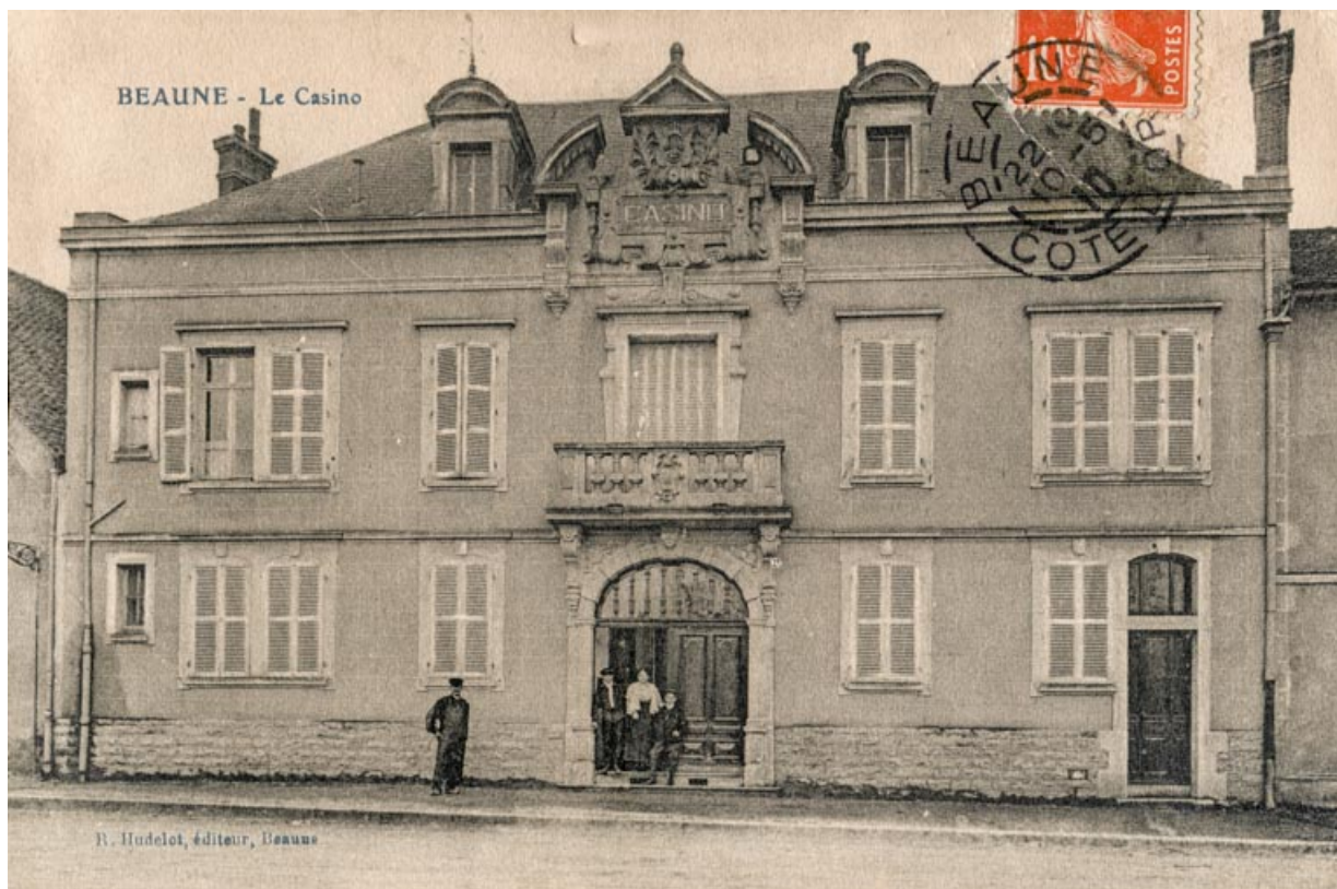
Beaune - Le Casino. S.d. [1er quart 20e siècle, avant 1910].