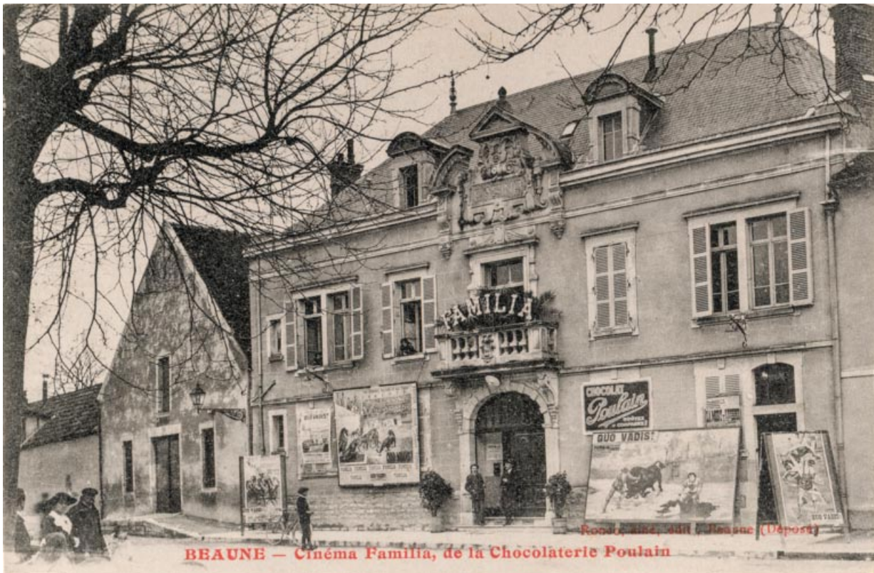
Beaune - Cinéma Familia, de la Chocolaterie Poulain. S.d. [1er quart 20e siècle].