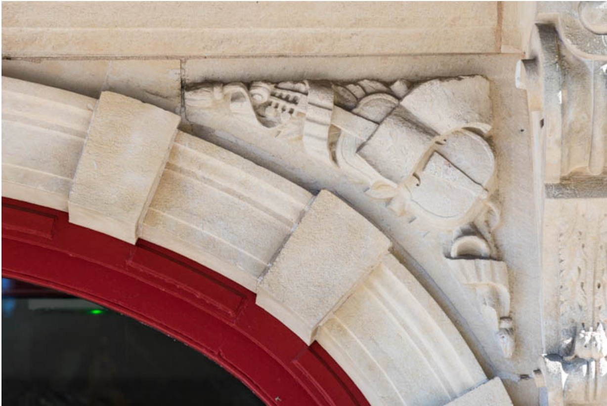
Façade antérieure : instruments de musique sculptés sur l'écoinçon droit de l'entrée.