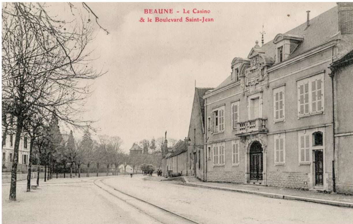
Beaune - Le Casino & le Boulevard Saint-Jean. S.d. [1er quart 20e siècle, décennie 1910]. 21, Beaune, 12 boulevard Jules Ferry

Beaune - Le Casino & le Boulevard Saint-Jean. Carte postale, s.n. S.d. [1er quart 20e siècle, décennie 1910]. Ronco Frères éd., Beaune. Date 14 aout 191. (tampon au recto) portée sur un autre tirage de la carte. Lieu de conservation : Archives municipales, Beaune - Cote du document : 4 Fi 22