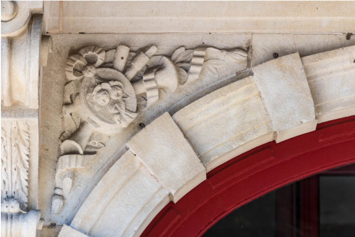
Façade antérieure : instruments de musique sculptés sur l'écoinçon gauche de l'entrée. 21, Beaune, 12 boulevard Jules Ferry