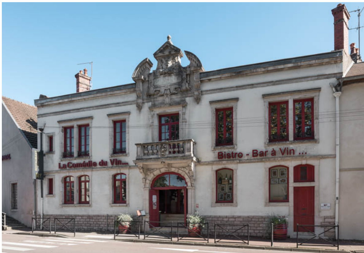
Façade antérieure, de trois quarts droite.