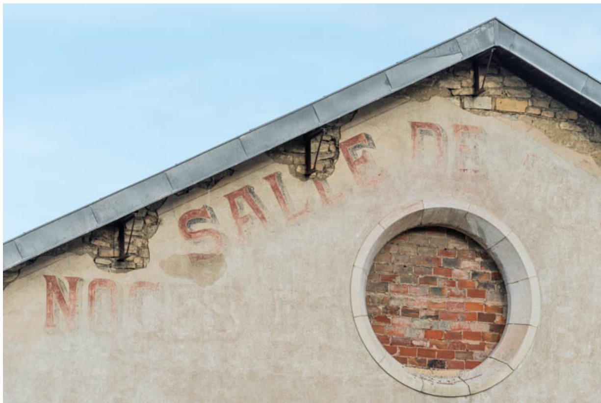
Façade postérieure : oculus et inscriptions peintes sur le fronton.