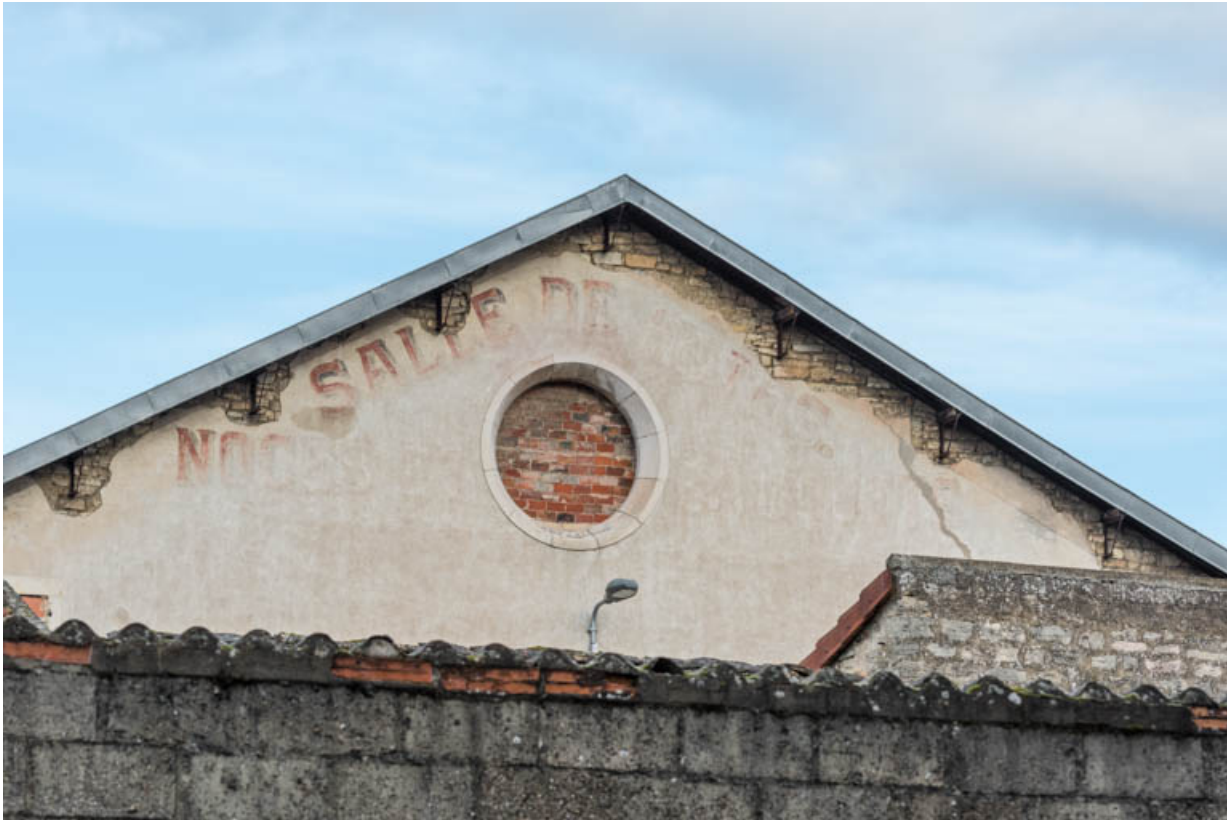
Façade postérieure : fronton et inscriptions peintes.