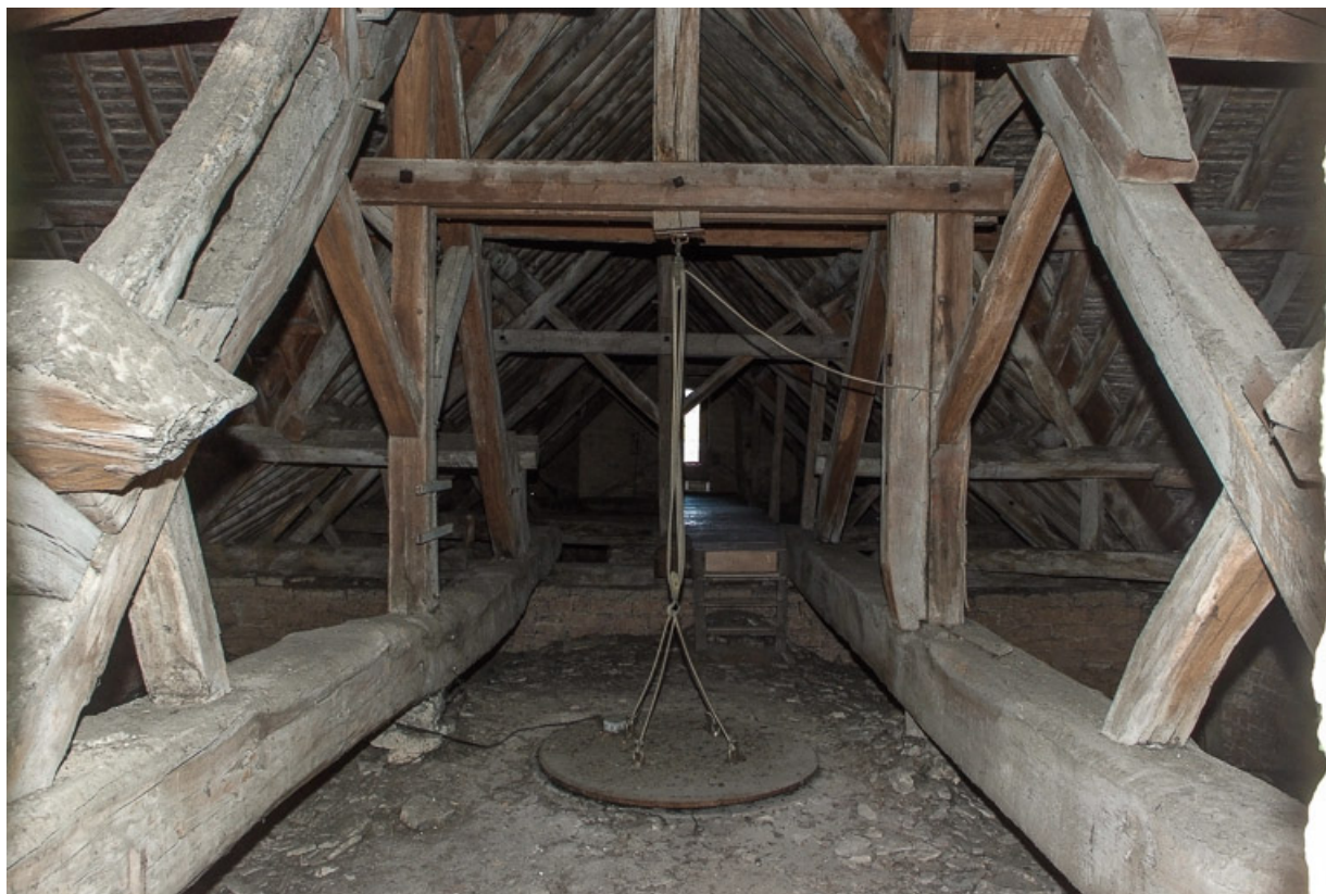
Comble, vue prise au-dessus de la croisée.