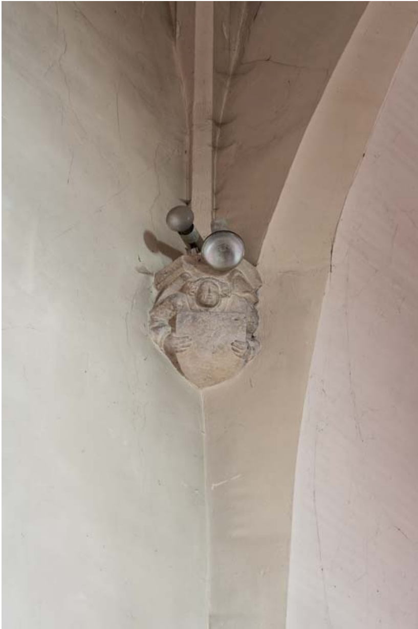
Culot de la croisée du transept.