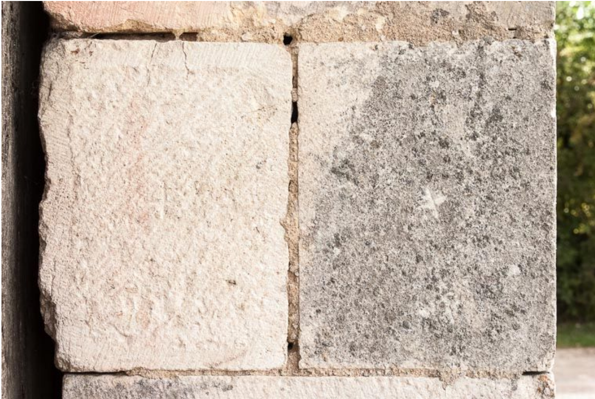
Marque de tâcheron sur la porte charretière à l'ouest de l'édifice.

21, Ladoix-Serrigny, 1 rue de la Chapelle