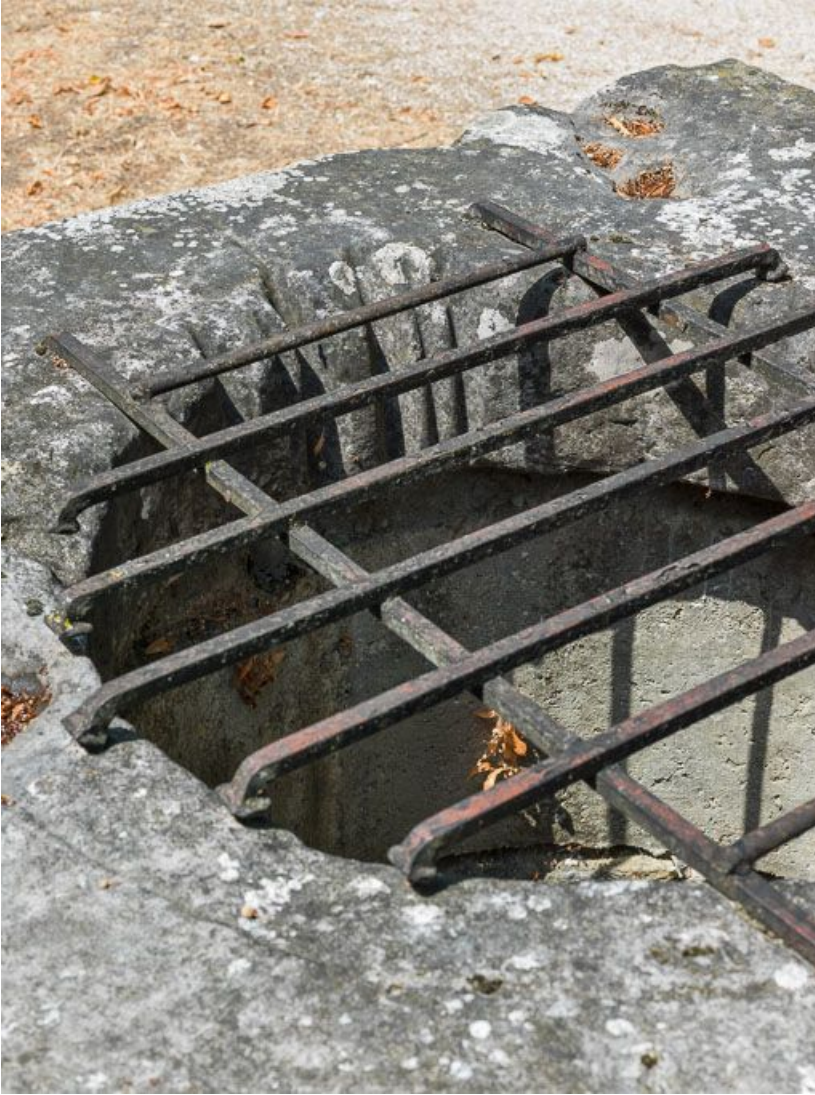
Puits : grille et traces d'usure de cordes.

21, Ladoix-Serrigny, 1 rue de la Chapelle