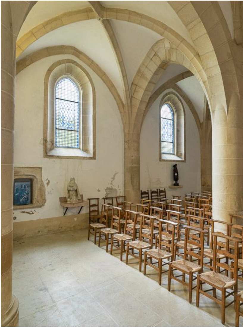
Vue de la nef depuis le chœur, en direction du sud-ouest.

21, Ladoix-Serrigny, 1 rue de la Chapelle