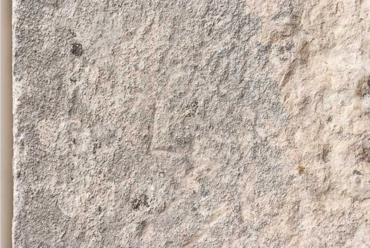
Marque de tâcheron sur la porte charretière à l'ouest de l'édifice.

21, Ladoix-Serrigny, 1 rue de la Chapelle