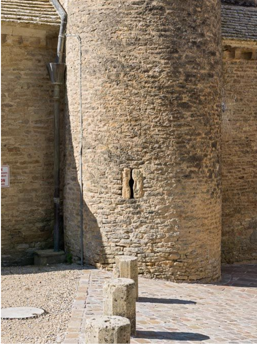
Tourelle d'escalier : détail du jour en archère.

21, Pernand-Vergelesses rue Jacques-Copeau