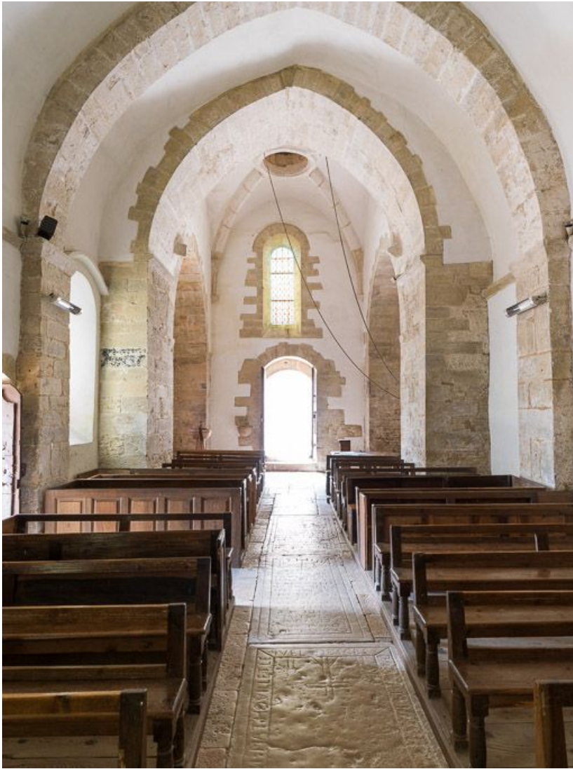
Vue des premières travées de la nef.

21, Pernand-Vergelesses rue Jacques-Copeau