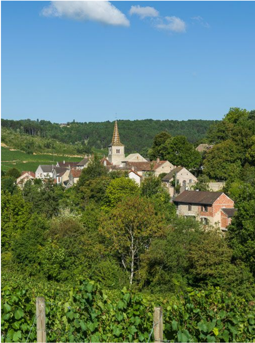
Vue générale de l'église et du village.

21, Pernand-Vergelesses rue Jacques-Copeau