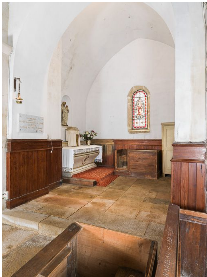
Chapelle sud-ouest de trois quarts.

21, Pernand-Vergelesses rue Jacques-Copeau