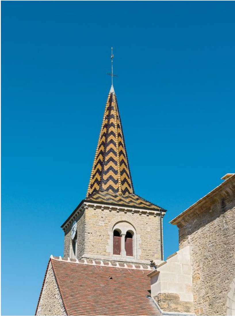
flèche du clocher.

21, Pernand-Vergelesses rue Jacques-Copeau