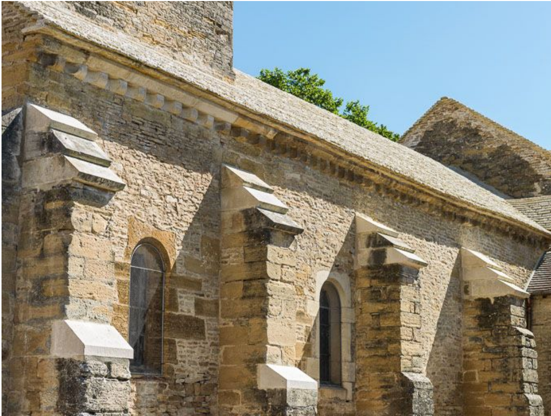
Élévation sud-ouest, détail des contreforts et de la corniche.

21, Pernand-Vergelesses rue Jacques-Copeau