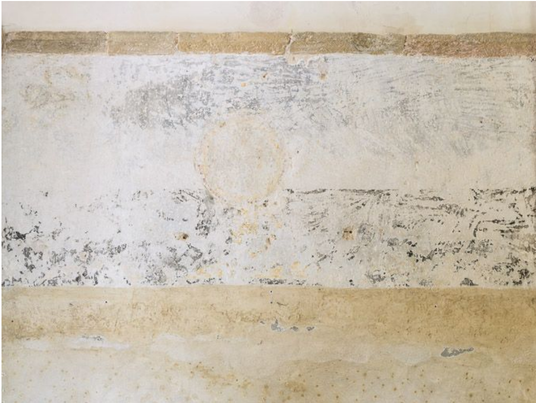
Traces de peintures murales dans la nef.

21, Pernand-Vergelesses rue Jacques-Copeau