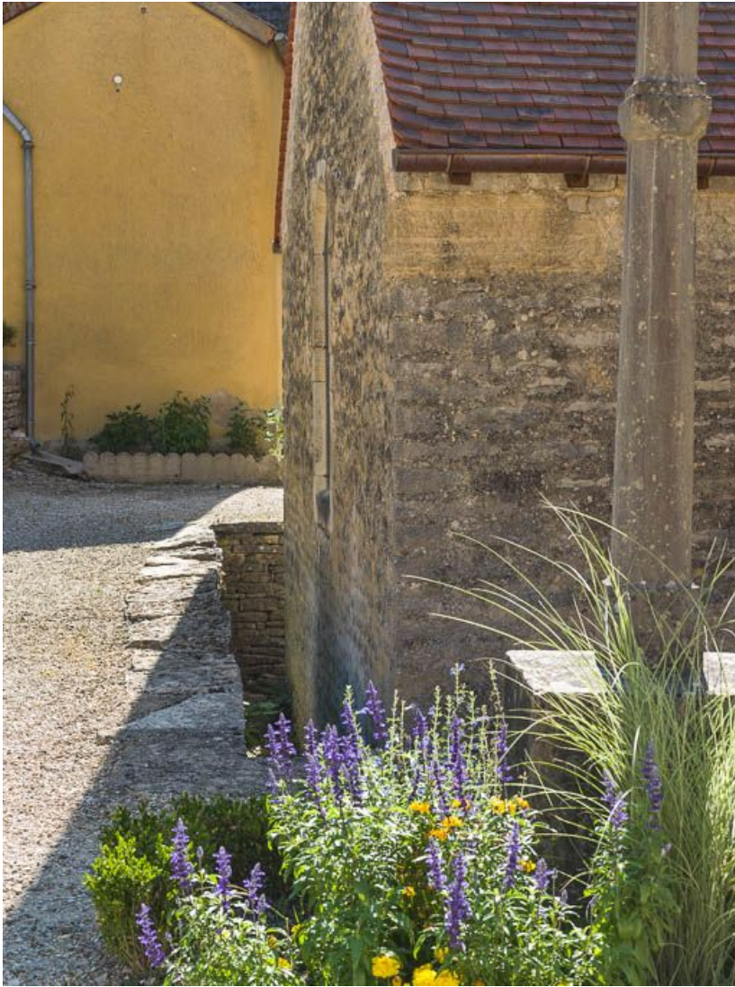
Fossé d'assainissement de la chapelle nord-est.

21, Pernand-Vergelesses rue Jacques-Copeau