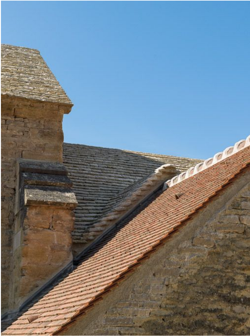
Détail des toitures du chœur, de la chapelle nord-est et de la nef.

21, Pernand-Vergelesses rue Jacques-Copeau