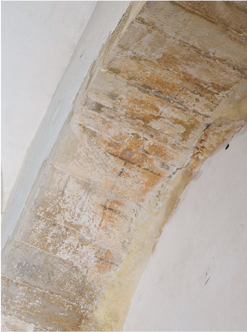
Détail des traces de peintures murales dessinant un faux appareillage, au niveau de la 1ère travée. 21, Pernand-Vergelesses rue Jacques-Copeau