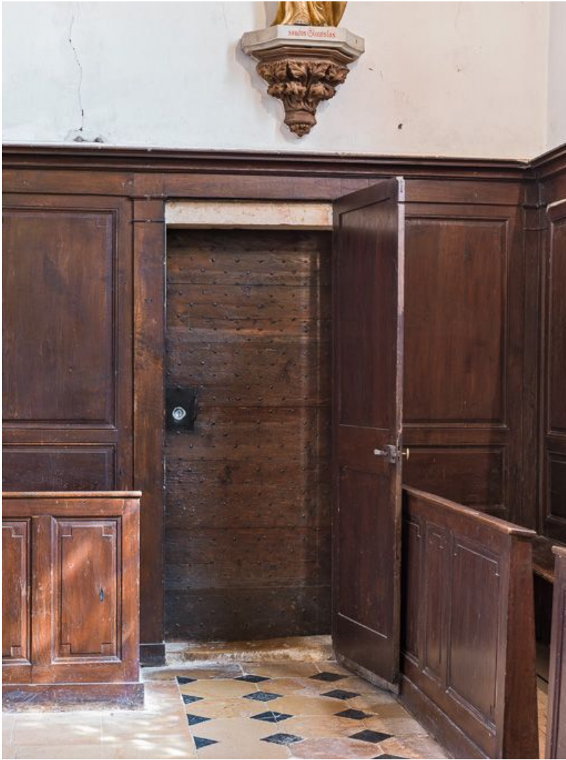
Porte de la sacristie.

21, Pernand-Vergelesses rue Jacques-Copeau