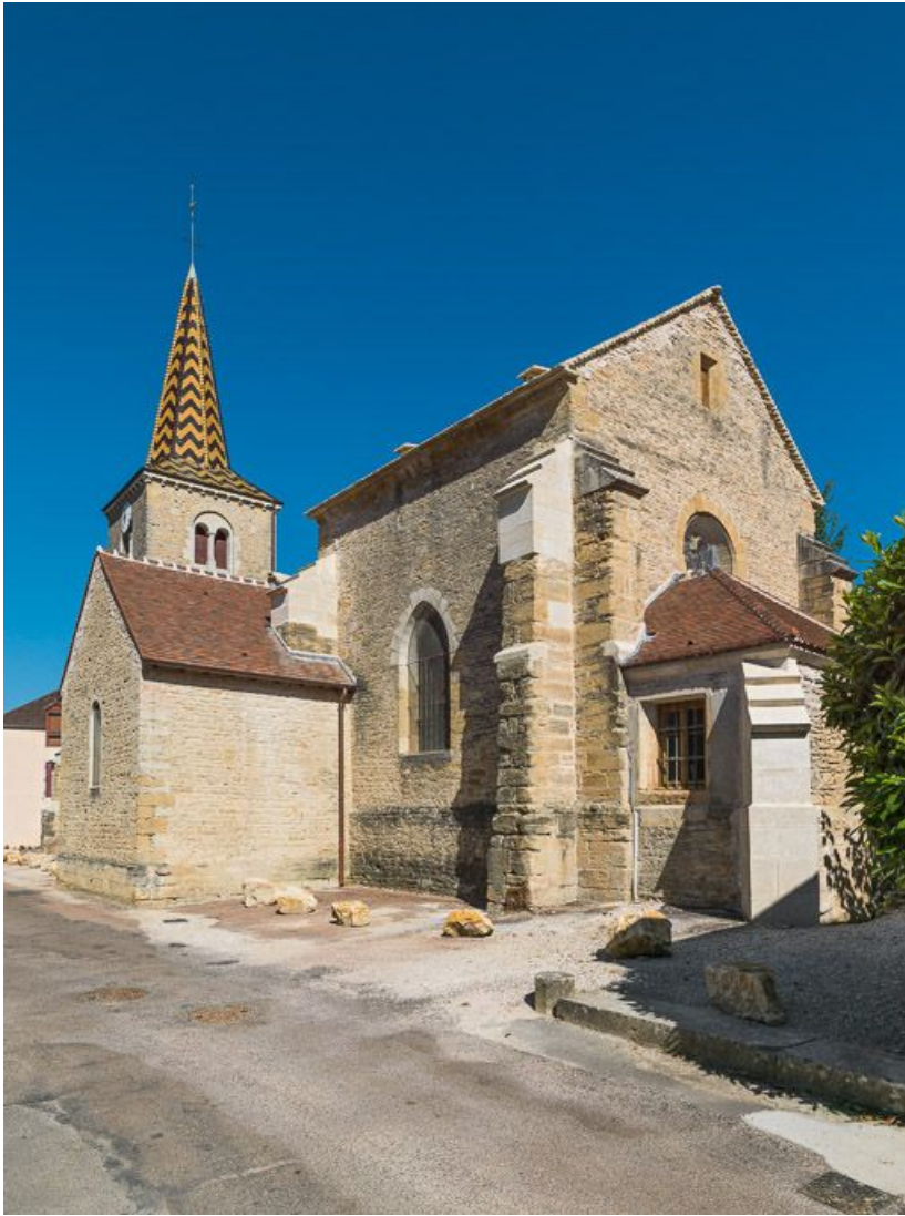
Elévation de trois quarts, côté chevet.

21, Pernand-Vergelesses rue Jacques-Copeau