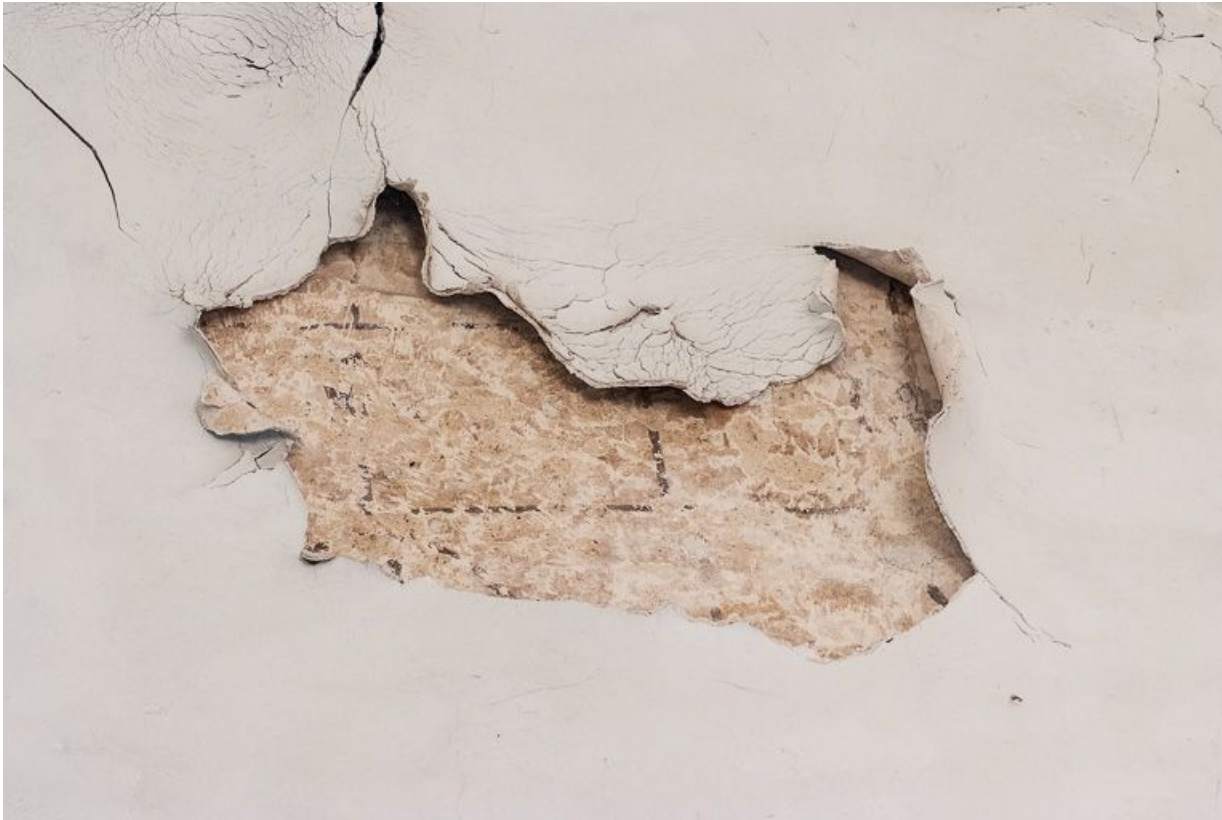
Détail de l'enduit du chœur.

21, Pernand-Vergelesses rue Jacques-Copeau