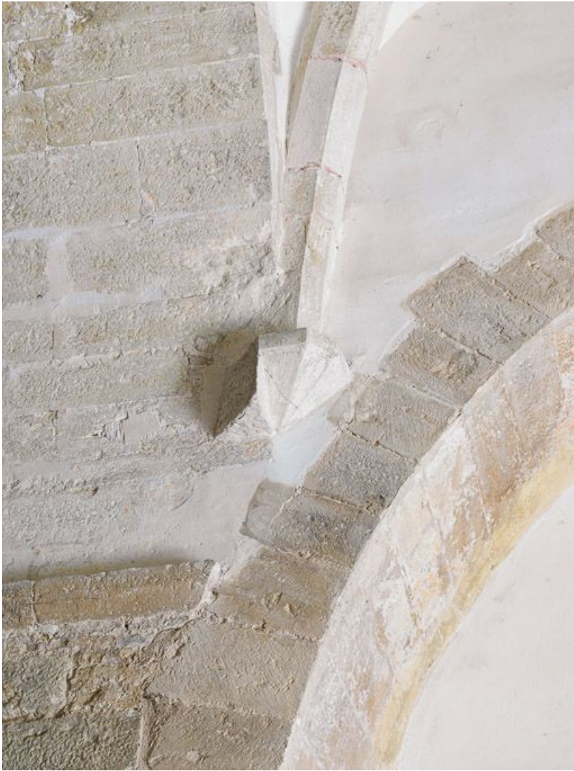
Culot de la voûte de la travée sous clocher. 21, Pernand-Vergelesses rue Jacques-Copeau