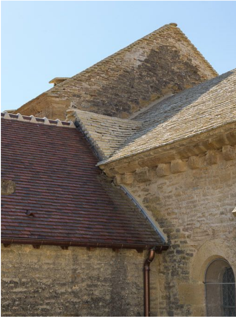
Détail des toitures du chœur, de la chapelle nord-est et de la nef.

21, Pernand-Vergelesses rue Jacques-Copeau