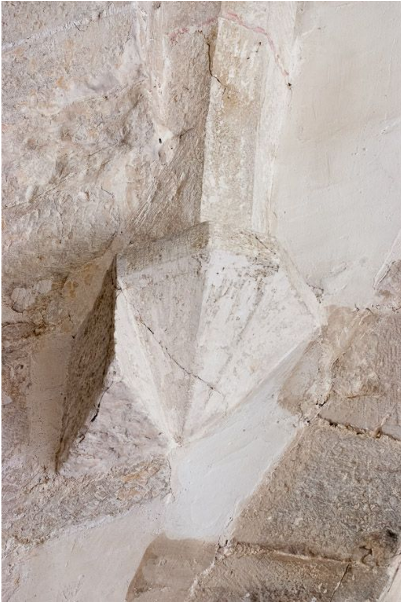
Détail d'un culot de la voûte de la travée sous clocher.

21, Pernand-Vergelesses rue Jacques-Copeau