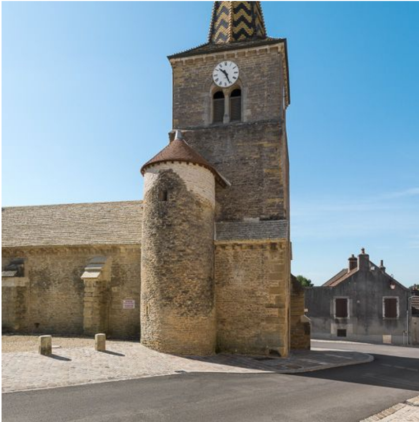
Tourelle d'escalier et clocher.

21, Pernand-Vergelesses rue Jacques-Copeau