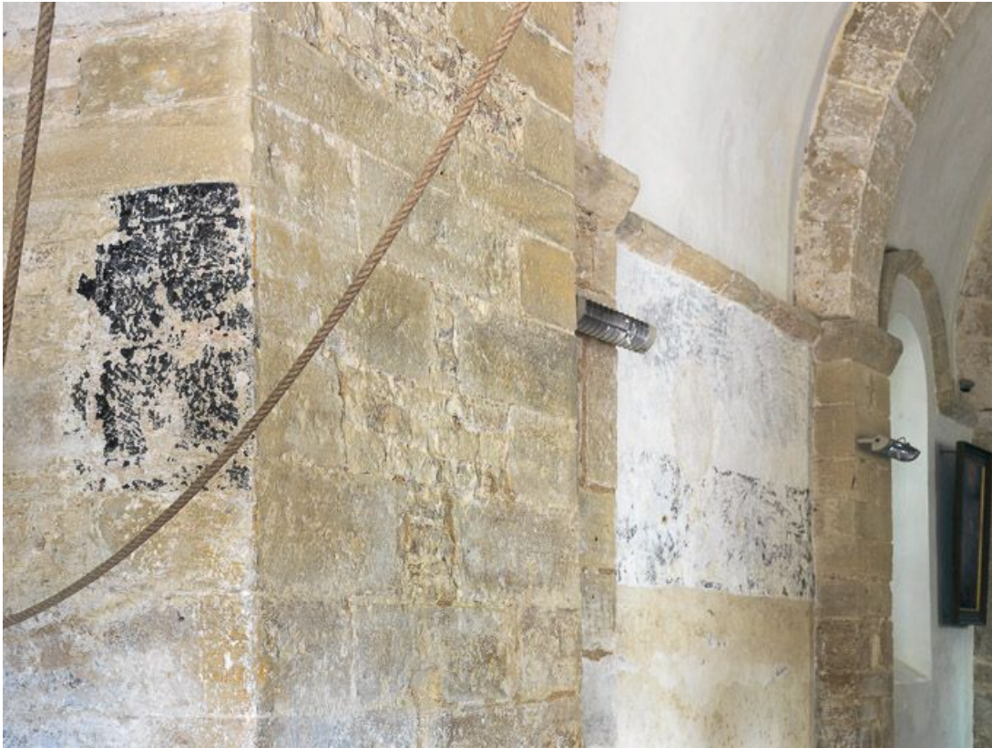
Détail des traces de litre funéraire dans la nef.

21, Pernand-Vergelesses rue Jacques-Copeau