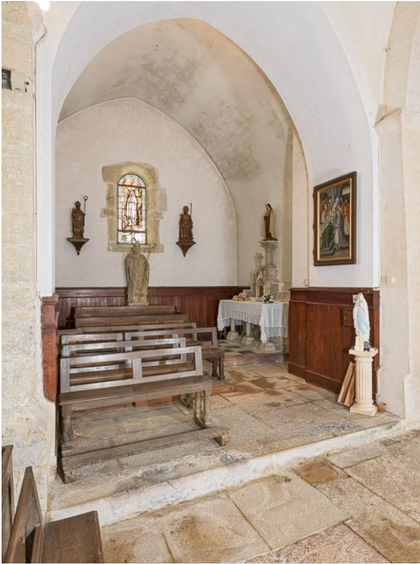
Chapelle nord-est de trois quarts.

21, Pernand-Vergelesses rue Jacques-Copeau