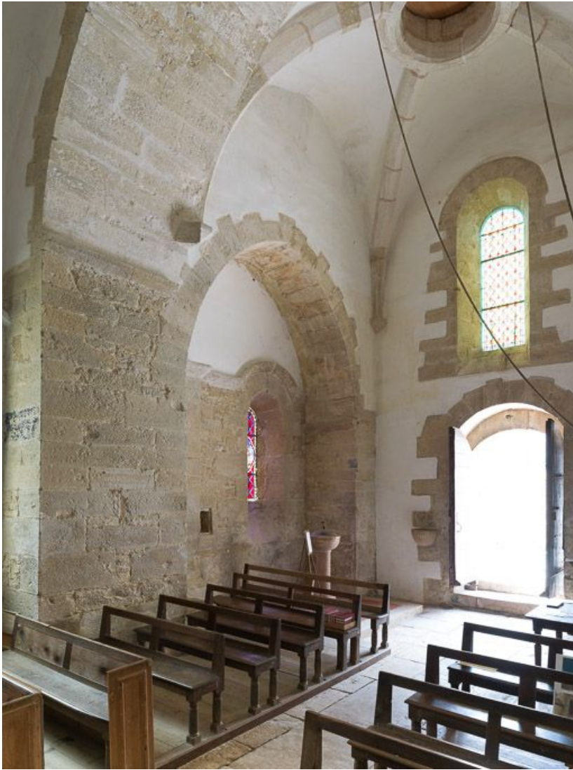
La travée sous clocher : vue de trois quarts. 21, Pernand-Vergelesses rue Jacques-Copeau