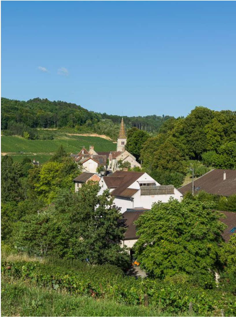
Vue générale de l'église et du village de Pernand-Vergelesses.

21, Pernand-Vergelesses rue Jacques-Copeau