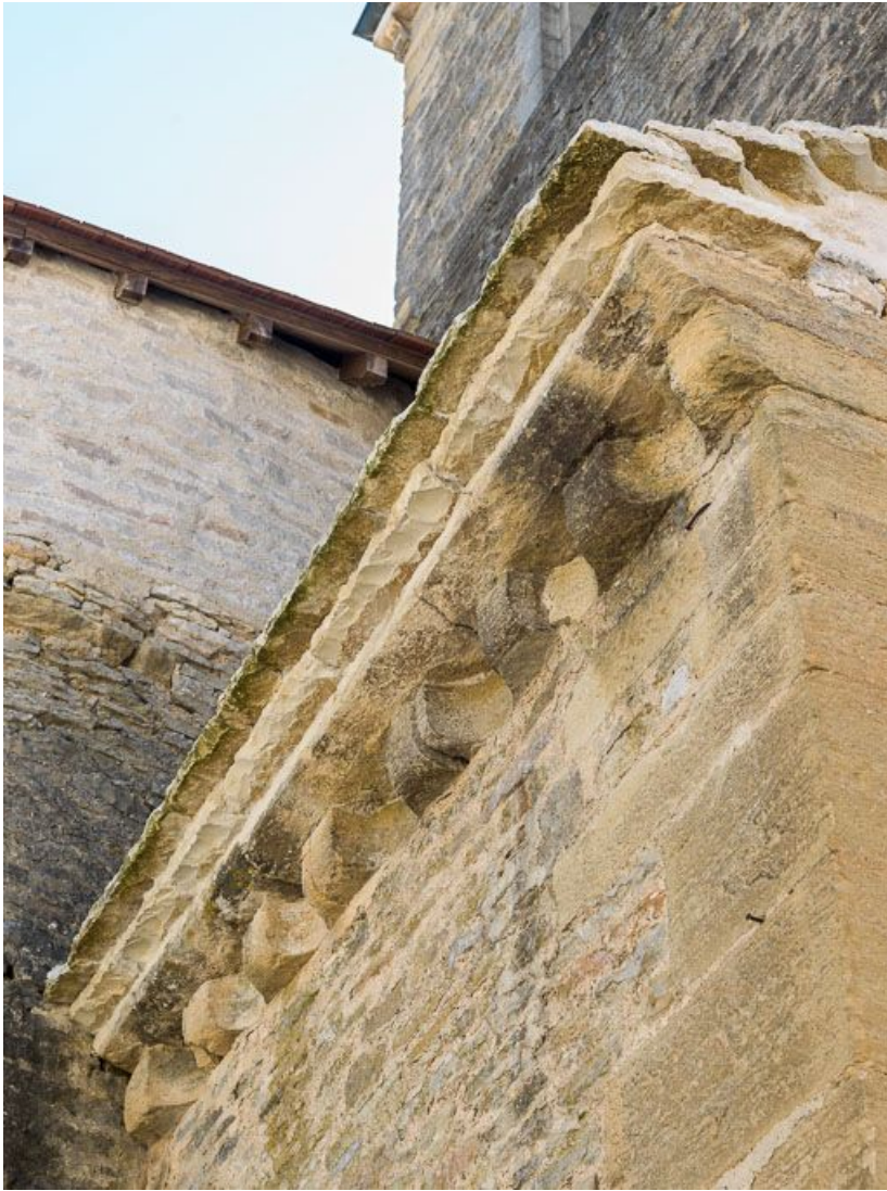
Élévation nord-est, détail des corniches. 21, Pernand-Vergelesses rue Jacques-Copeau