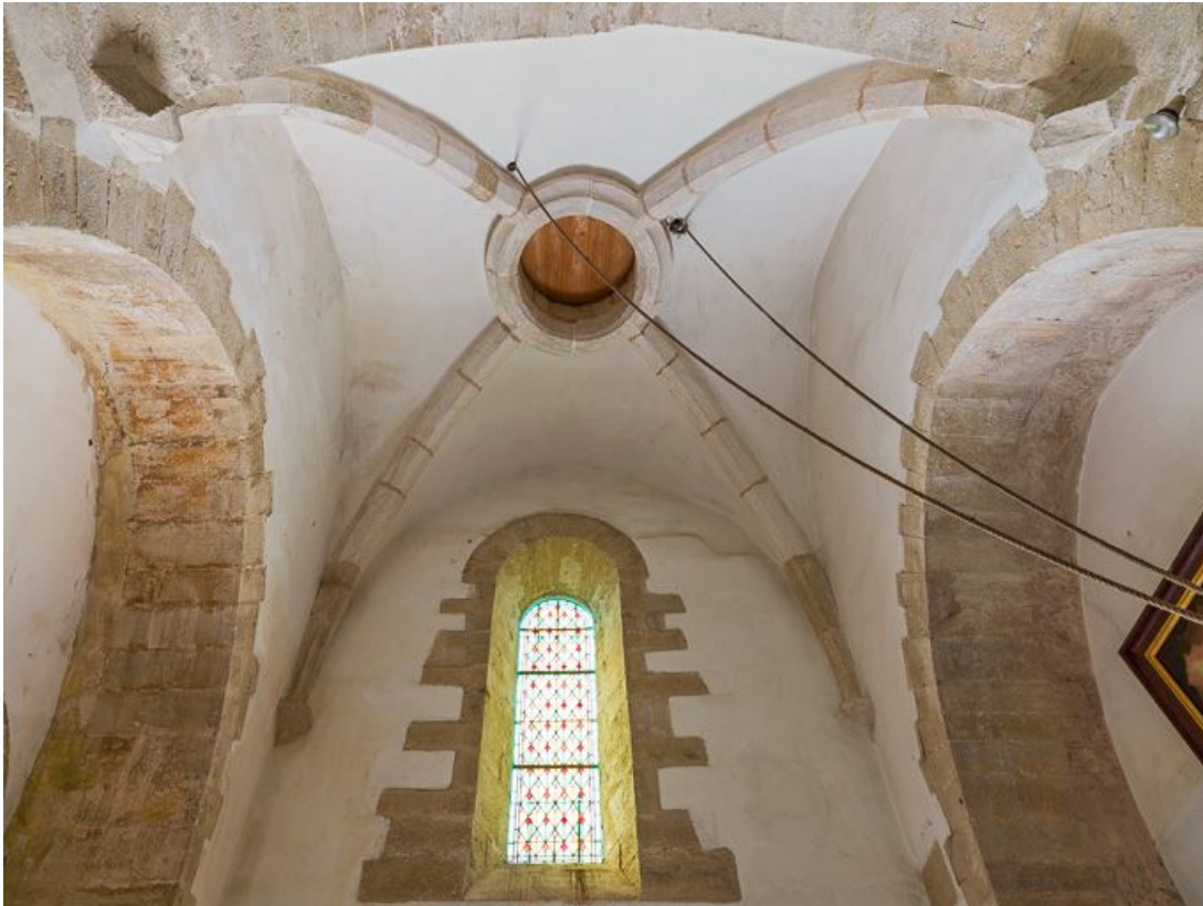
Voûte de la travée sous clocher.

21, Pernand-Vergelesses rue Jacques-Copeau