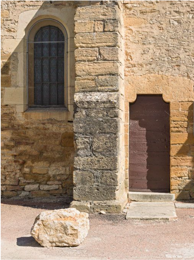
Élévation sud-ouest, détail de la porte latérale.

21, Pernand-Vergelesses rue Jacques-Copeau