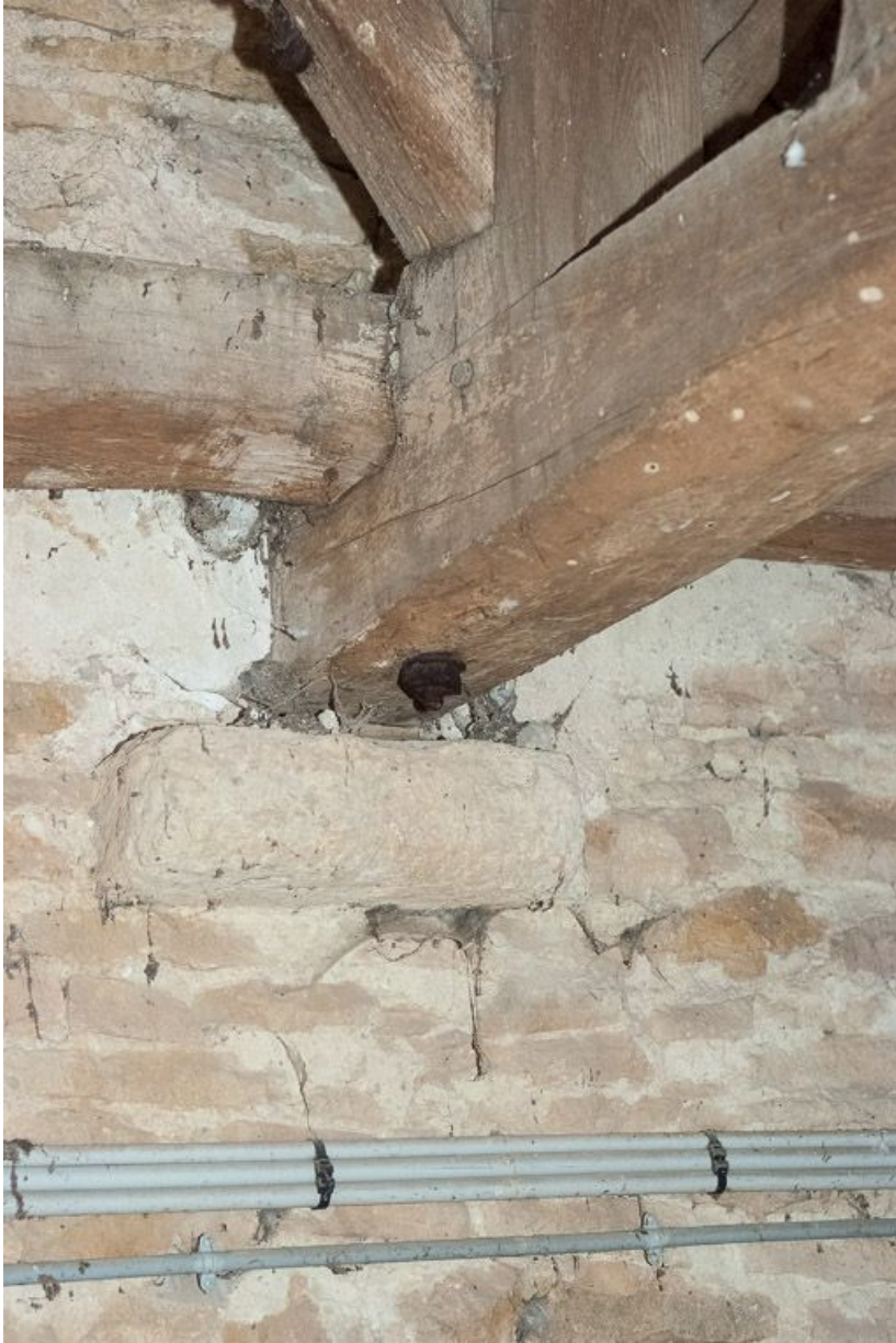
Détail d'un support en pierre du beffroi.

21, Pernand-Vergelesses rue Jacques-Copeau