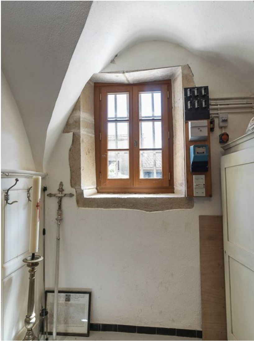
Fenêtre de la sacristie.

21, Pernand-Vergelesses rue Jacques-Copeau