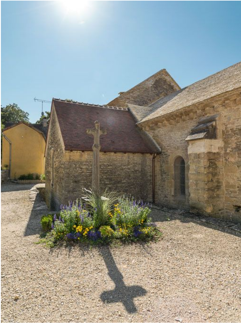
Croix monumentale et chapelle nord-est. 21, Pernand-Vergelesses rue Jacques-Copeau