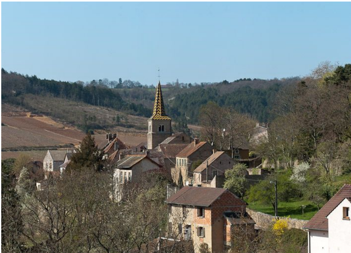
Vue générale de l'église et du village de Pernand-Vergelesses.

21, Pernand-Vergelesses rue Jacques-Copeau