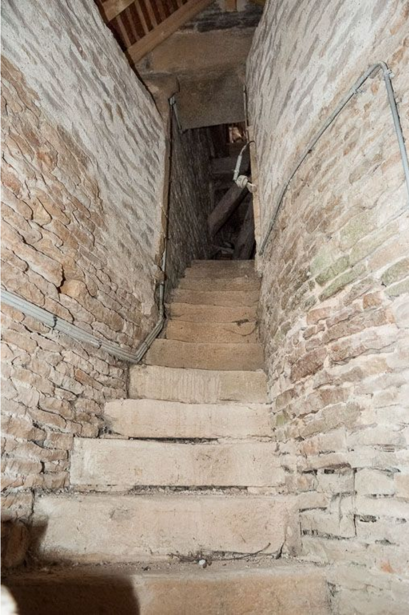
Volée droite menant au clocher.

21, Pernand-Vergelesses rue Jacques-Copeau