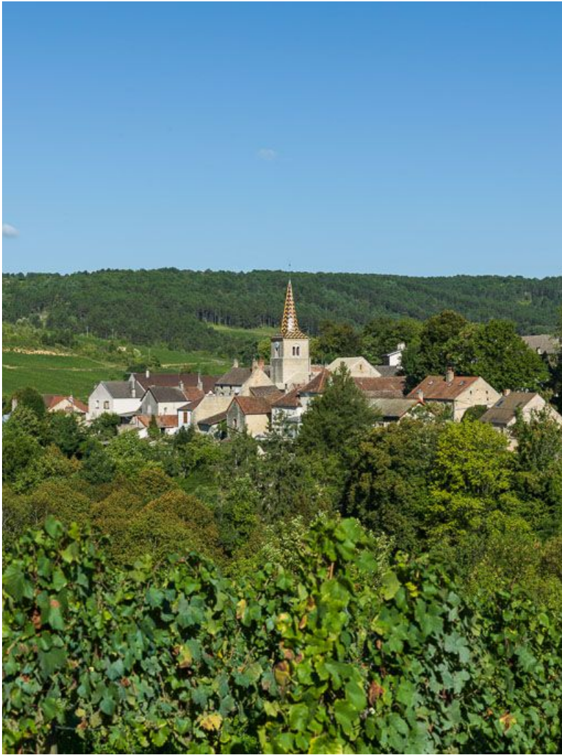
Vue générale de l'église et du village.

21, Pernand-Vergelesses rue Jacques-Copeau