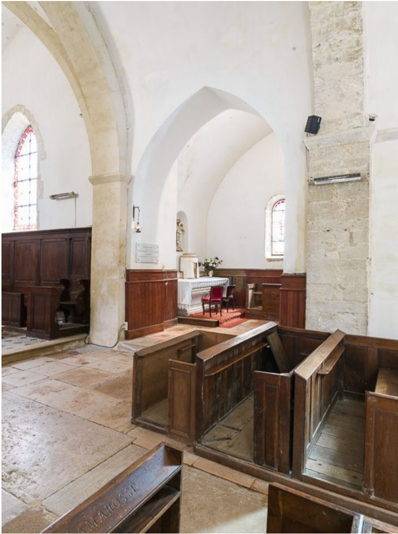
Choeur et chapelle sud-ouest de trois quarts.

21, Pernand-Vergelesses rue Jacques-Copeau