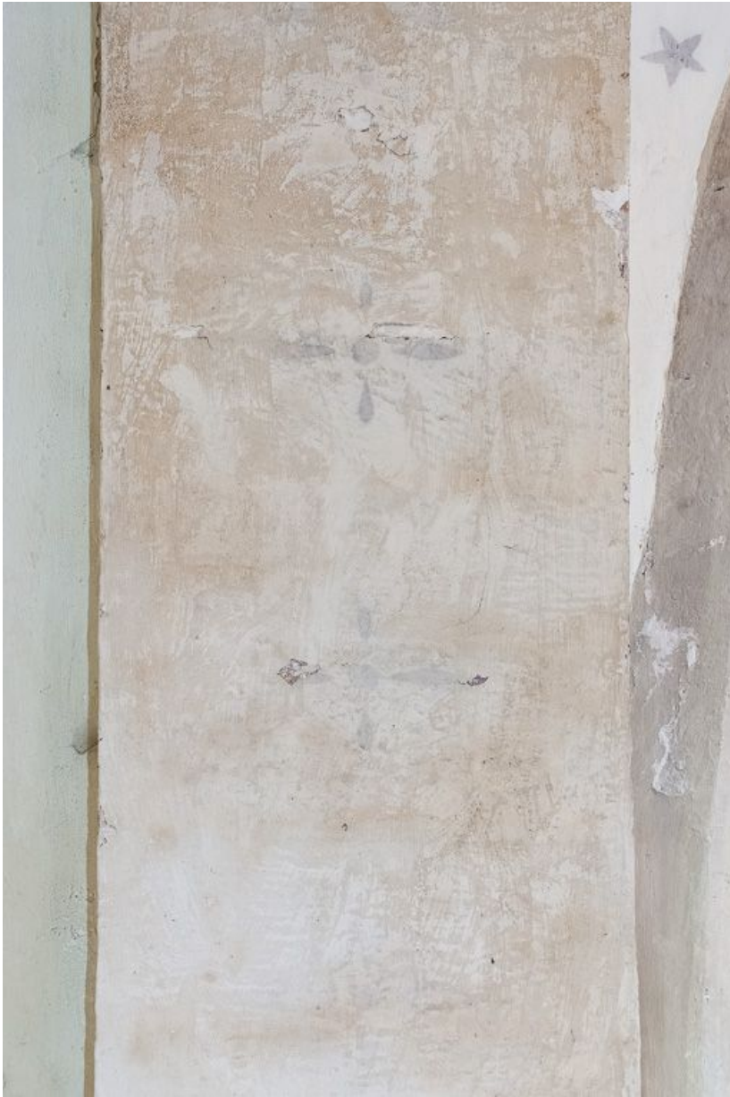
Détail des traces de peintures murales du chœur.

21, Pernand-Vergelesses rue Jacques-Copeau