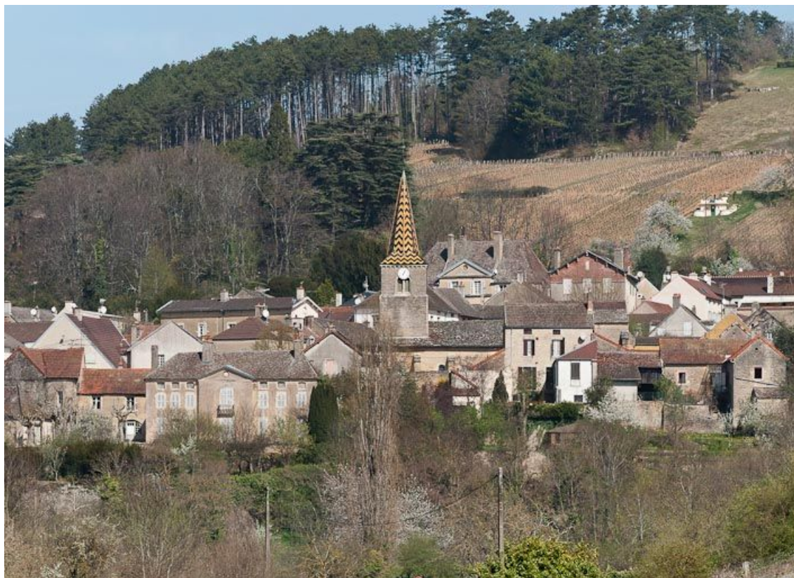
Vue générale de l'église et du village de Pernand-Vergelesses.

21, Pernand-Vergelesses rue Jacques-Copeau