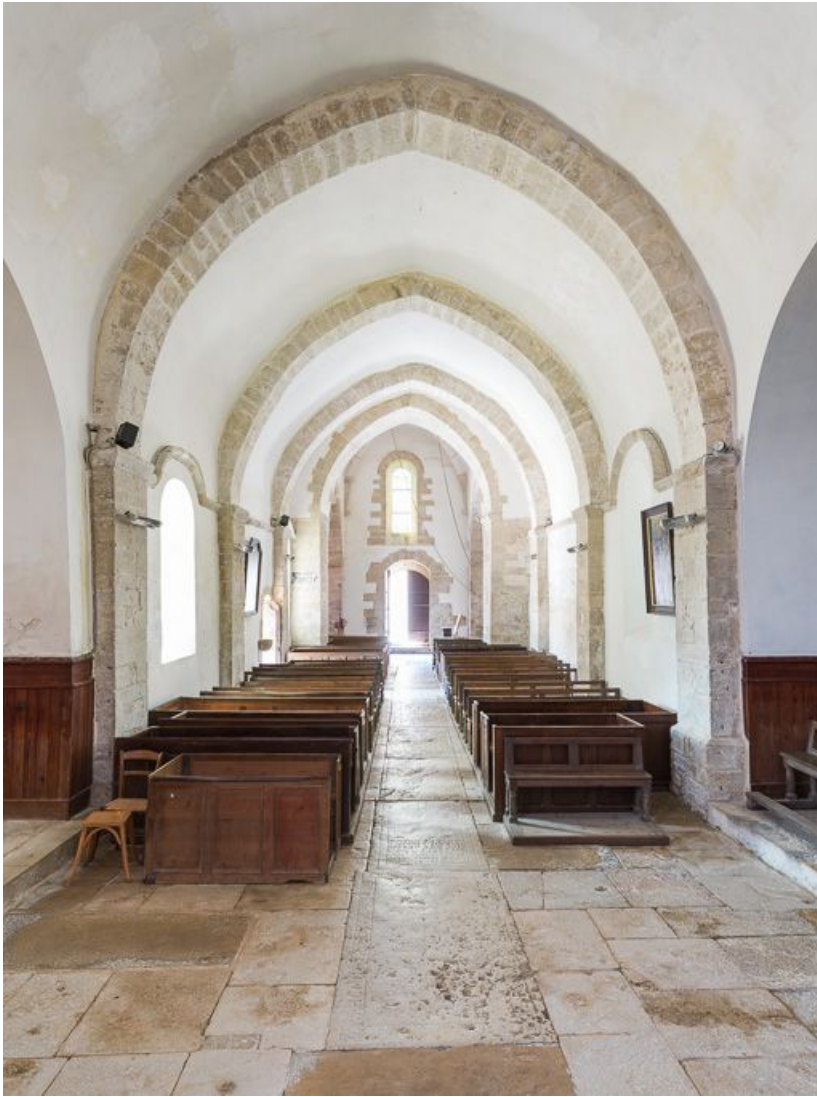
Vue d'ensemble depuis le chœur.

21, Pernand-Vergelesses rue Jacques-Copeau