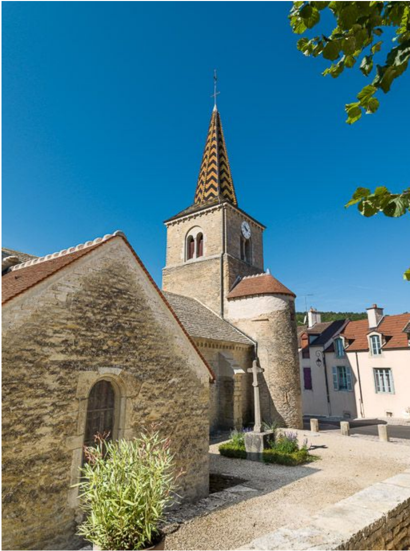
Chapelle nord-est, clocher et tourelle d'escalier.

21, Pernand-Vergelesses rue Jacques-Copeau