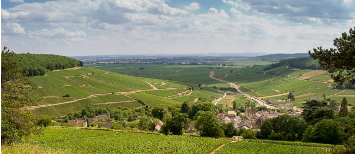
Vue générale de l'église et du village, depuis l'oratoire de Notre-Dame de Bonne Espérance.

21, Pernand-Vergelesses rue Jacques-Copeau