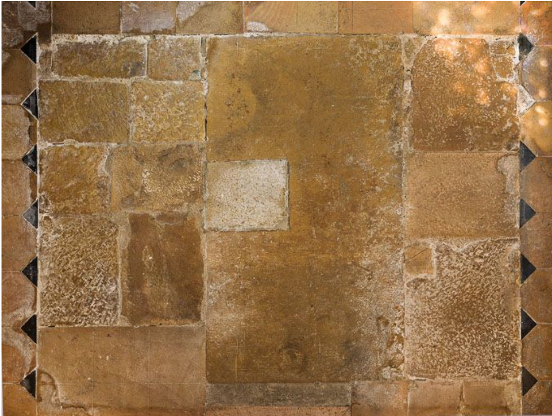
Dallage du chœur : détail.

21, Pernand-Vergelesses rue Jacques-Copeau