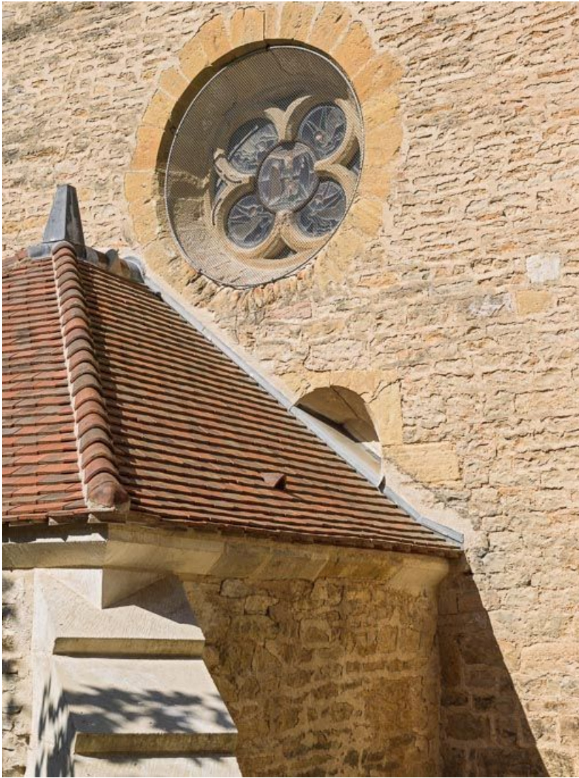
Détail de l'oculus et de la baie murée du chœur.

21, Pernand-Vergelesses rue Jacques-Copeau