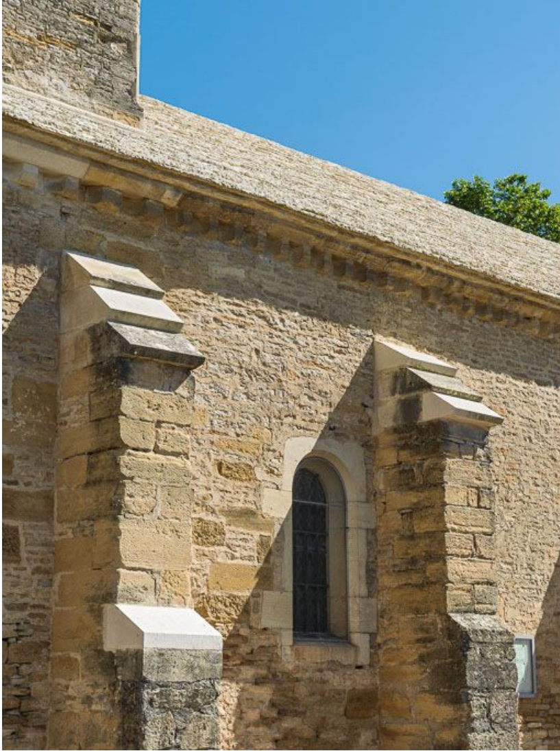
Élévation sud-ouest, détail de la travée.

21, Pernand-Vergelesses rue Jacques-Copeau