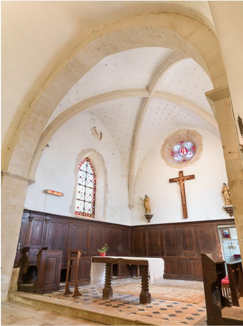
Vue du chœur.

21, Pernand-Vergelesses rue Jacques-Copeau