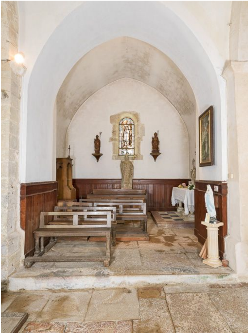
Vue rapprochée de la chapelle nord-est. 21, Pernand-Vergelesses rue Jacques-Copeau