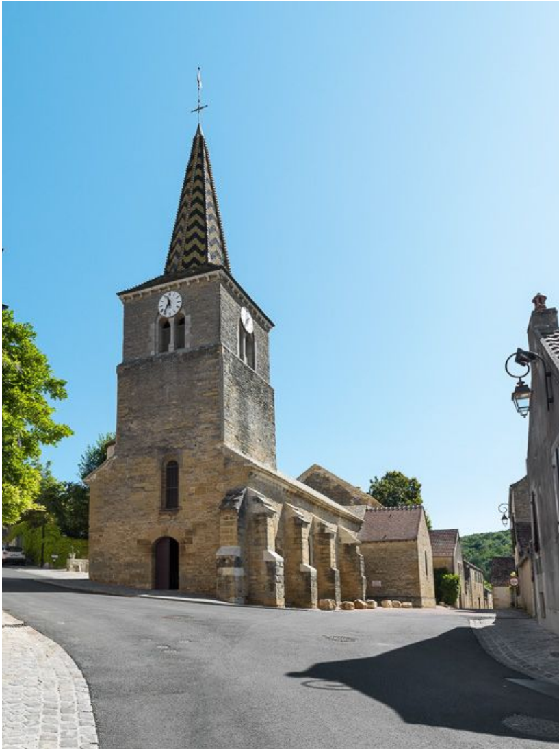
Vue d'ensemble, façade et élévation sud-ouest.

21, Pernand-Vergelesses rue Jacques-Copeau