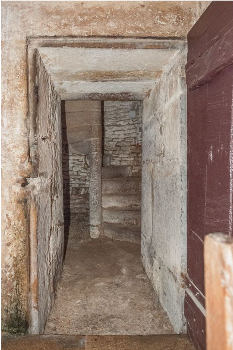
Départ d'escalier de la tourelle du clocher.

21, Pernand-Vergelesses rue Jacques-Copeau