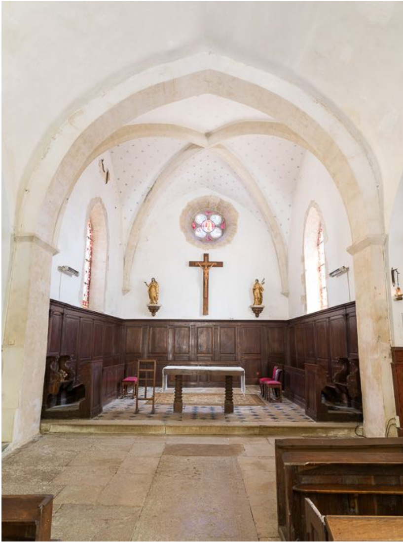
Vue d'ensemble du chœur.

21, Pernand-Vergelesses rue Jacques-Copeau