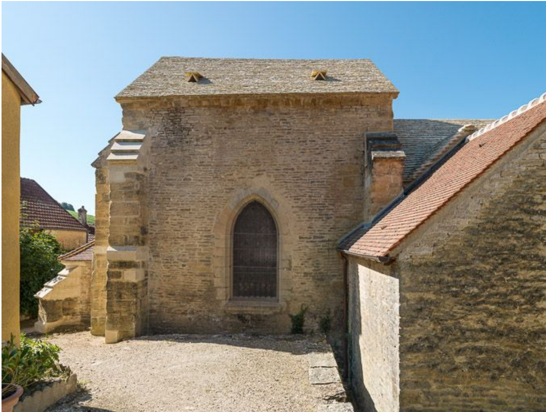
Elévation nord-est du chœur.

21, Pernand-Vergelesses rue Jacques-Copeau