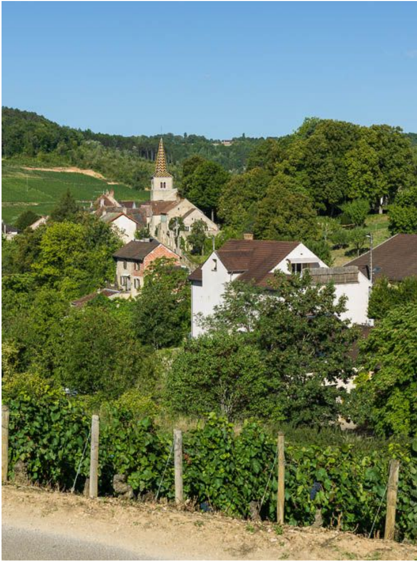
Vue générale de l'église et du village.

21, Pernand-Vergelesses rue Jacques-Copeau