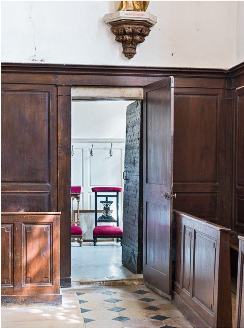
Porte d'entrée de la sacristie.

21, Pernand-Vergelesses rue Jacques-Copeau