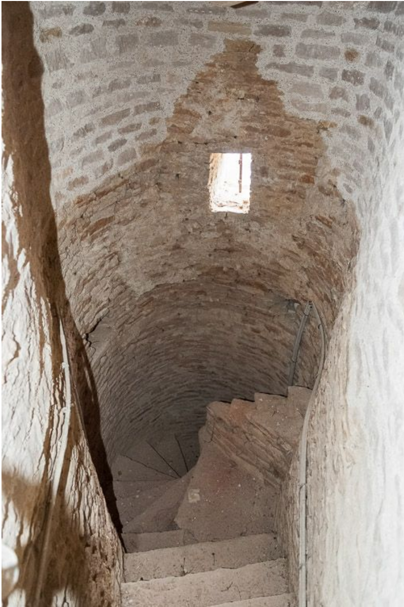
Partie supérieure de la tourelle d'escalier. 21, Pernand-Vergelesses rue Jacques-Copeau