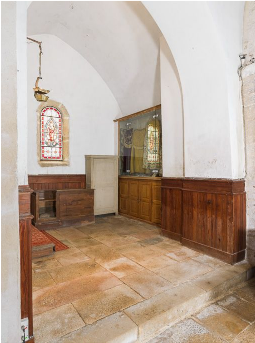
Chapelle sud-ouest de trois quarts.

21, Pernand-Vergelesses rue Jacques-Copeau