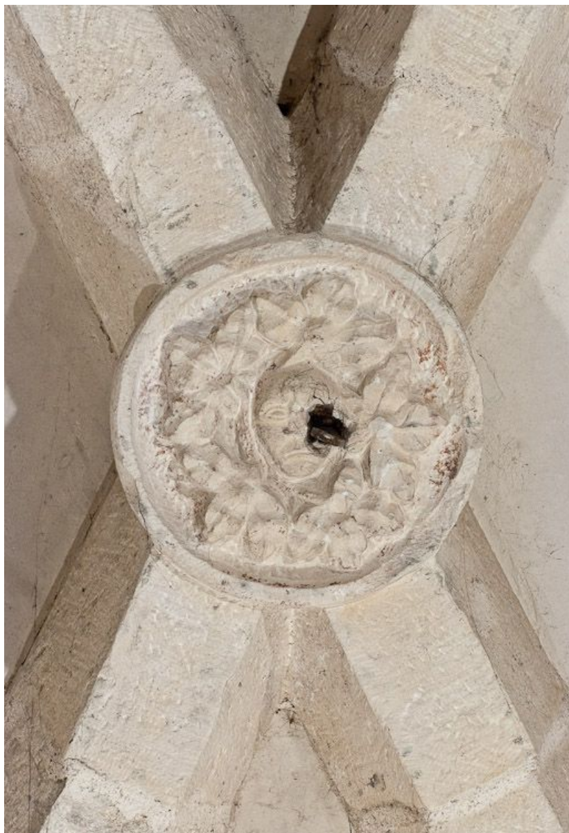
Clef de voûte de la troisième travée du bas-côté droit.