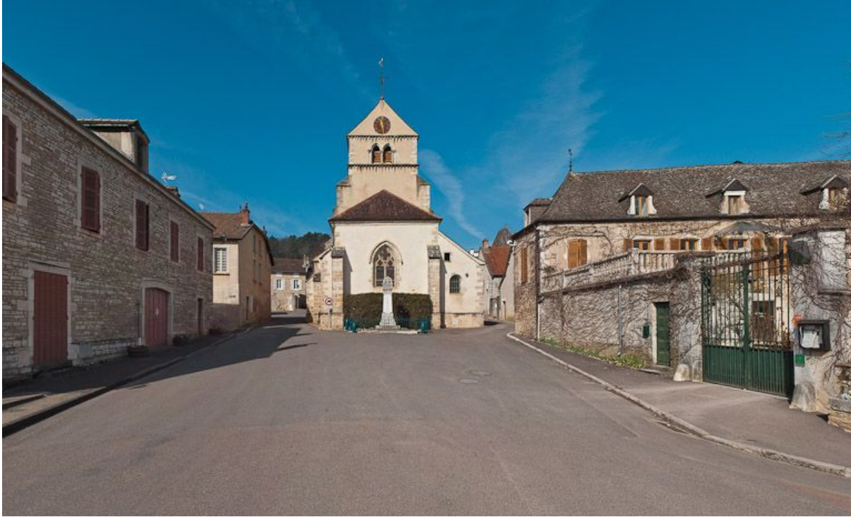
Portail : chapiteaux des colonnettes droites de l'ébrasement.