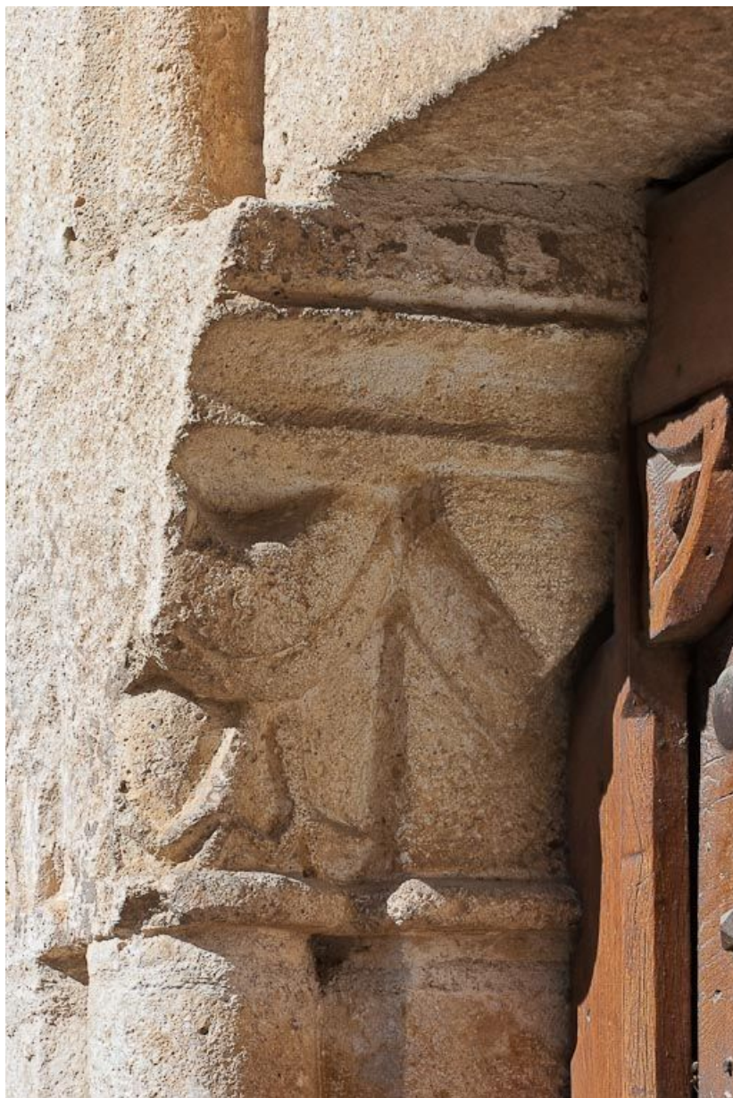
Porte latérale, détail des chapiteaux gauches.