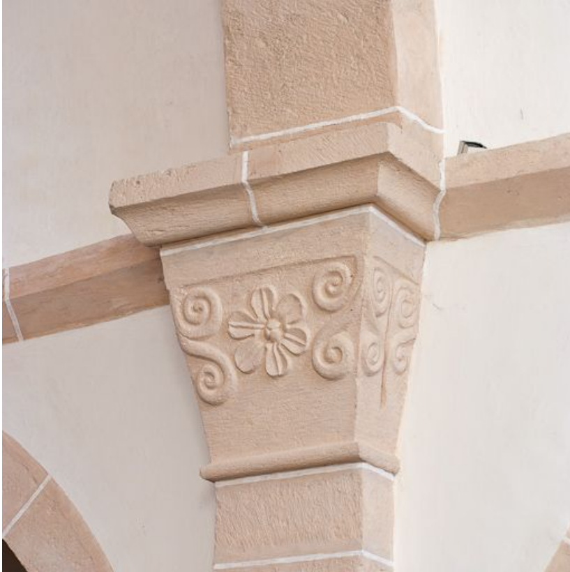
Chapiteau du grand pilastre droit de la nef.