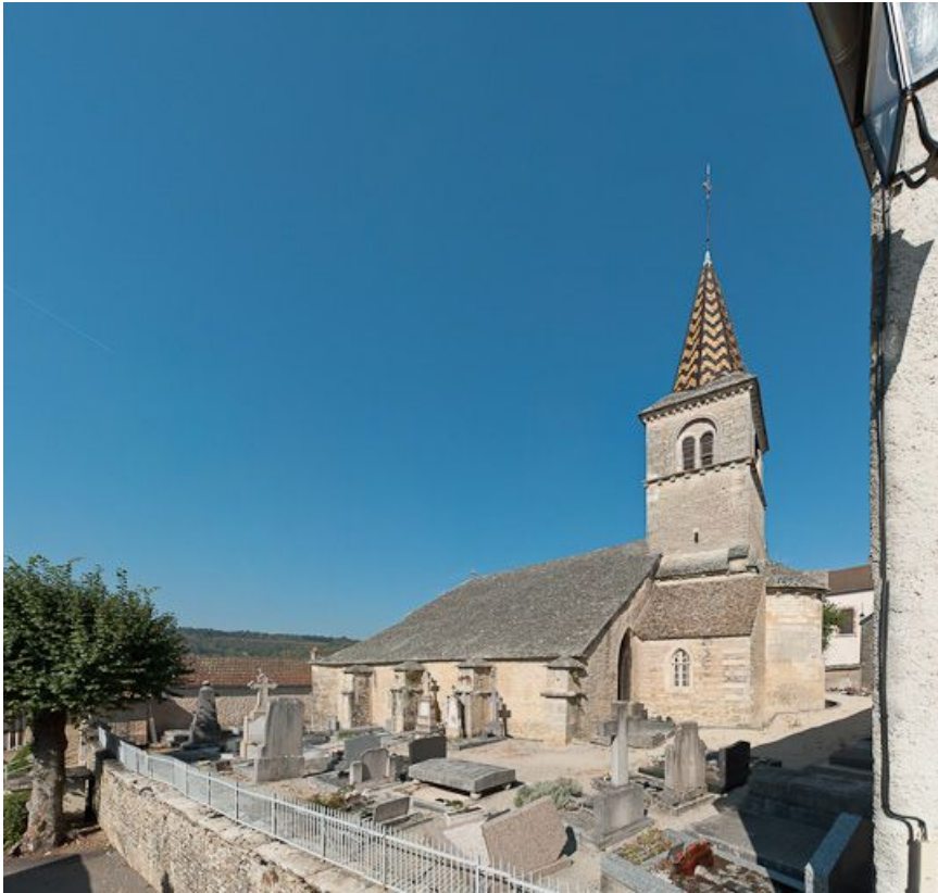
Elévations droite et postérieure.