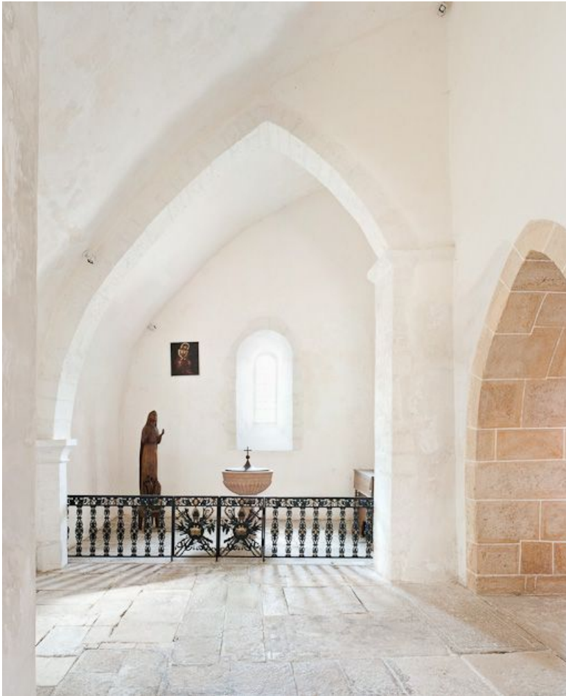
Chapelle des fonts baptismaux et sa clôture.