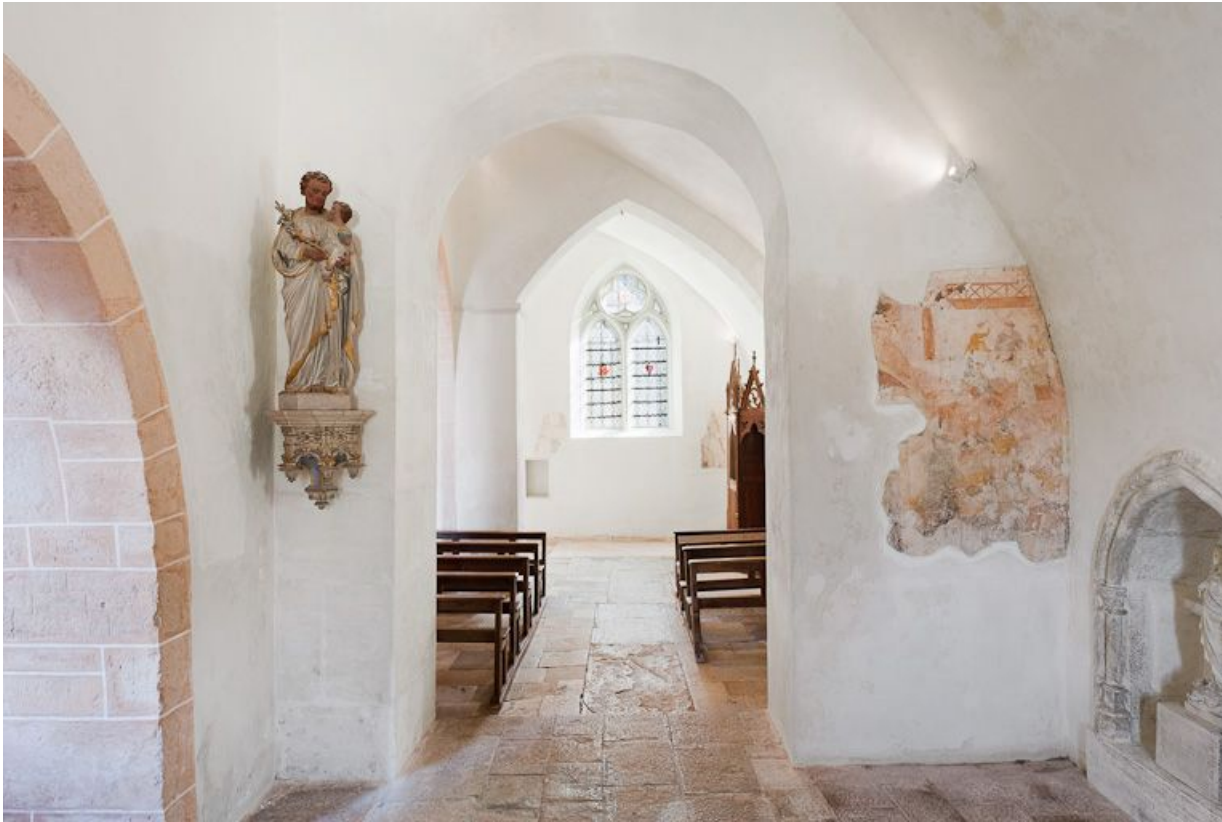
Bas-côté droit pris depuis la première travée.