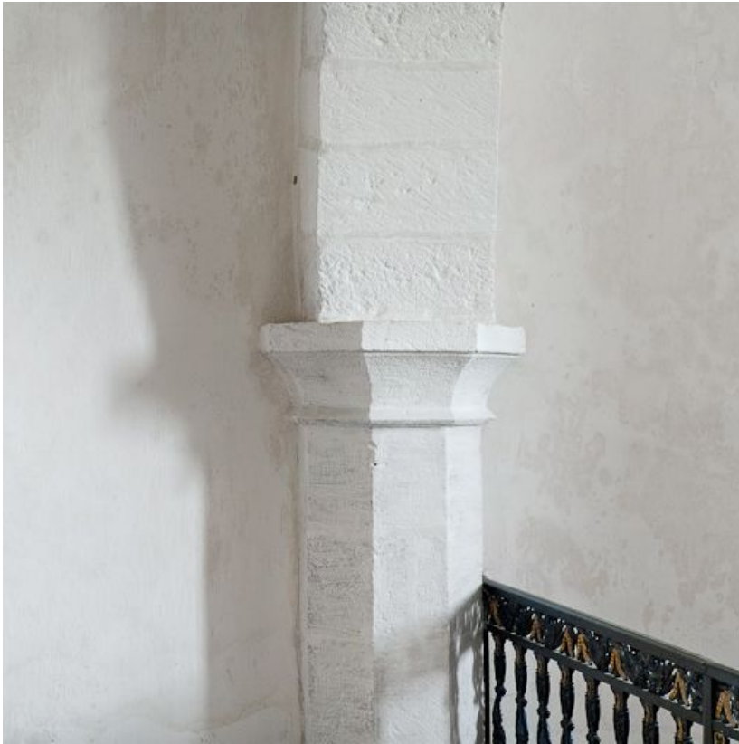
Chapelle des fonts baptismaux, détail du pilier droit.