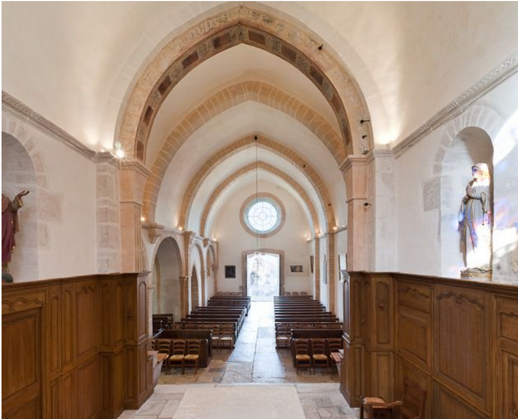
Nef prise du chœur.