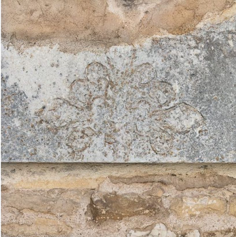
Linteau de la porte latérale gauche murée.