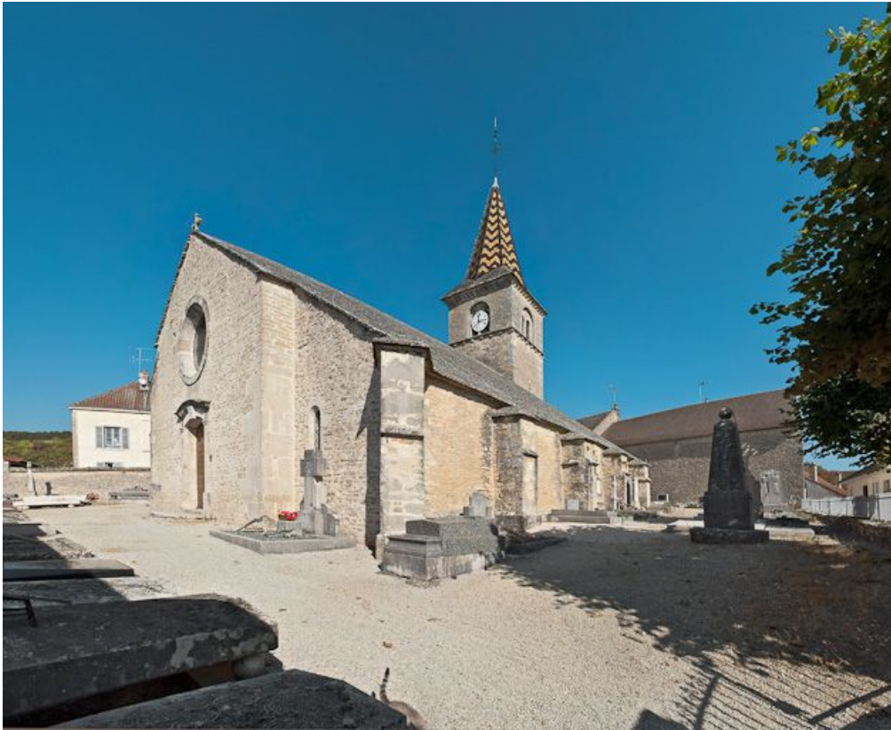
Façade et élévation droite.