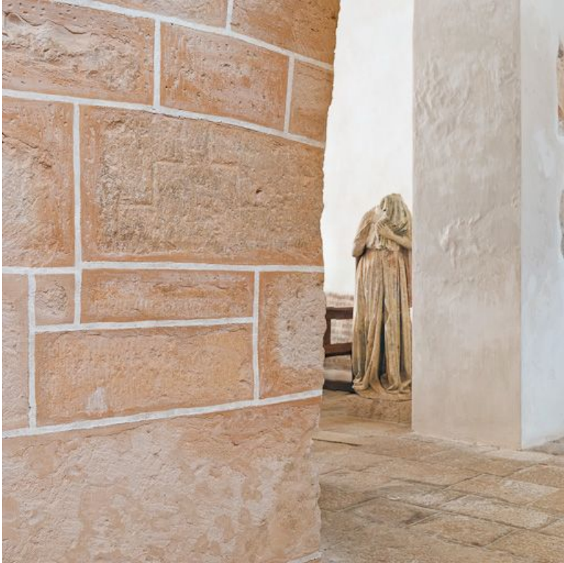
Détail de l'arcade entre les deuxièmes travées de la nef et du bas-côté droit. 21, Monthelie rue de l' Escalier

N° de l'illustration : 20112100387NUC2AQ