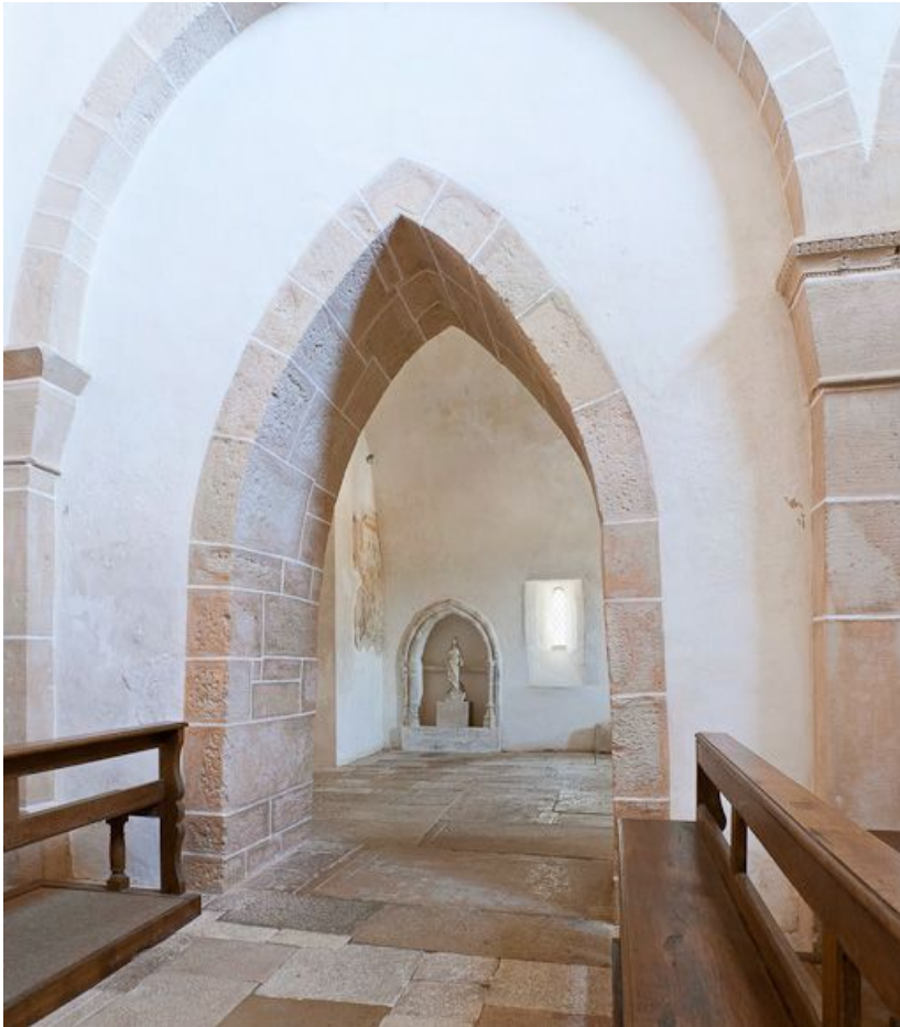
Nef et bas-côté droit, deuxième travée.