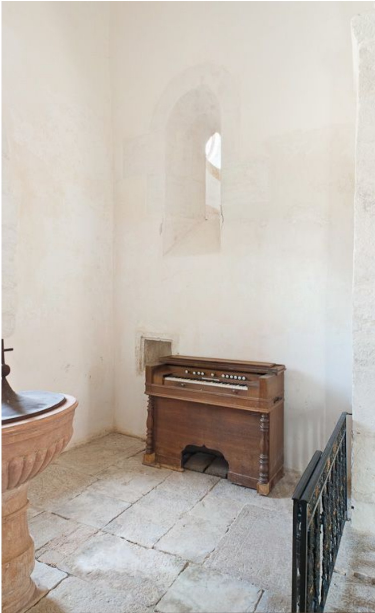
Chapelle des fonts baptismaux et harmonium.