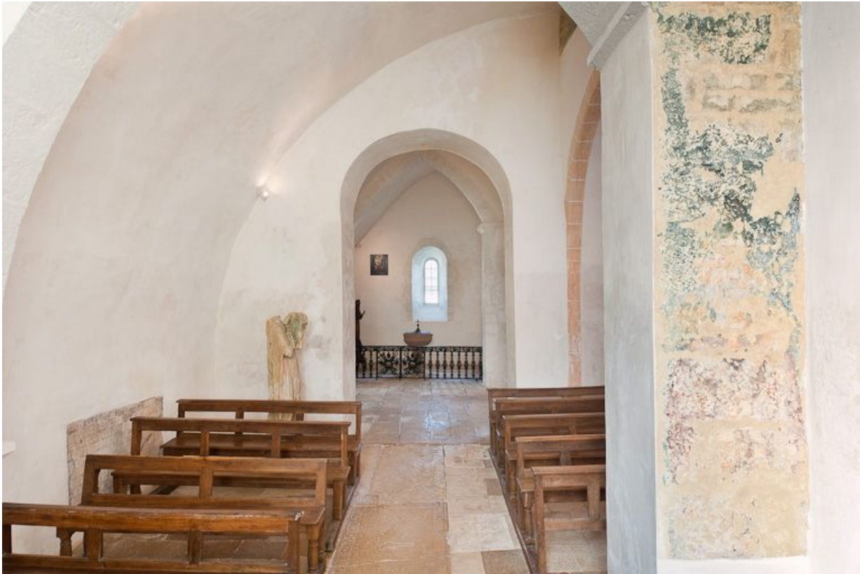
Bas-côté droit pris depuis la dernière travée.