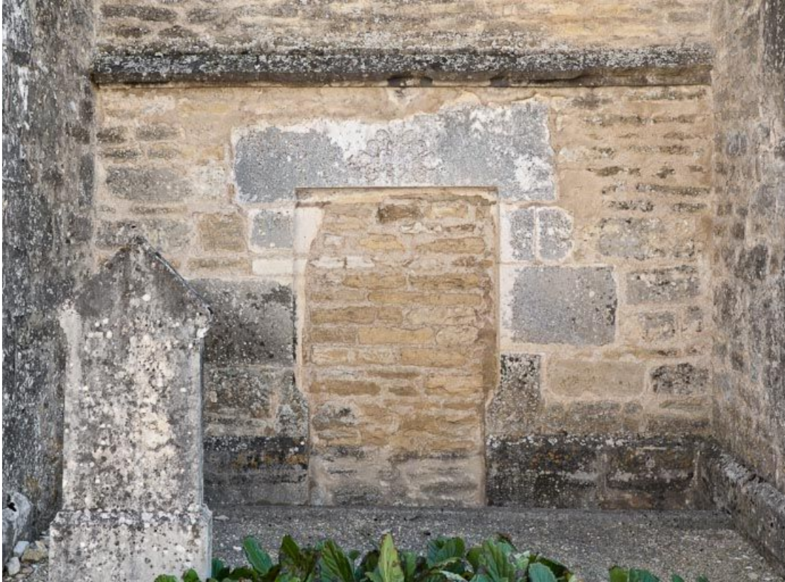
Porte latérale gauche murée.