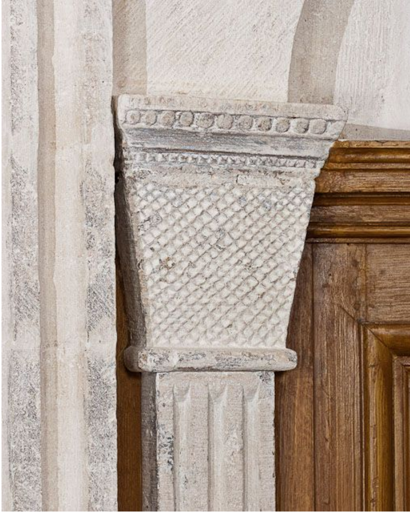
Premier chapiteau gauche de l'abside.