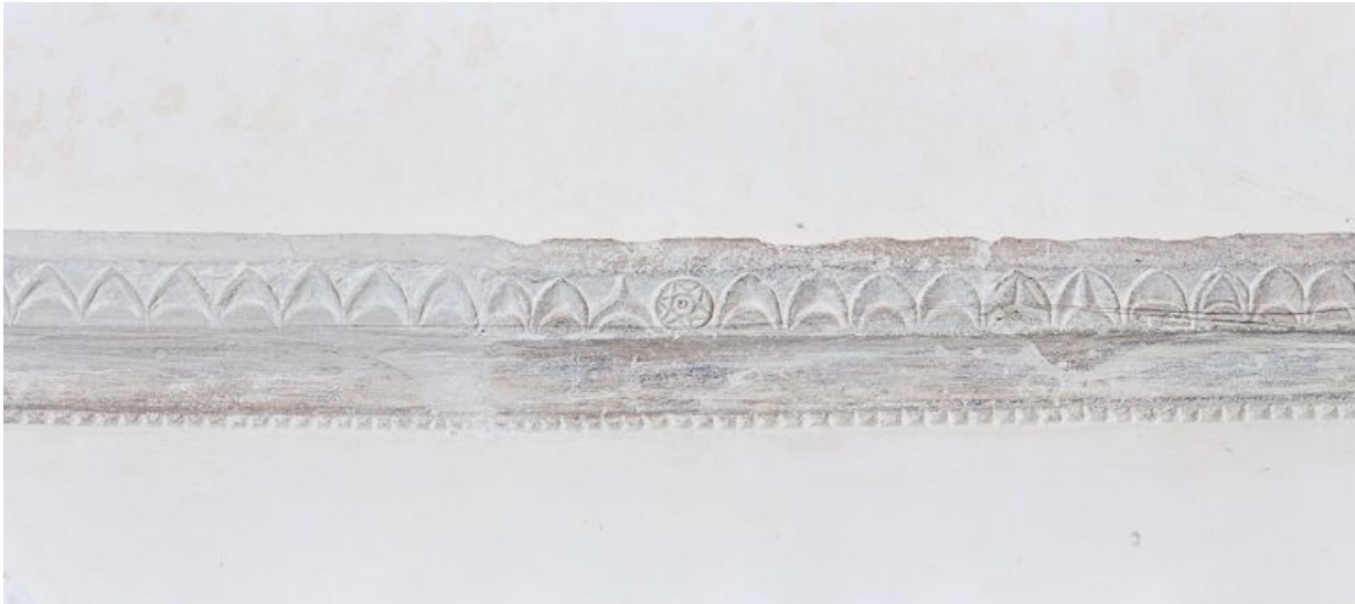
Détail corniche gauche de la travée du chœur.