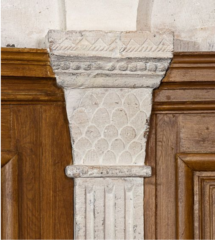
Deuxième chapiteau gauche de l'abside.