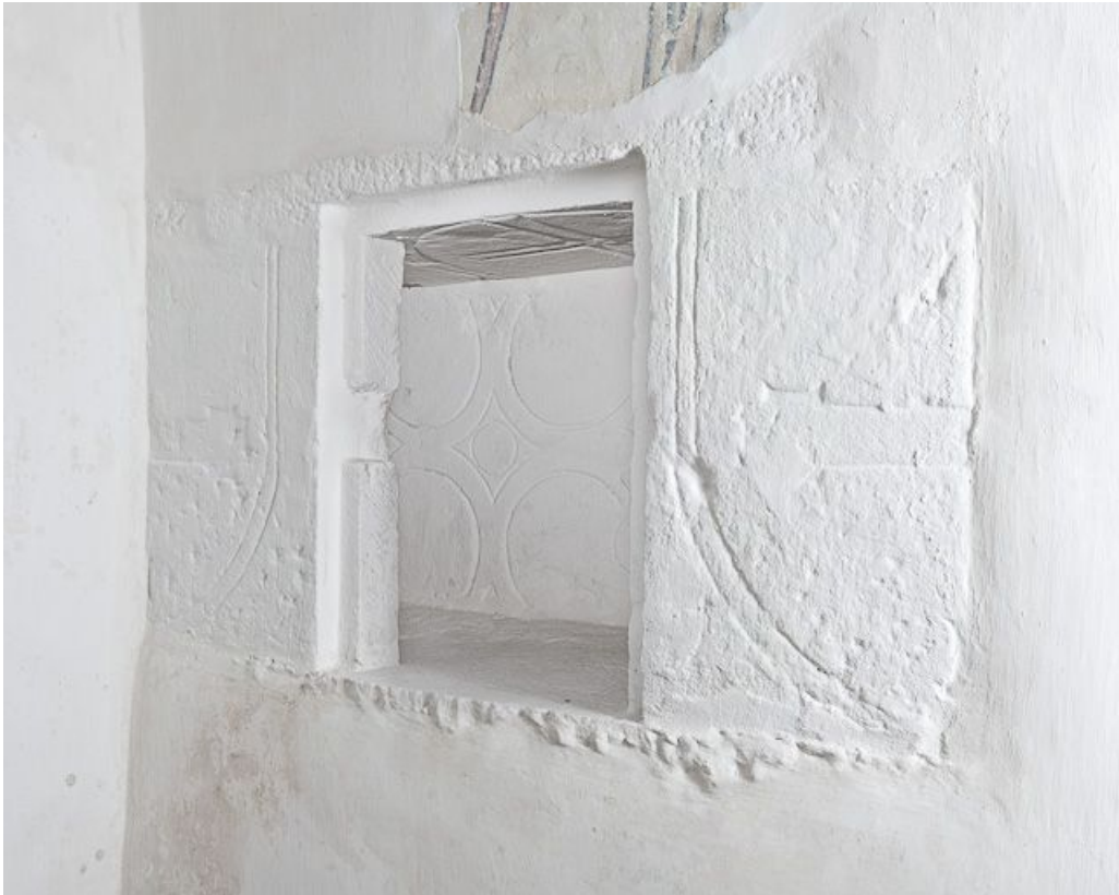
Niche de la dernière travée du bas-côté droit.