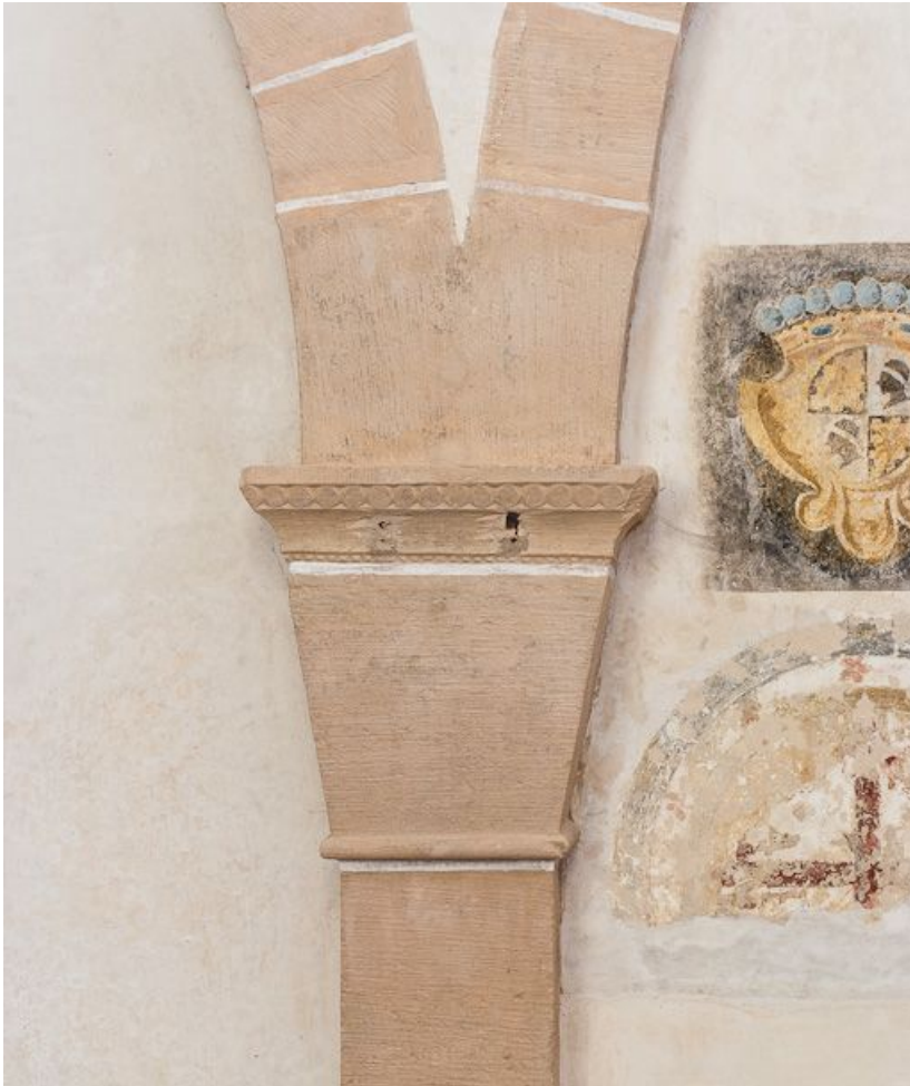
Chapiteau du deuxième pilastre droit de la nef.