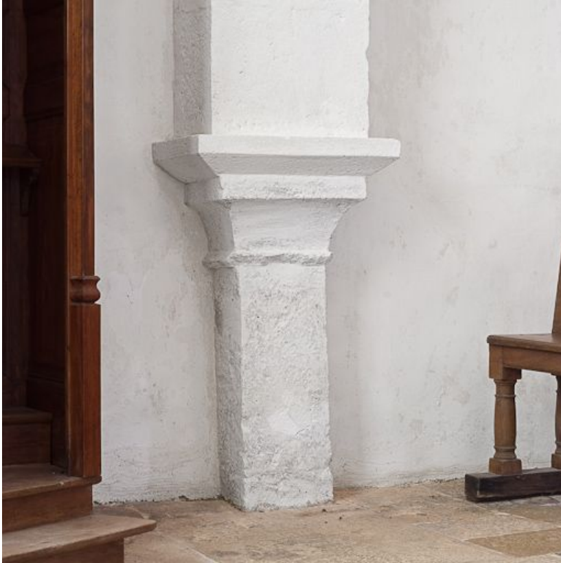
Bas-côté droit, pilier de l'arc antérieur de la dernière travée.