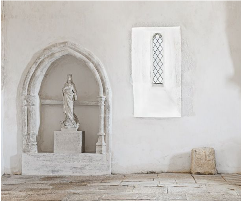
Niche et fenêtre de la deuxième travée du bas-côté droit.