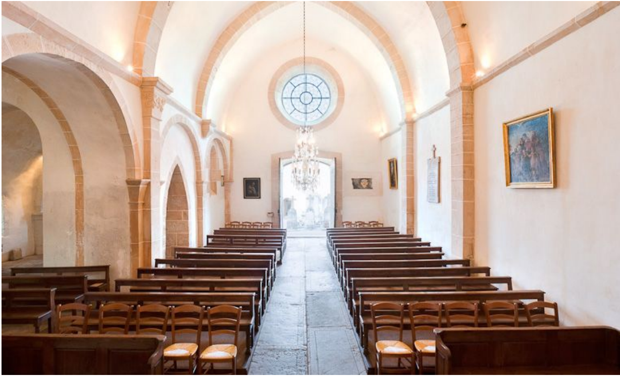
Nef et bas-côté depuis le chœur.