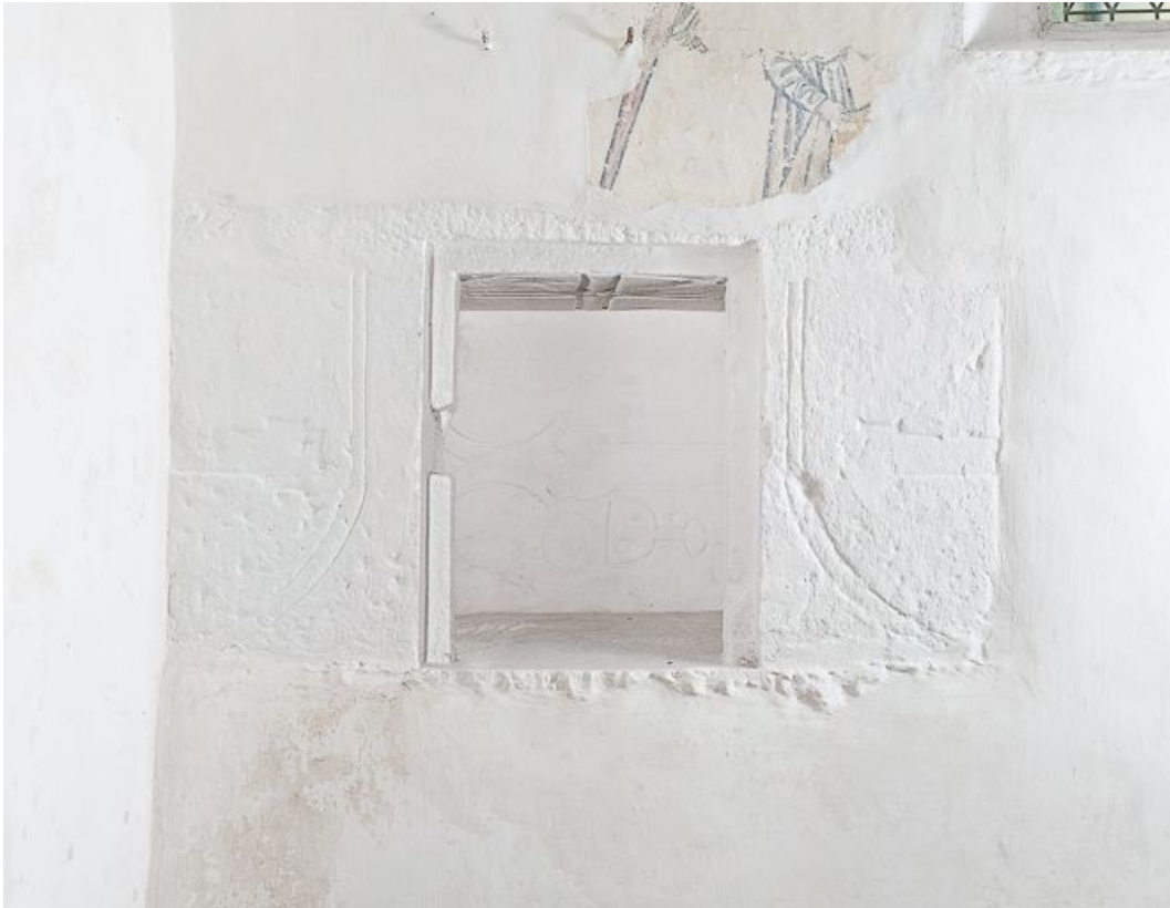
Niche de la dernière travée du bas-côté droit.