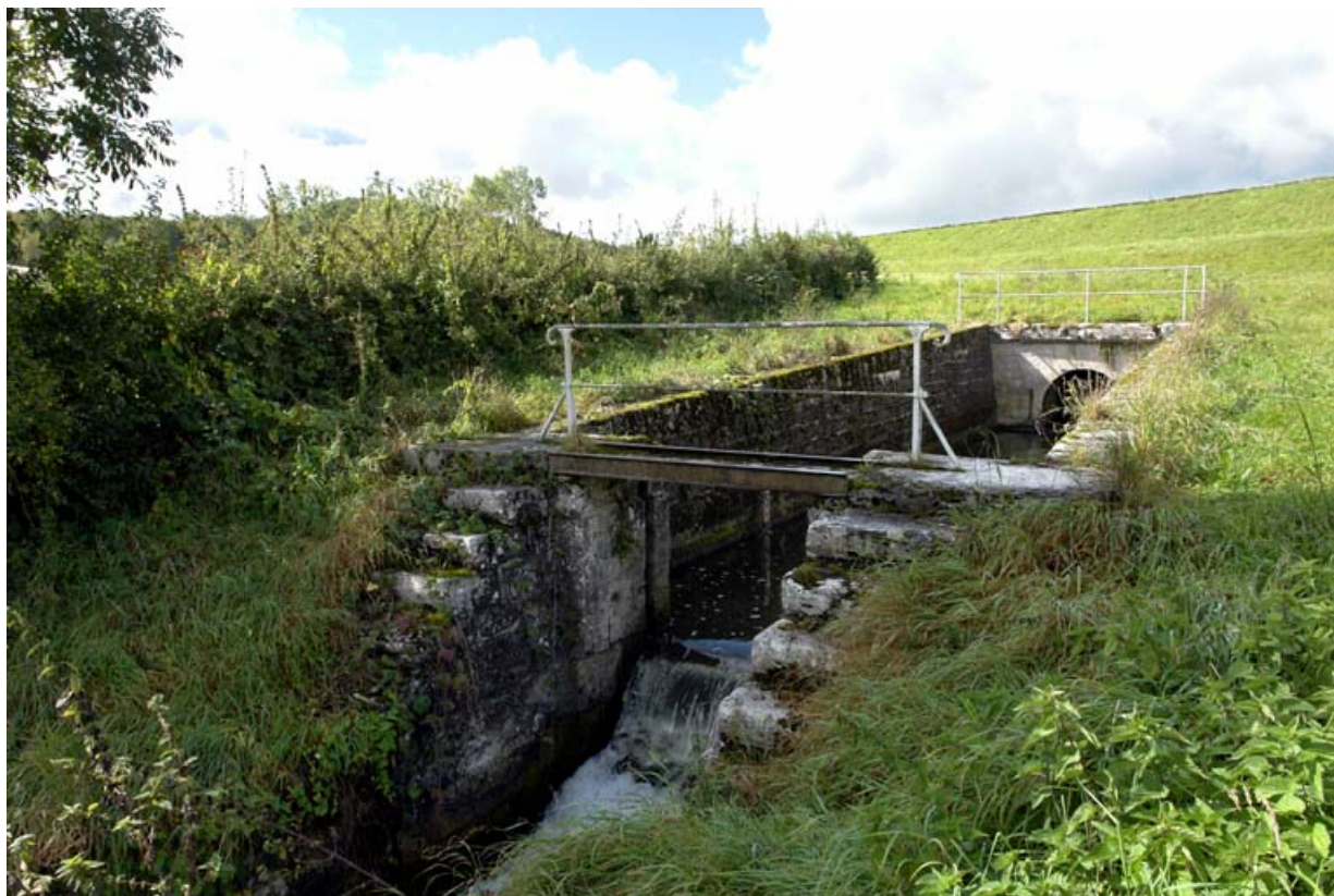
Aqueduc de vidange au centre de la digue principale.

21, Vandenesse-en-Auxois, lieu-dit : Panthier