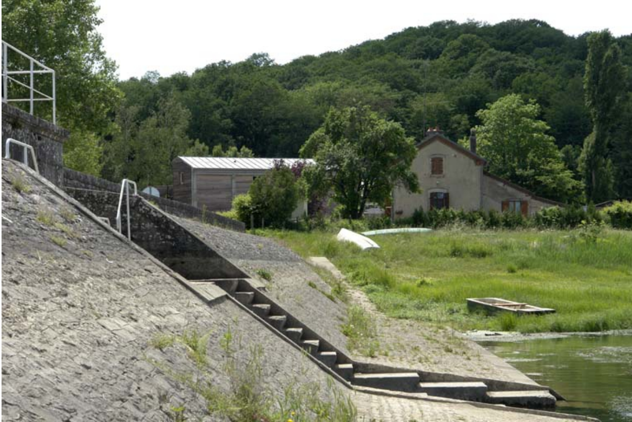
Digue est, extrémité sud avec les vannes de sortie d'eau. En arrière-plan, la maison de garde.

21, Vadenesse-en-Auxois, lieudit : Panthier