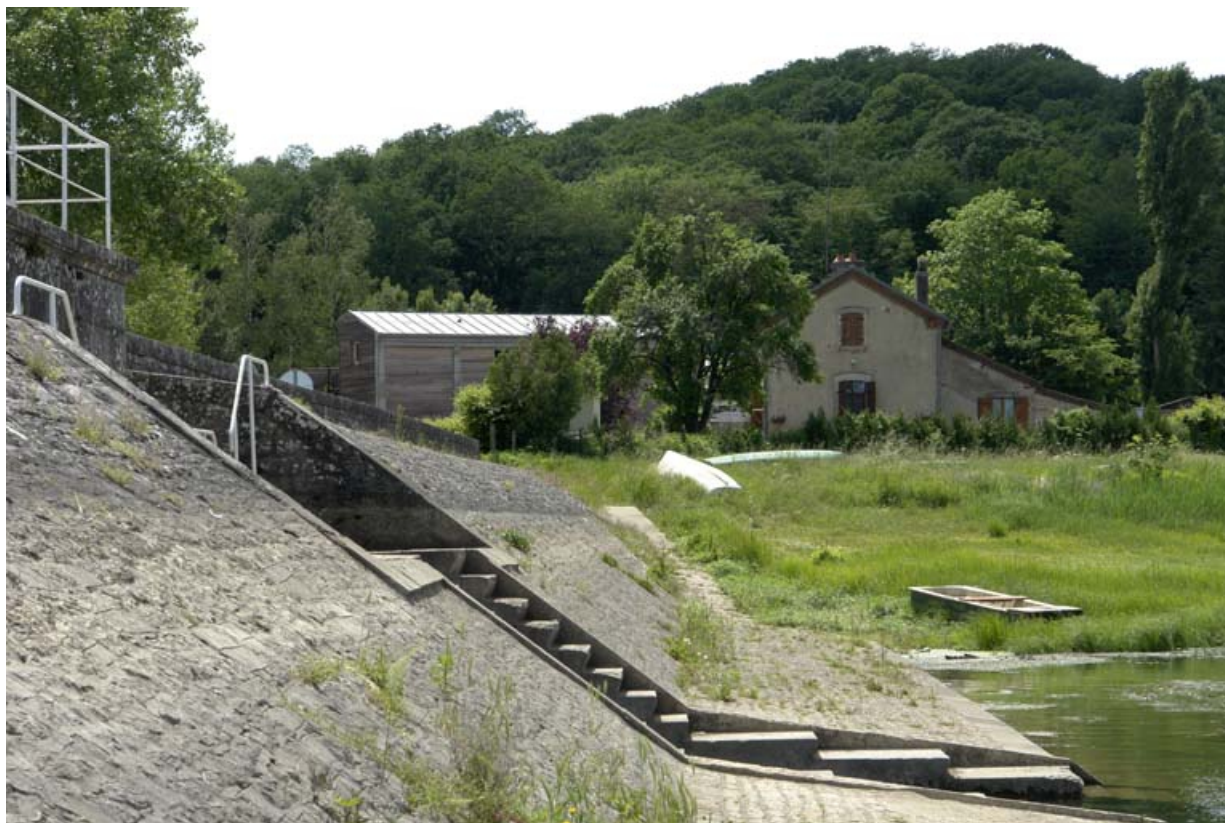
Digue est, extrémité sud avec les vannes de sortie d'eau. En arrière-plan, la maison de garde.

21, Vandenesse-en-Auxois, lieu-dit : Panthier