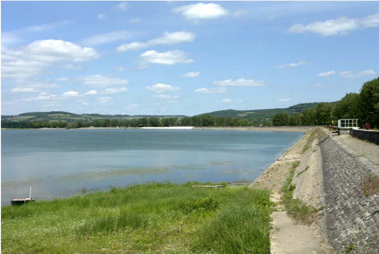
La digue et le plan d'eau, vue d'ensemble.

21, Vandenesse-en-Auxois, lieudit : Panthier