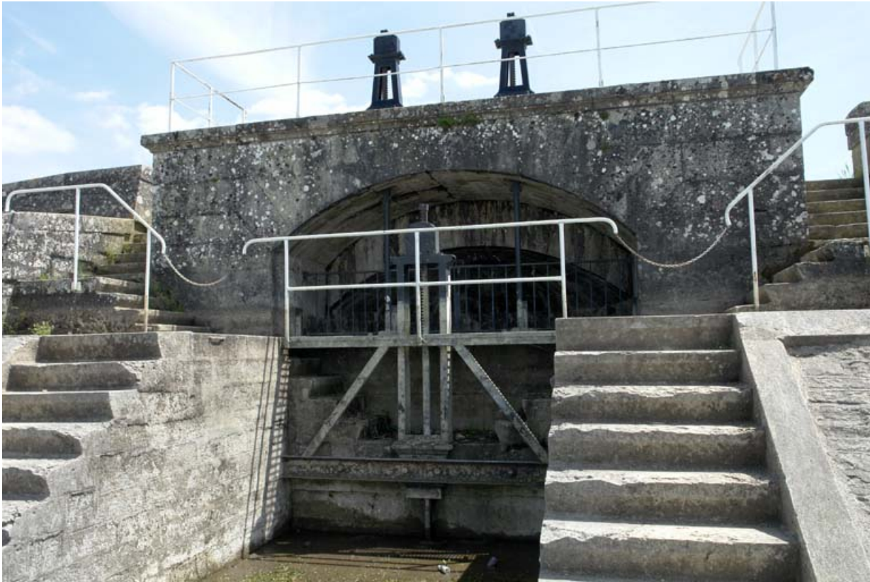
Digue est, ouvrage avec vannes en sortie du réservoir.

21, Vandenesse-en-Auxois, lieudit : Panthier