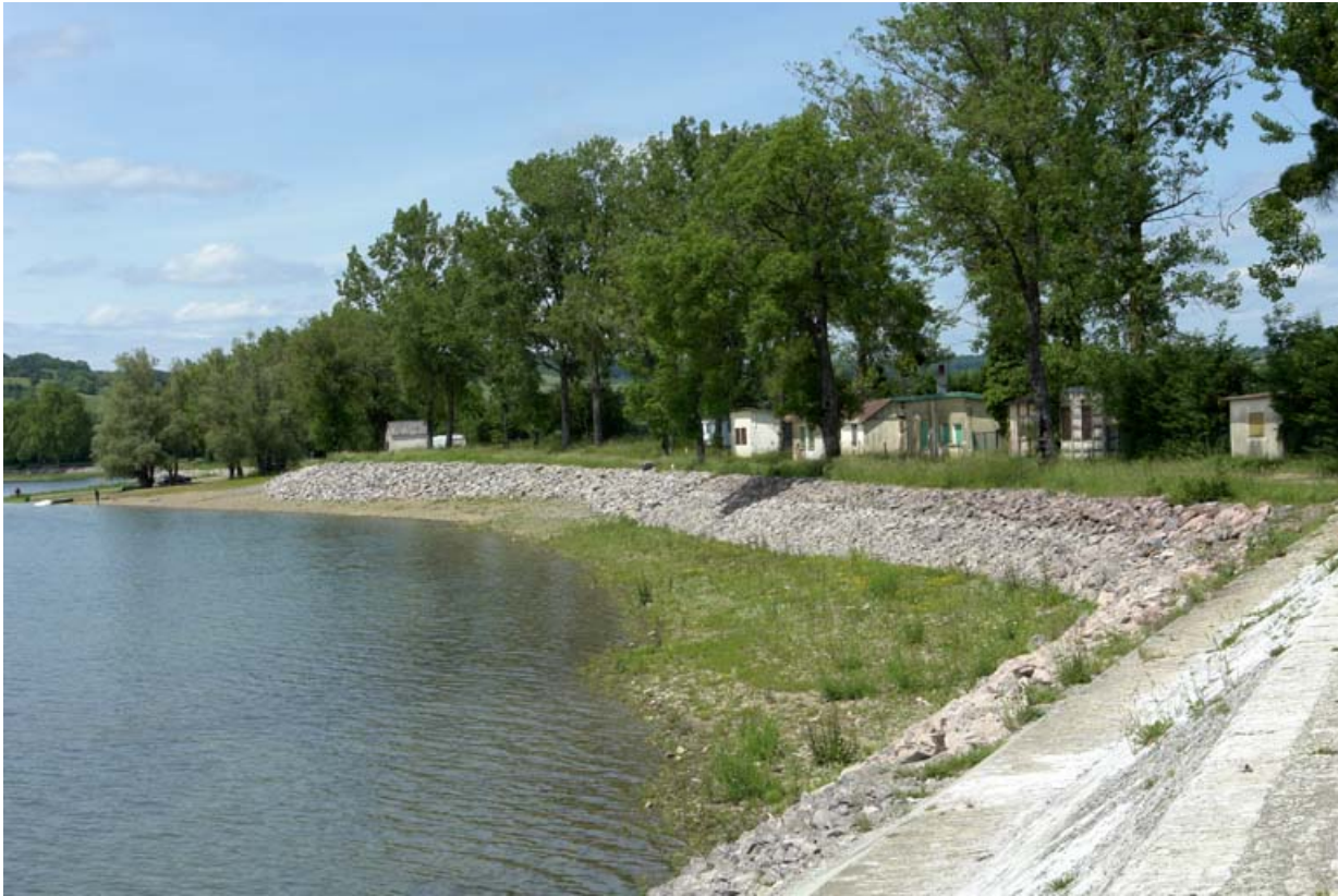
Digue est, extrémité nord.

21, Vadenesse-en-Auxois, lieudit : Panthier