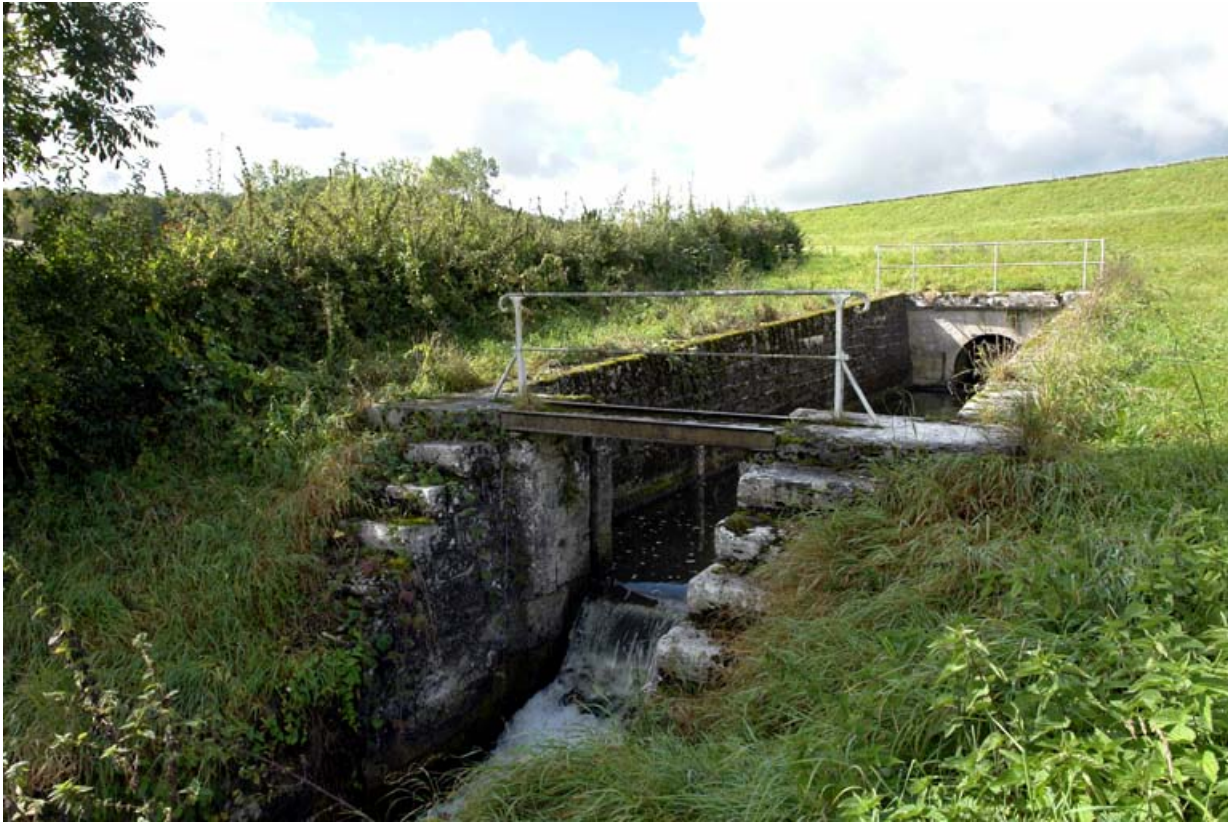
Aqueduc de vidange au centre de la digue principale.

21, Vandenesse-en-Auxois, lieudit : Panthier