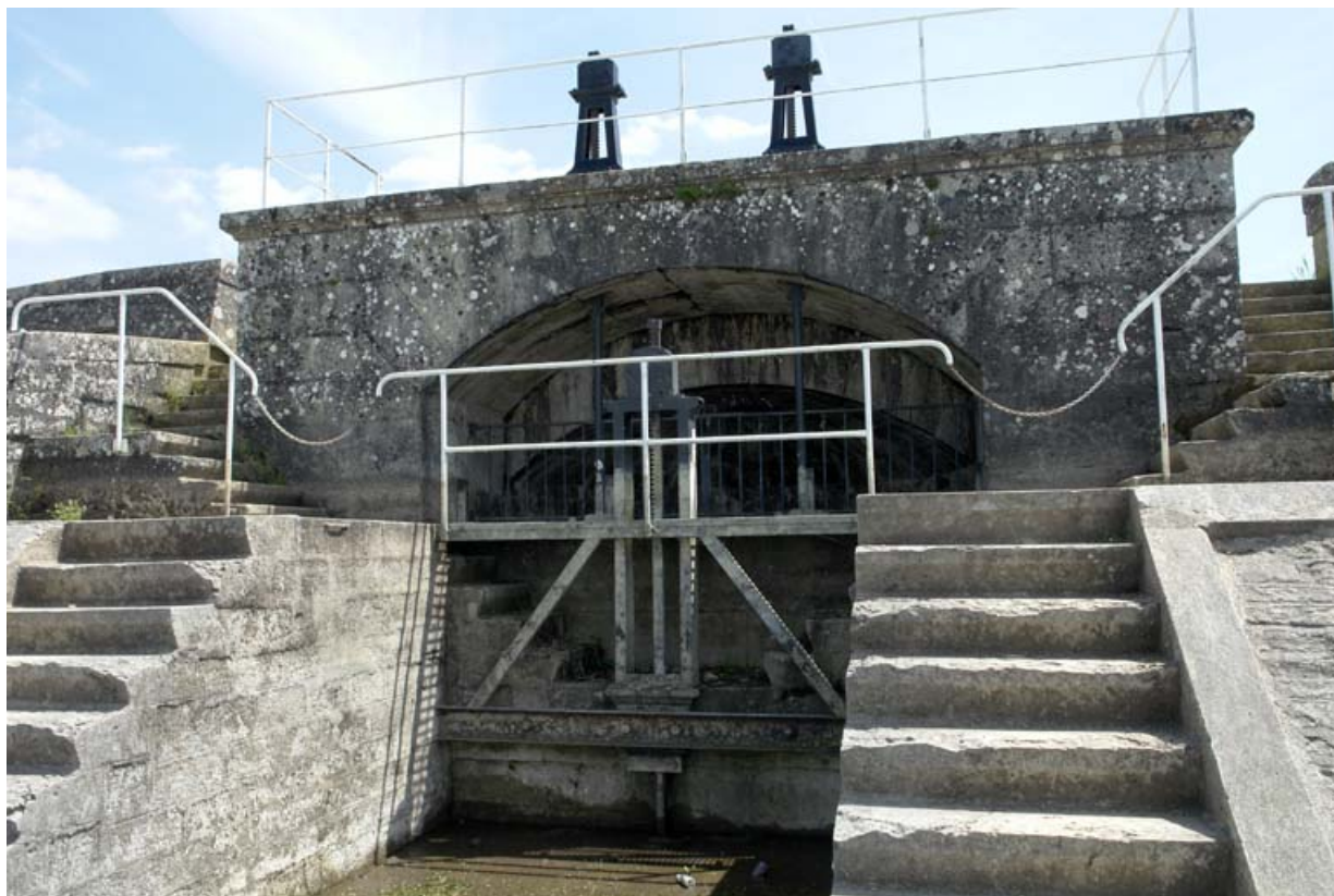
Digue est, ouvrage avec vannes en sortie du réservoir.

21, Vandenesse-en-Auxois, lieudit : Panthier