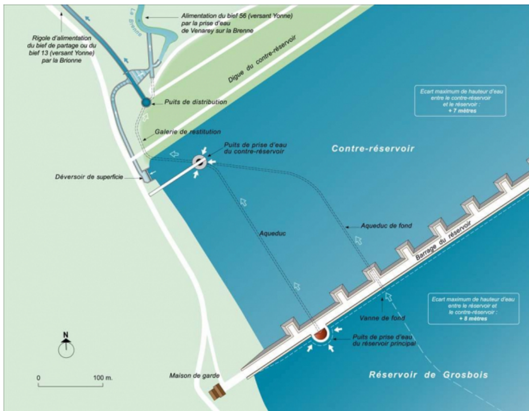
Plan schématique du réservoir de Grosbois, détail du barrage et du contre-réservoir.

21, Grosbois-en-Montagne, lieudit : Grosbois