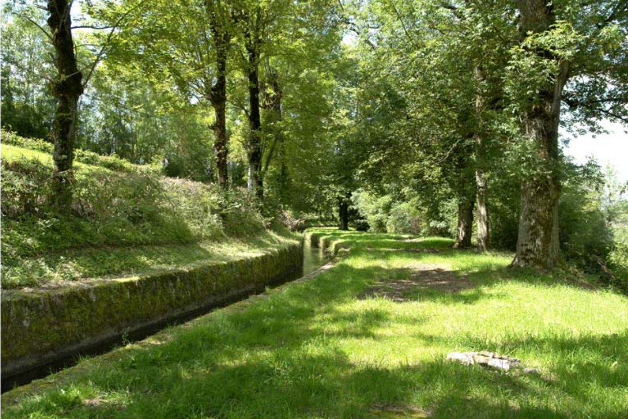
Rigole d'alimentation du canal en sortie du contre-réservoir.

21, Grosbois-en-Montagne, lieudit : Grosbois