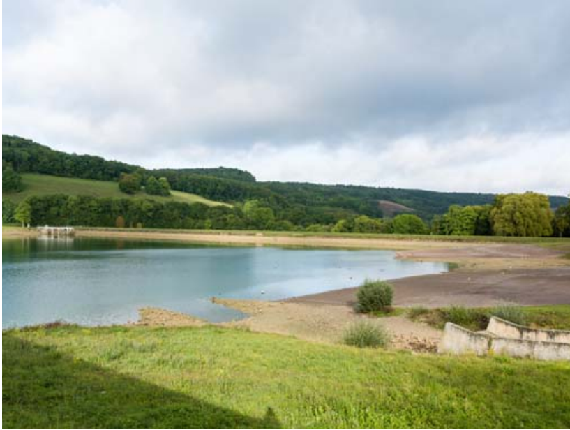
Vue de la tour de prise d'eau, de la digue et du déversoir de superficie.

21, Grosbois-en-Montagne, lieudit : Grosbois