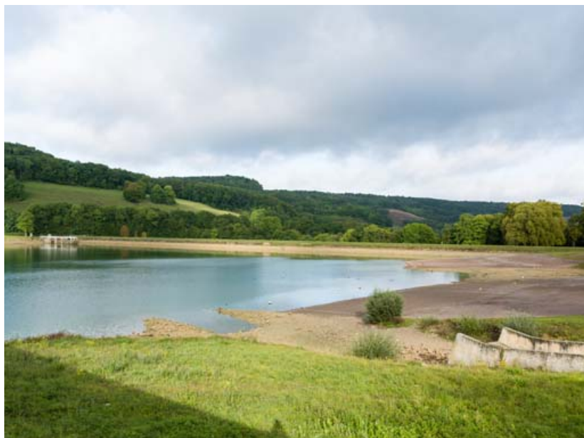
Vue de la tour de prise d'eau, de la digue et du déversoir de superficie.

21, Grosbois-en-Montagne, lieudit : Grosbois