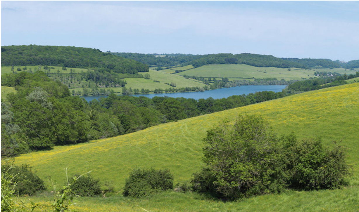
Le contre-réservoir de Grosbois, pris du village de Civry-en-Montagne.

21, Grosbois-en-Montagne, lieudit : Grosbois