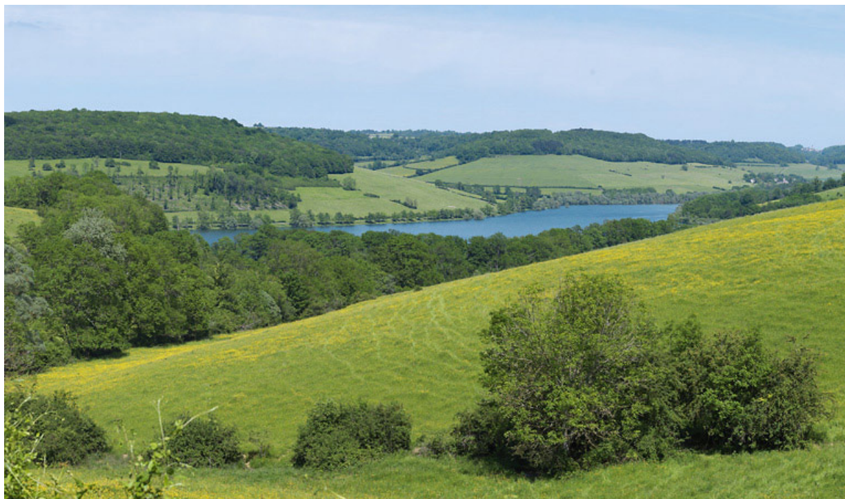
Le contre-réservoir de Grosbois, pris du village de Civry-en-Montagne.

21, Grosbois-en-Montagne, lieudit : Grosbois