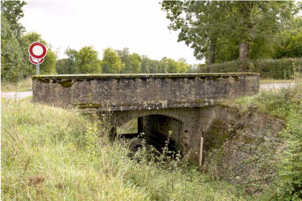
Pont routier sur la rigole de prise d'eau dite "rigole de Beaume", vue aval. 21, Chazilly, lieudit : Chazilly