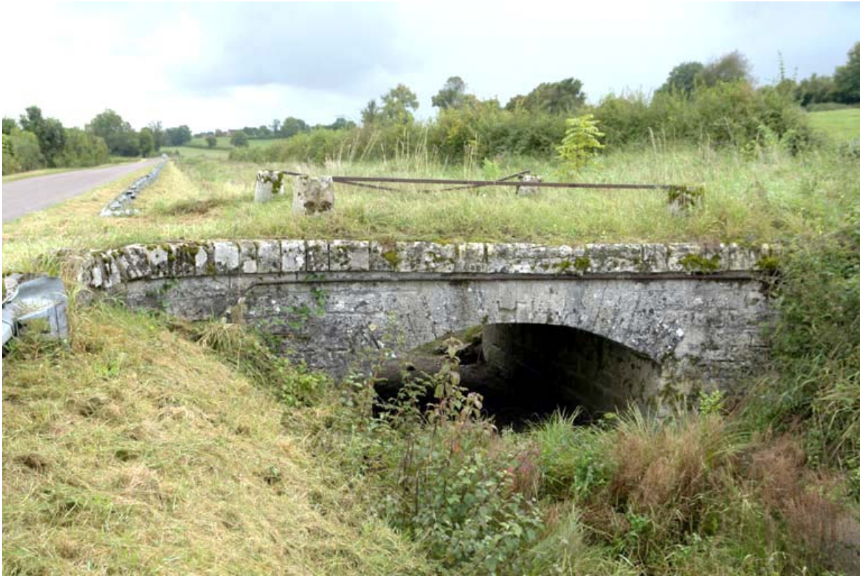
Pont de chemin sur la rigole de prise d'eau dite "rigole de Beaume".