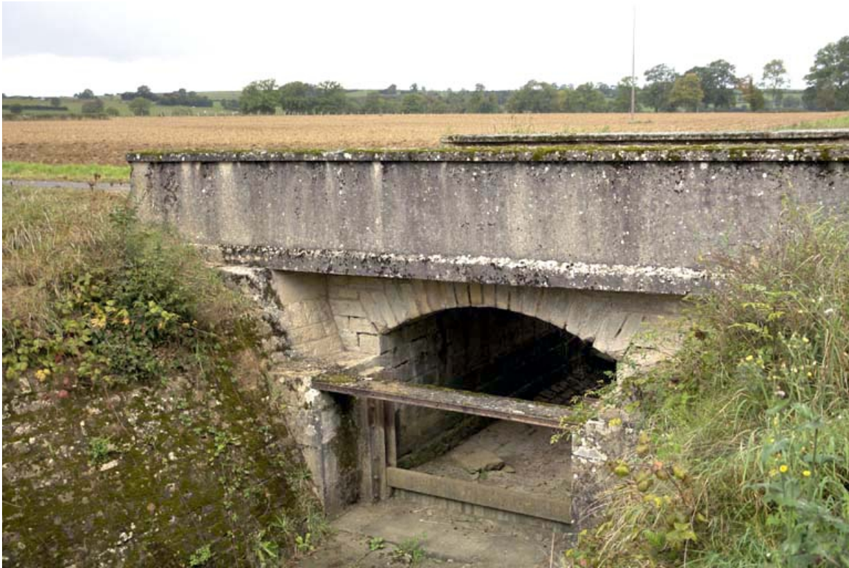
Pont routier sur la rigole de prise d'eau dite "rigole de Beaume", vue amont. 21, Chazilly, lieudit : Chazilly