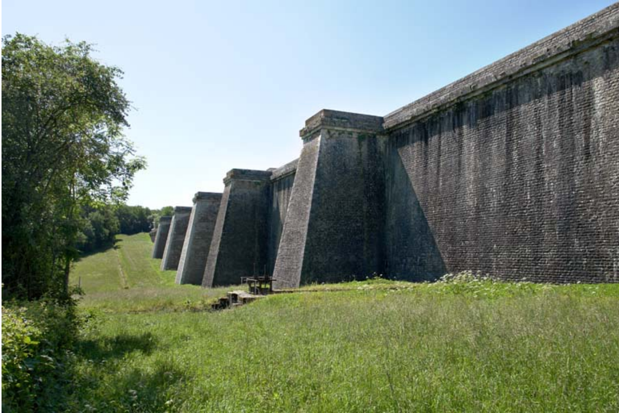
Face avant du barrage, vue de l'extrémité nord. La rigole d'alimentation au premier plan.