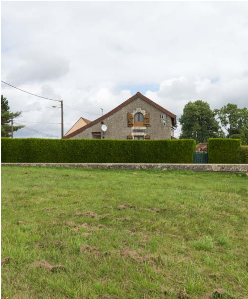
Vue d'ensemble de la maison.