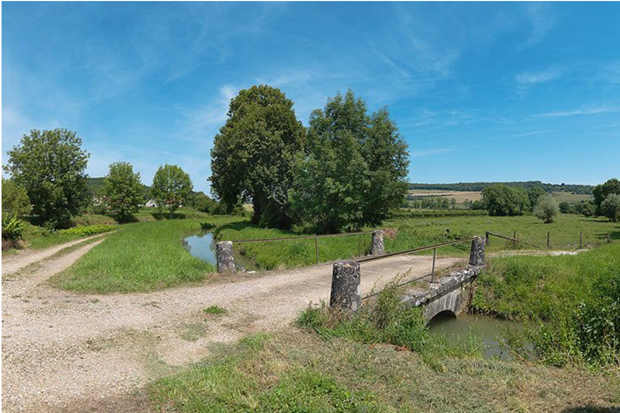
Pont sur la rigole en amont de son arrivée vers le canal.

21, Vandenesse-en-Auxois, lieudit : Panthier