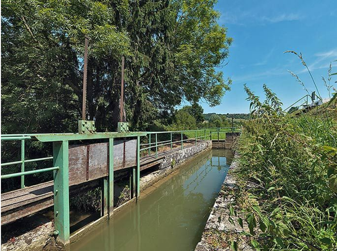
Vannes de régulation sur la rigole.

21, Vandenesse-en-Auxois, lieudit : Panthier