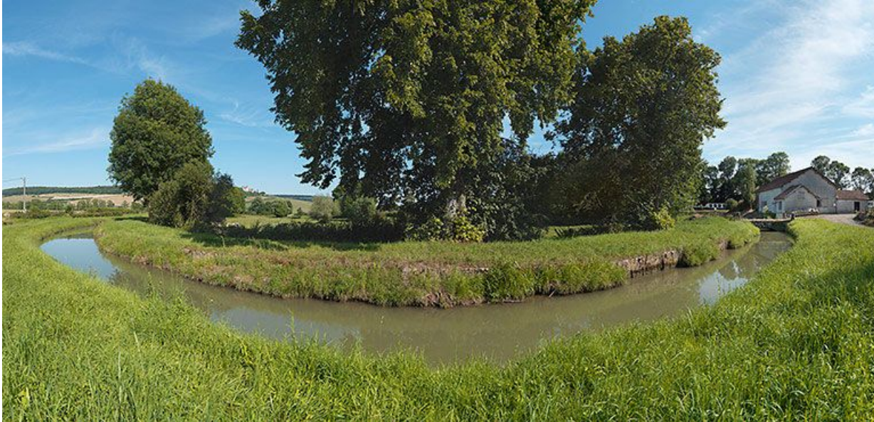
Vue de la rigole à son arrivée vers le canal.

21, Vandenesse-en-Auxois, lieudit : Panthier