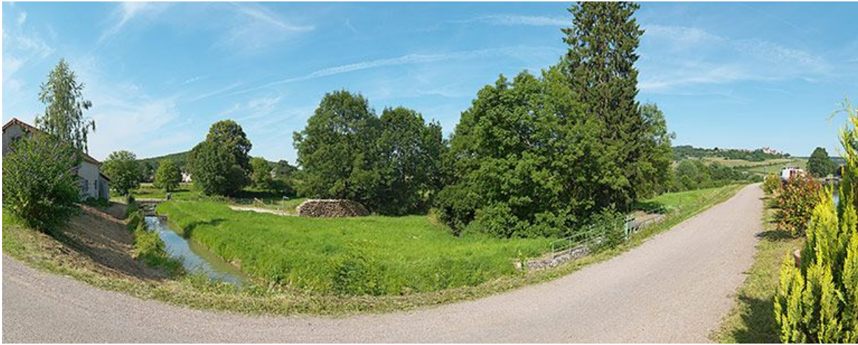
Vue d'ensemble de la rigole d'alimentation du réservoir de Panthier rive gauche. Vannes de régulation de la rigole. En arrière-plan, château de Châteauneuf.

21, Vandenesse-en-Auxois, lieudit : bief 09 du versant Saône