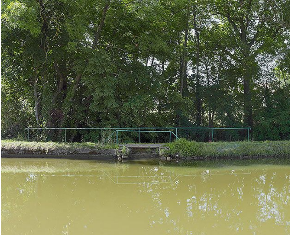
Vue du garde-corps de l'entrée de la Vandenesse sous le canal rive droite.

21, Vandenesse-en-Auxois, lieudit : bief 09 du versant Saône