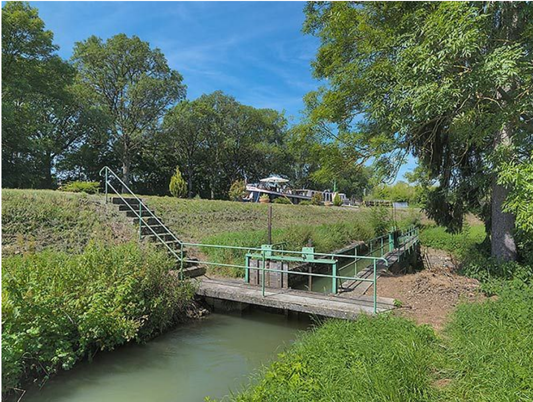
La rigole avec les vannes de régulation. A gauche, le talus du canal.

21, Vandesesse-en-Auxois, lieudit : Panthier