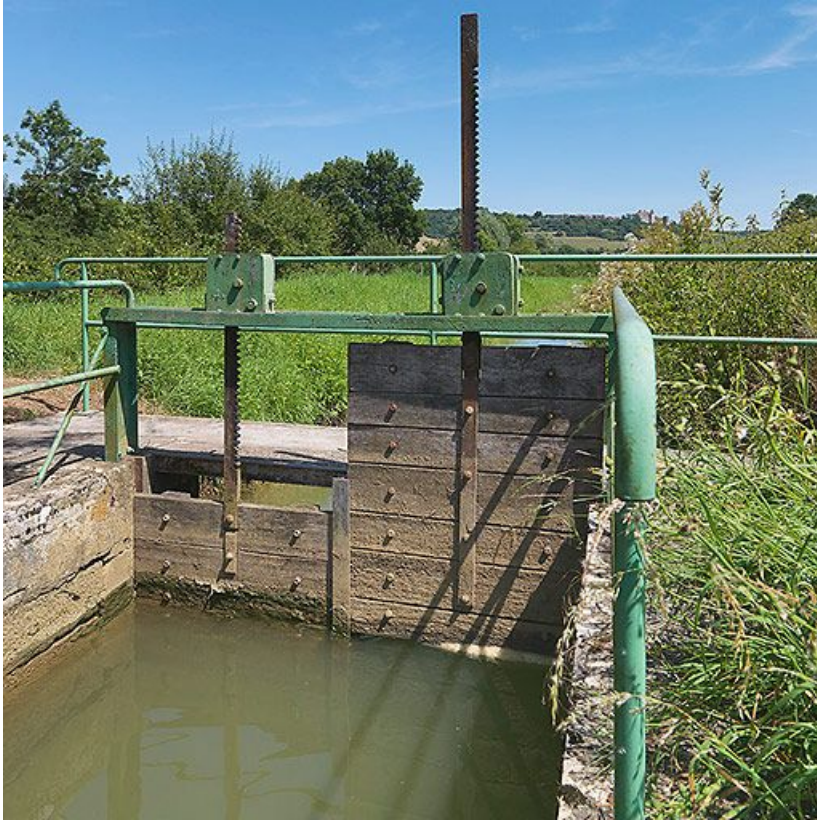
Vannes de régulation sur la rigole.

21, Vandenesse-en-Auxois, lieudit : Panthier