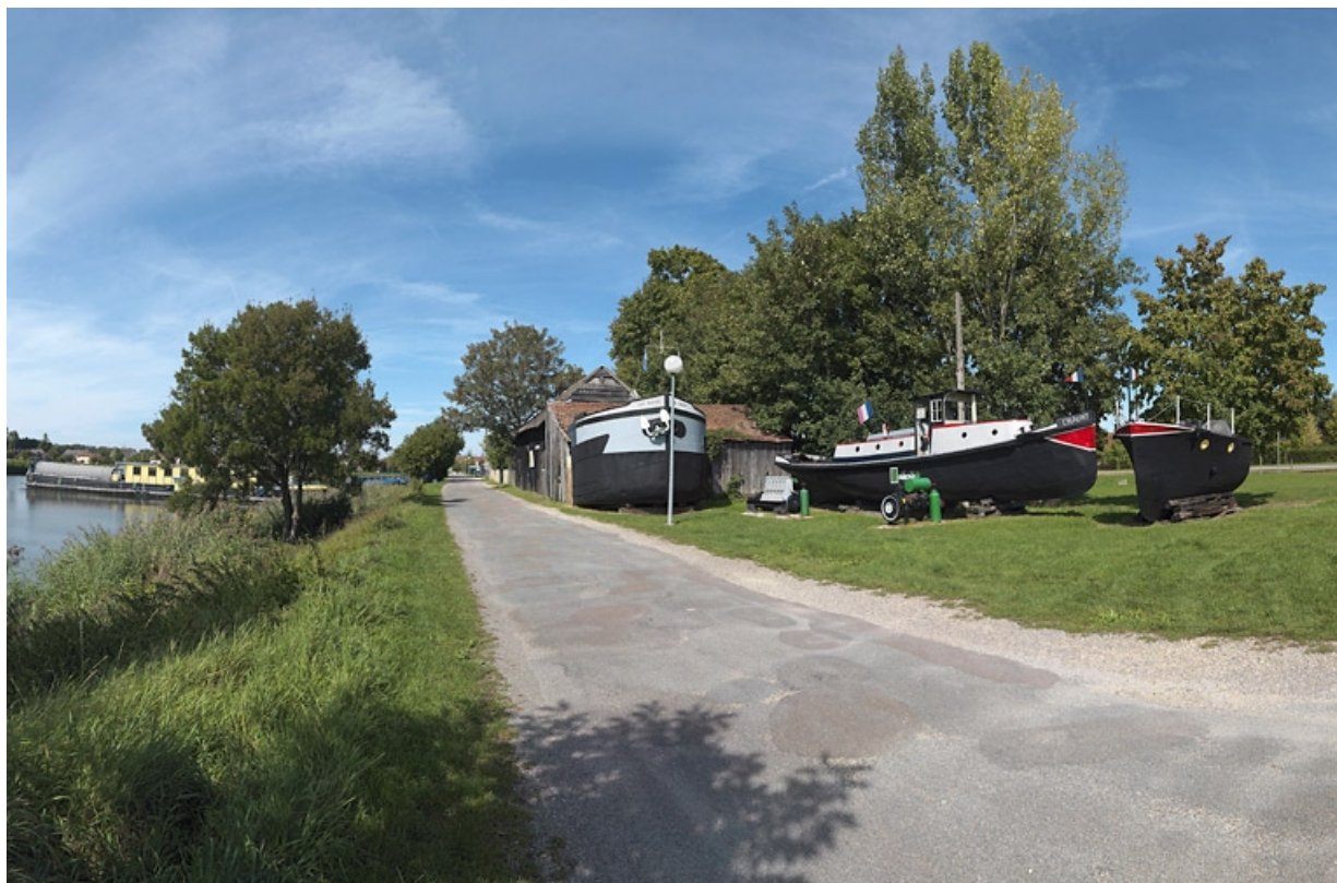
Vue d'ensemble du matériel flottant exposé devant la remise.

21, Saint-Jean-de-Losne, lieudit : bief 76 du versant Saône