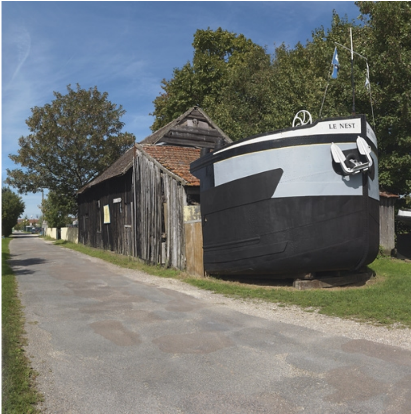
Proue de péniche devant la remise.

21, Saint-Jean-de-Losne, lieudit : bief 76 du versant Saône