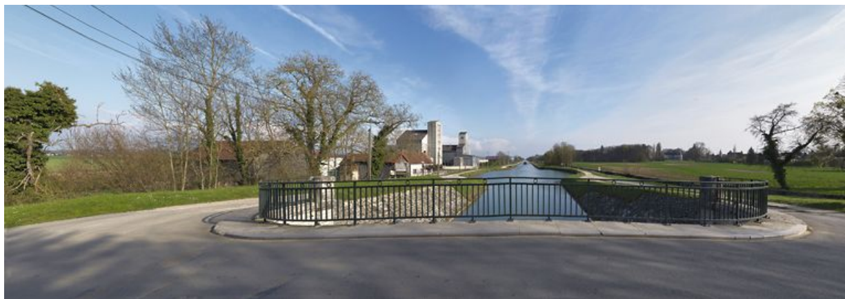
Silos et château de Longecourt vus du pont sur écluse.

N° de l'illustration : 20112103187NUC4AQ