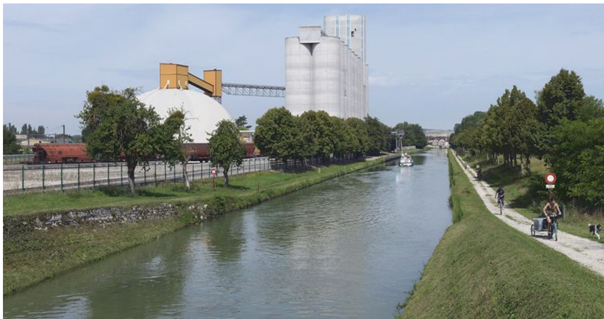
A Briennon-sur-Armançon, vue d'ensemble des silos avec accès par pont roulant au canal. A l'extrême-gauche, les voies SNCF.