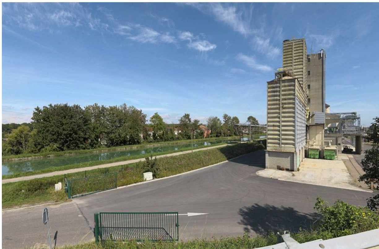
Les silos en bordure du canal après Eson.