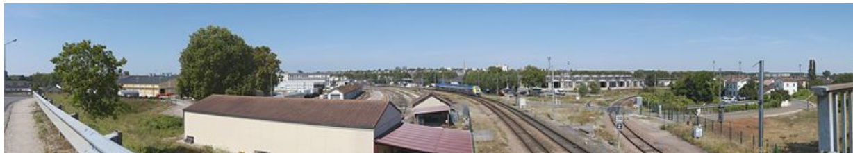
Vue d'ensemble du site SNCF et de la rotonde ferroviaire à Migennes. On aperçoit la flèche de l'église du Christ-Roi.