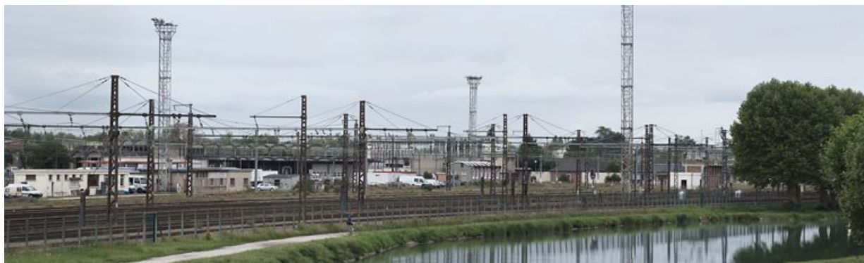
Site SNCF de Migennes, rive gauche du canal, en amont du site d'écluse 114-115 du versant Yonne.

N° de l'illustration : 20118900268NUC4AQ