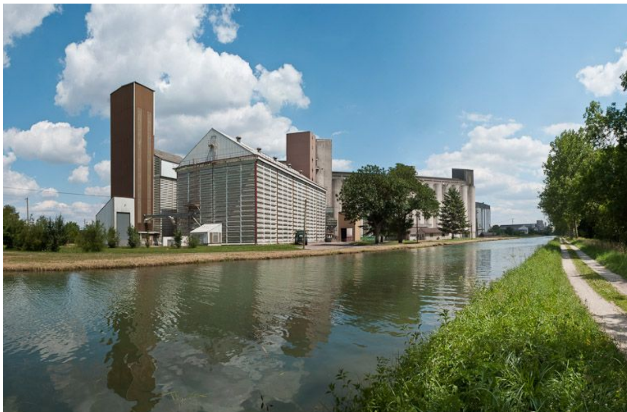
Vue des silos à Pacy-sur-Armançon.

N° de l'illustration : 20118900296NUC2AQ