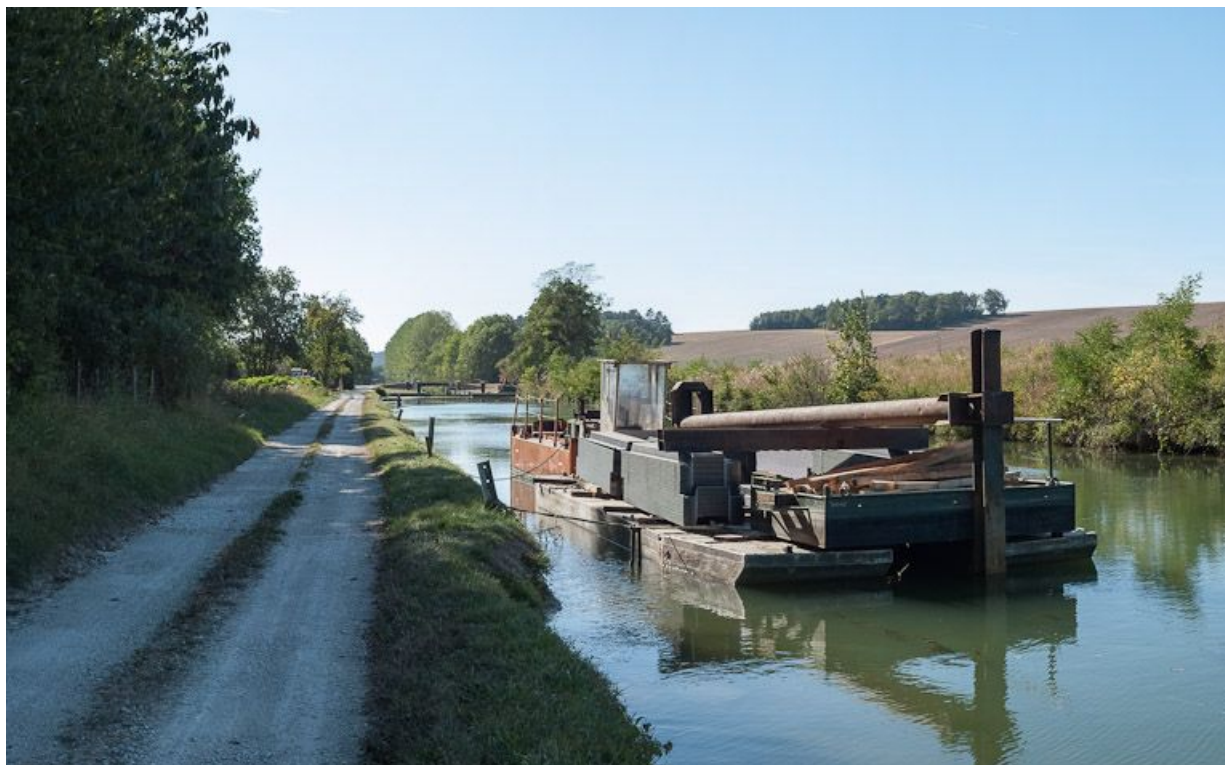
Barge de travaux sur palplanches à Ancy-le-Franc.

N° de l'illustration : 20128900505NUC2AQ