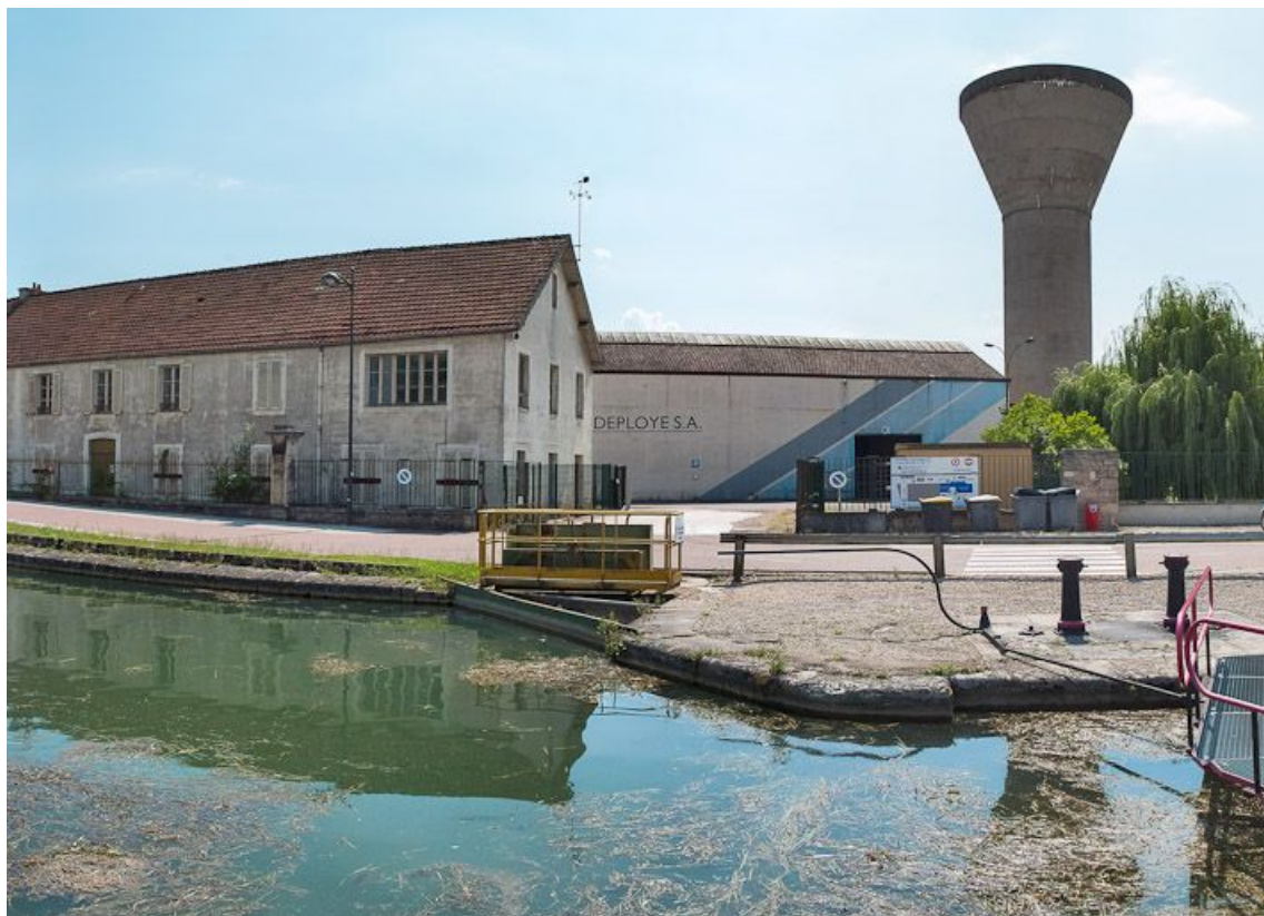
Prise d'eau dans le canal pour l'usine en arrière-plan à Montbard. Le tout est en amont du site d'écluse.

N° de l'illustration : 20122101926NUC2AQ