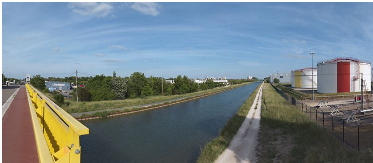
Sites industriels en bord de canal à Longvic.