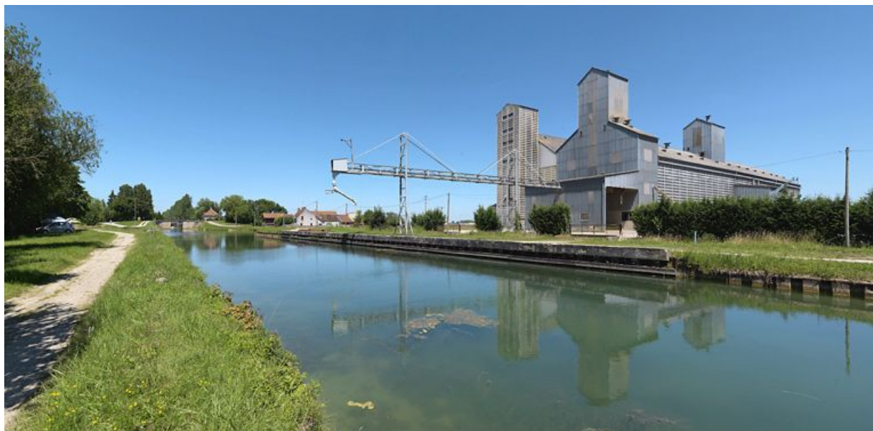
Silos à Longecourt-en-Plaine.