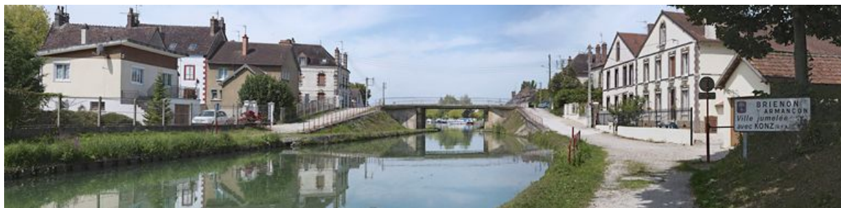
Anciennes entreprises sur le rive droite du canal, à l'entrée de Briennon.