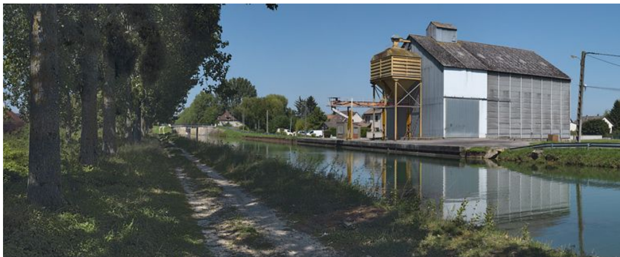
Silo avec système de déchargement lié au canal à Longecourt-en-Plaine.