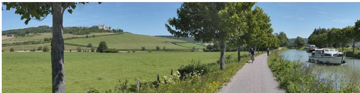
Panorama sur le canal et sur le village de Châteauneuf, en surplomb à gauche : le château.

N° de l'illustration : 20122102142NUC4AQ