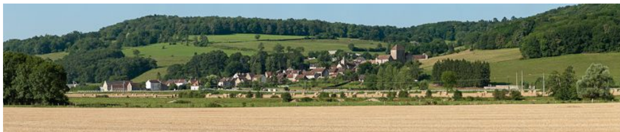
Vue panoramique du village de Courcelles-lès-Montbard avec, de gauche à droite, la maison éclusière de type Forey, l'église paroissiale et la maison forte.

N° de l'illustration : 20122101904NUC4AQ