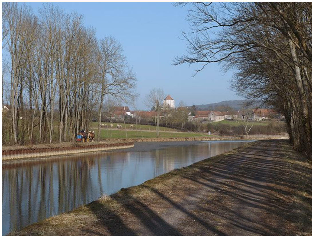
Le village de Saint-Thibault derrière le port.