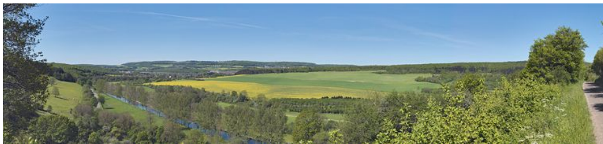
Panorama centré sur le site de Pont-d'Ouche.

N° de l'illustration : 20122102351NUC4AQ