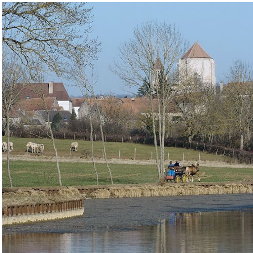
Le village de Saint-Thibault derrière le port.