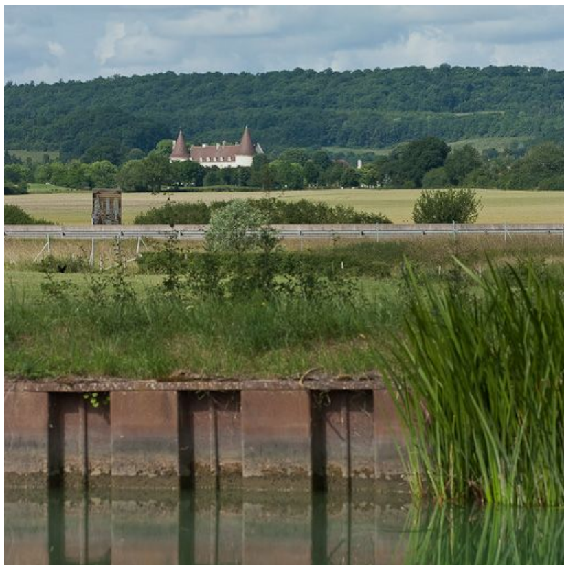
Vue du château de Chailly depuis le site d'écluse 08 du versant Yonne.

N° de l'illustration : 20112103715NUC2AQ