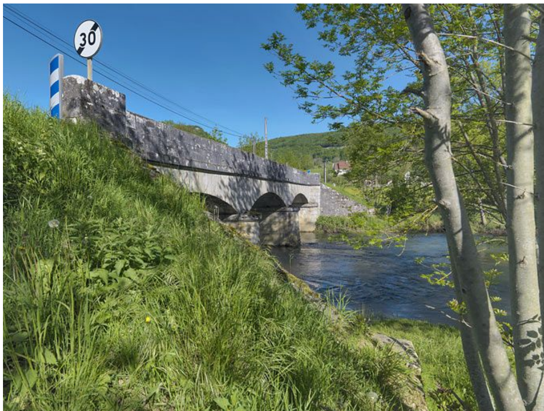
Le pont ancien en pierre sur l'Ouche à Saint-Victor-sur-Ouche.