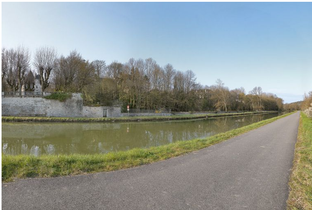
La traversée de Fleurey-sur-Ouche par le canal : enceinte du château de l'ancien prieuré Saint-Marcel et jardins des autres demeures.

N° de l'illustration : 20122102571NUC4AQ