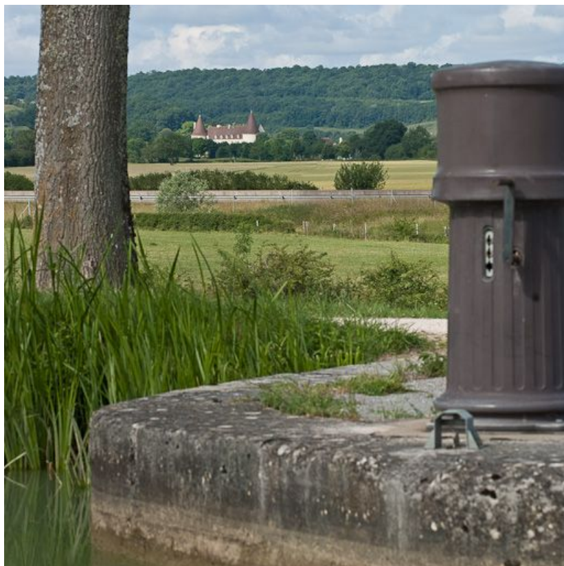
Vue du château de Chailly depuis le site d'écluse 08 du versant Yonne.

N° de l'illustration : 20112103714NUC2AQ