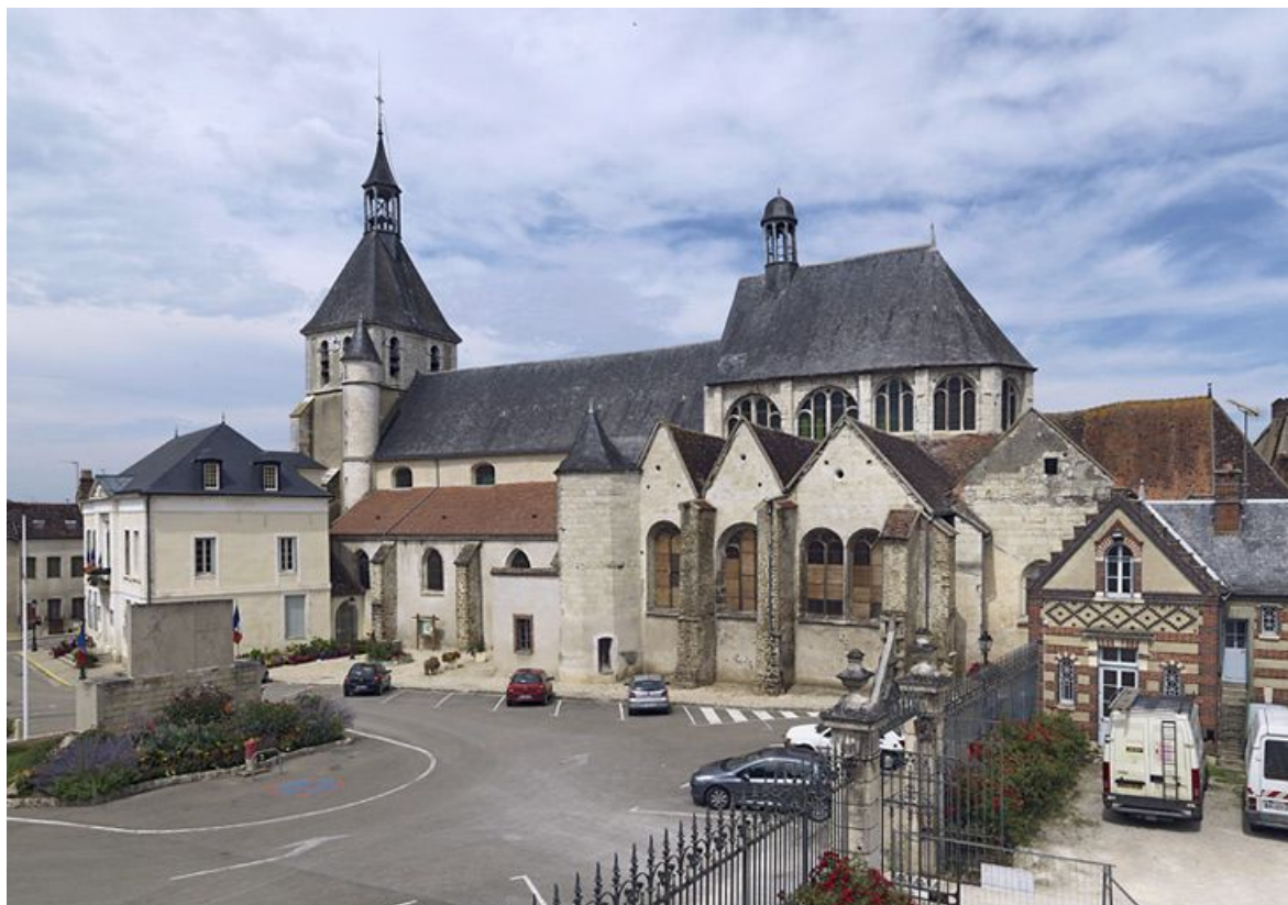
Eglise de Briennon-sur-Armançon, vue d'ensemble.