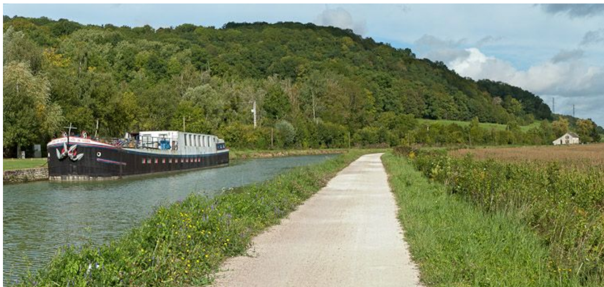
Chemin de halage, bateau.

N° de l'illustration : 20112104060NUC4AQ