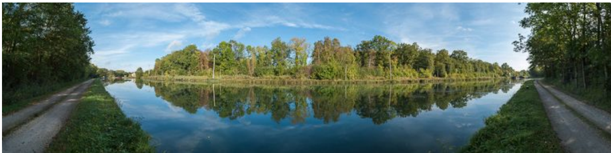
Alignement d'arbres le long du bief à Flogny-la-Chapelle.

N° de l'illustration : 20128900549NUC4AQ