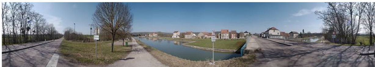
360° sur le port de Pont-Royal.

N° de l'illustration : 20122102729NUC4AQ