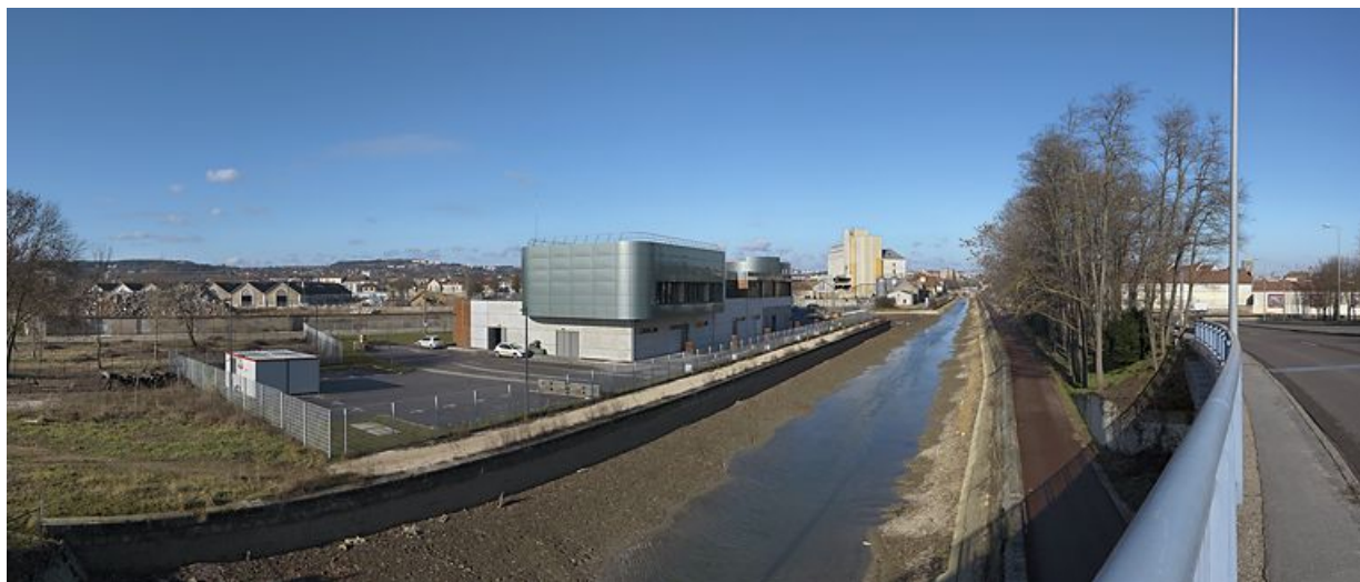
Le centre d'aiguillage SNCF depuis le pont du boulevard Maillard, bief 56 du versant Saône, à Dijon. Les grandes minoteries dijonnaises (à l'arrière-plan) sont cours de démolition.