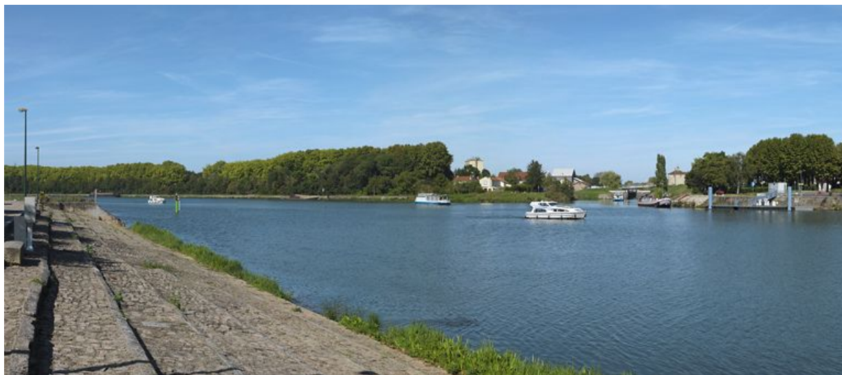
La Saône. A l'arrière-plan, l'arrivée du canal.