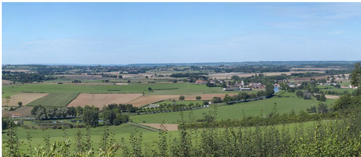
Le canal vu de la colline de Châteauneuf-en-Auxois. Le village de Vandenesse-en-Auxois se trouve à droite. De droite à gauche : sites d'écluse 08, 09 et 10 S.