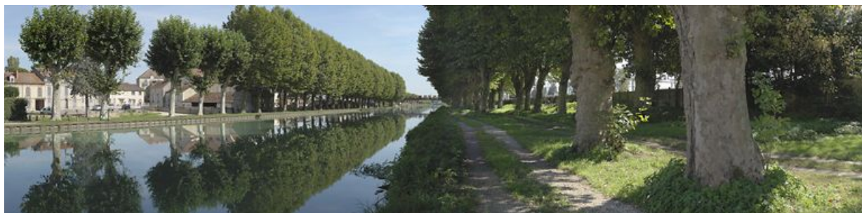
Alignement de platanes à l'arrivée du canal à la dernière écluse avant l'Yonne.