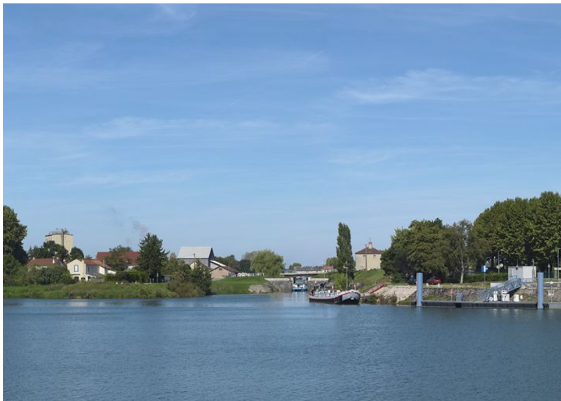
Débouché du canal dans la Saône à Saint-Jean-de-Losne : à l'arrière-plan, on aperçoit le pont sur l'écluse 76.