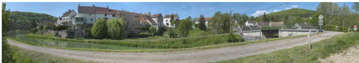
Panorama du canal lors de son passage dans le village de La Bussière.

N° de l'illustration : 20122102456NUC4AQ