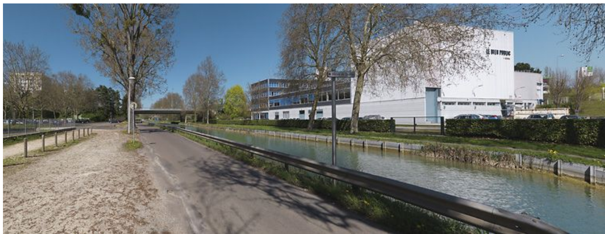
La traversée de Dijon : immeuble du quotidien régional "Le Bien Public". En arrière-plan, le pont routier menant à la Fontaine-d'Ouche.