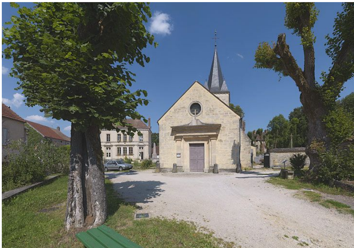
L'église de Gissey de face, la mairie-école à gauche et à droite, le cimetière, derrière dans les arbres, le château.