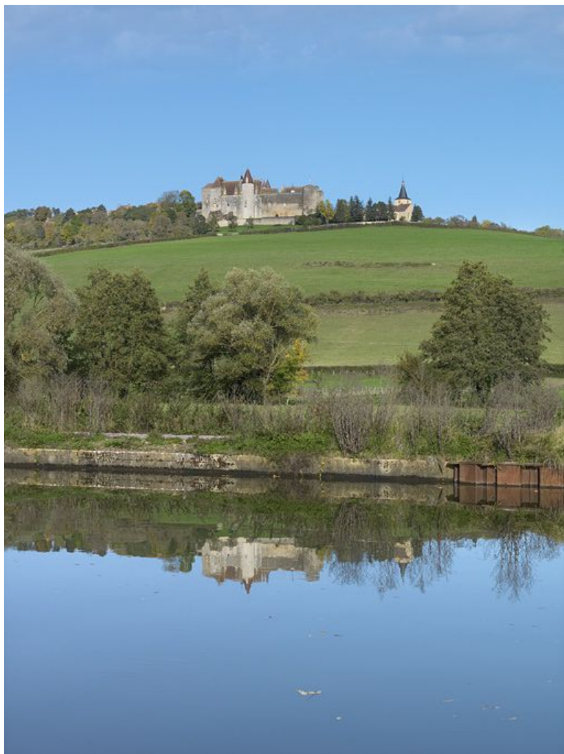
Le château de Châteauneuf de la rive droite du canal.