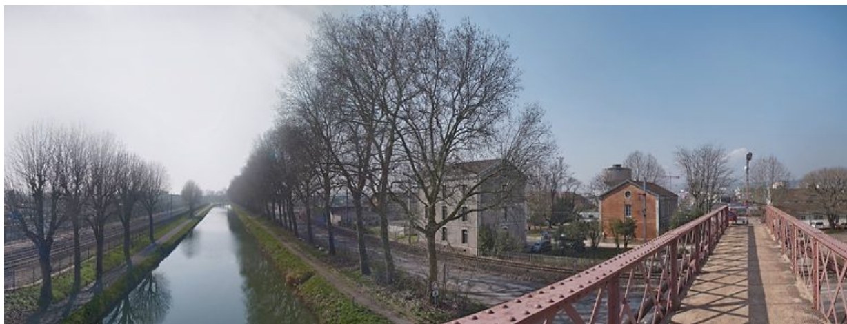
Bureaux du technicentre SNCF.

N° de l'illustration : 20112102934NUC4AQ