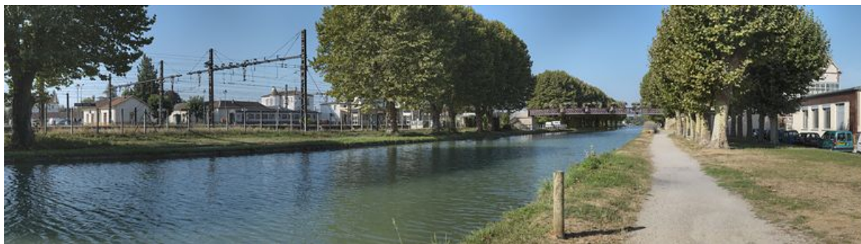
Panorama du canal traversant Migennes en direction de l'Yonne. A gauche, le site SNCF et la gare, la passerelle menant à la gare.