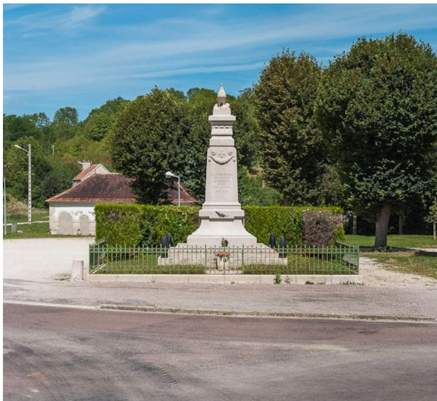
Le monument aux morts : vue d'ensemble.

N° de l'illustration : 20128900403NUC2AQ