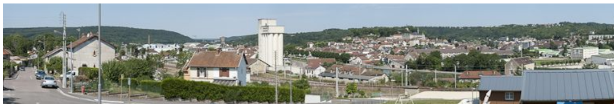
Vue d'ensemble de Montbard. Le port et la ville industrielle au premier plan et la ville ancienne sur la colline.

N° de l'illustration : 20122101913NUC4AQ