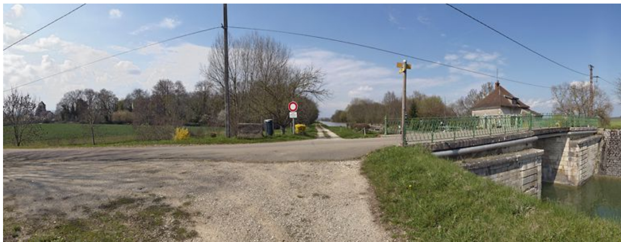
Ouges, Vue d'ensemble, de gauche à droite : église Saint-Pierre ; château avec parc situé rive droite du canal, en amont du pont sur écluse ; chemin de halage, pont sur écluse. On aperçoit derrière ce pont la maison éclusière.

N° de l'illustration : 20112103062NUC4AQ