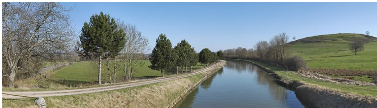
Alignement de pins le long du canal.

N° de l'illustration : 20122102781NUC4AQ