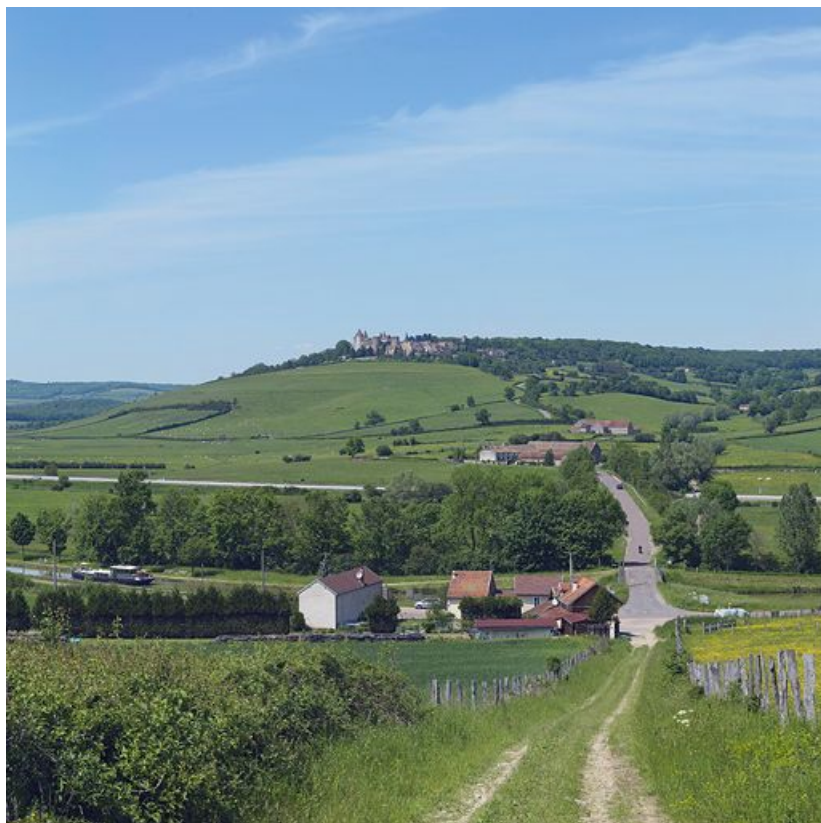
Grand panorama centré sur l'axe du pont routier de Sainte-Sabine sur le canal. Château de Châteauneuf en arrière-plan.