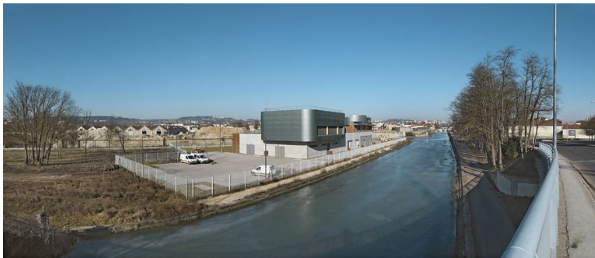
Traversée du canal à Dijon : le canal en amont du pont permettant le passage des boulevards John-Kennedy et Maillard. De gauche à droite : entrepôts SNCF en cours de reconversion ; poste d'aiguillage informatisé de la SNCF Thierry Sarrat ; port des minoteries dijonnaises (elles-mêmes détruites) ; nouveau pont sur l'écluse 55 ; boulevards John-Kennedy et Maillard.