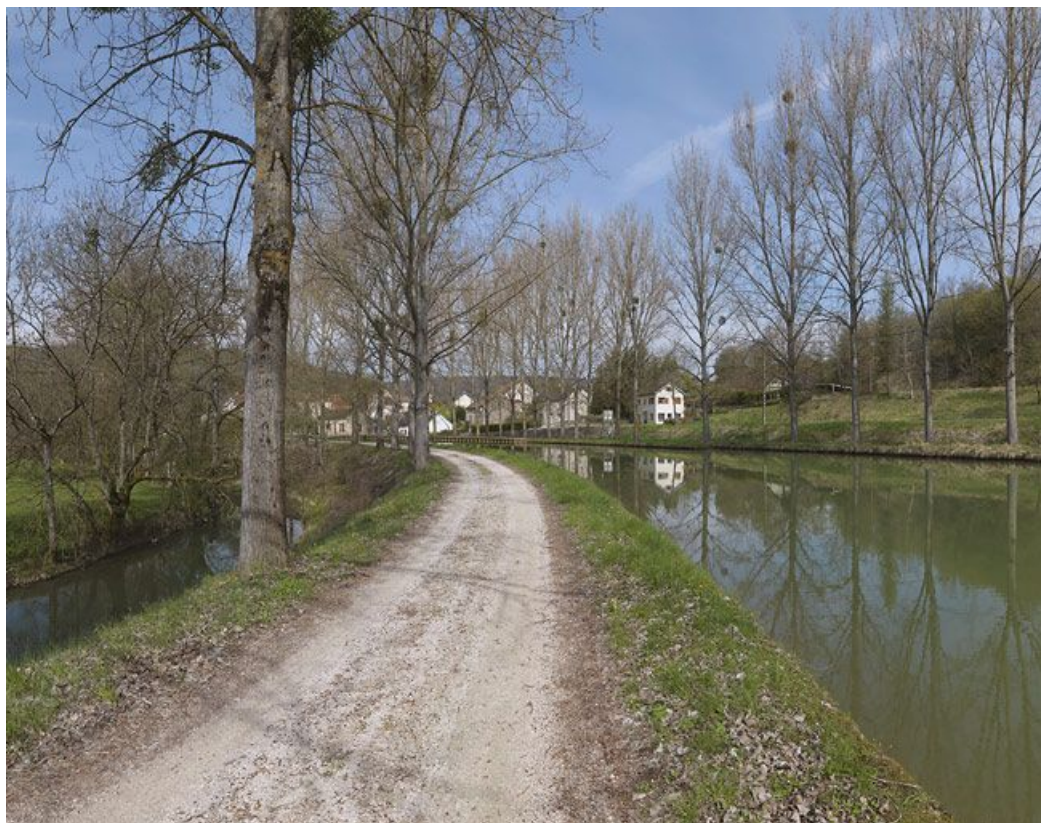
Passage du canal dans la vallée de l'Ouche : l'Ouche, le chemin de halage, au fond : le site d'écluse 25 et le canal avec un alignement d'arbres de chaque côté.