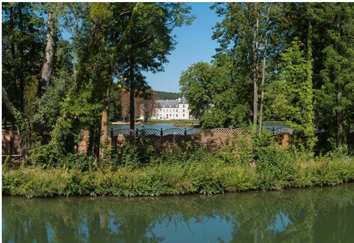
Le château d'Ancy-le-Franc vu du canal.

N° de l'illustration : 20128900498NUC4AQ