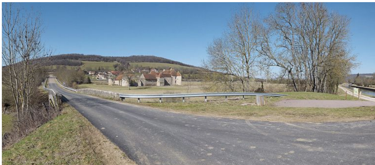
Le château d'Eguilly dans son environnement : le pont en pierre sur l'Armançon. Le village d'Eguilly. Le château. Le canal à droite.