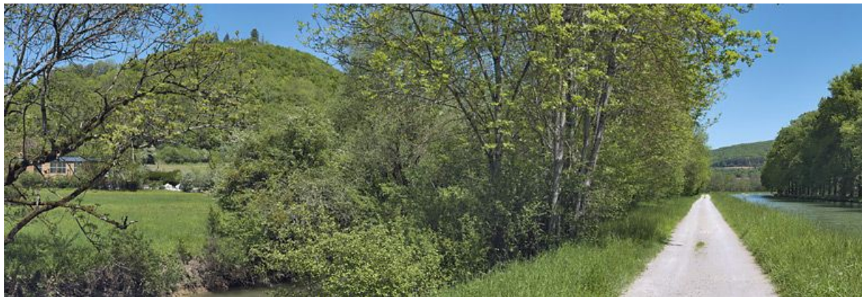
Paysages de la vallée de l'Ouche : sur la colline à gauche, on aperçoit les ruines du château de Marigny.