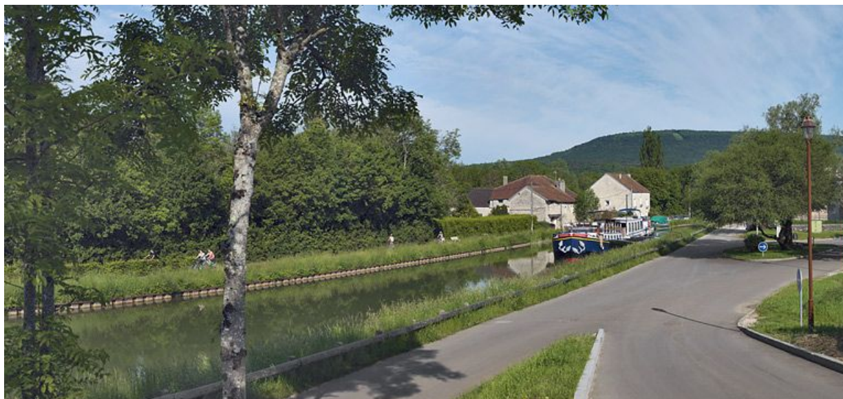
La traversée de Fleurey-sur-Ouche par le canal : vue sur Notre-Dame-de-l'Etang. Le long de la rive gauche du canal : l'ancien moulin des Roches.

N° de l'illustration : 20122102572NUC4AQ