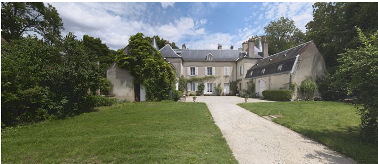
Le château de Petit-Ouges vu de l'entrée.