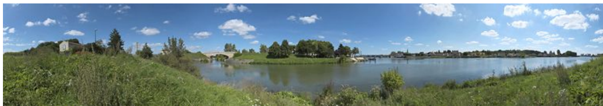
Vue d'ensemble du débouché du canal dans la Saône.

N° de l'illustration : 20112103425NUC4AQ