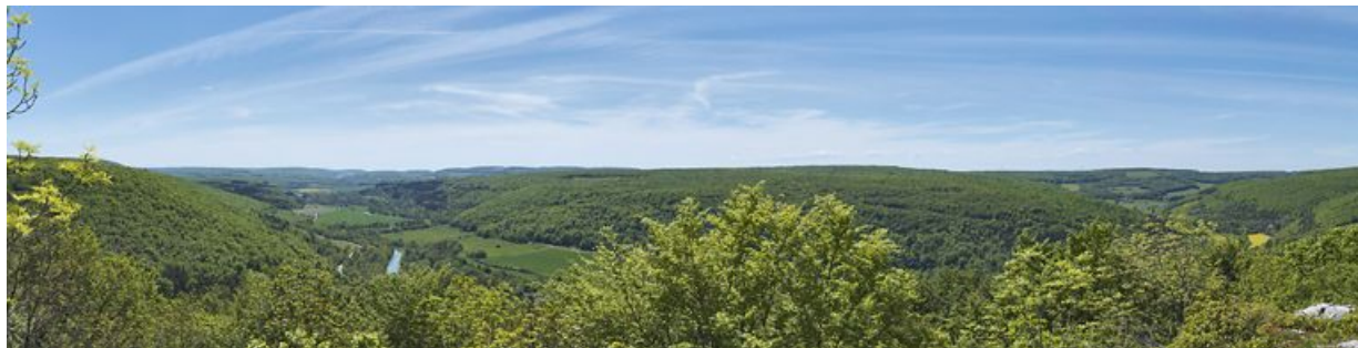
Panorama sur la vallée de l'Ouche.

N° de l'illustration : 20122102426NUC4AQ