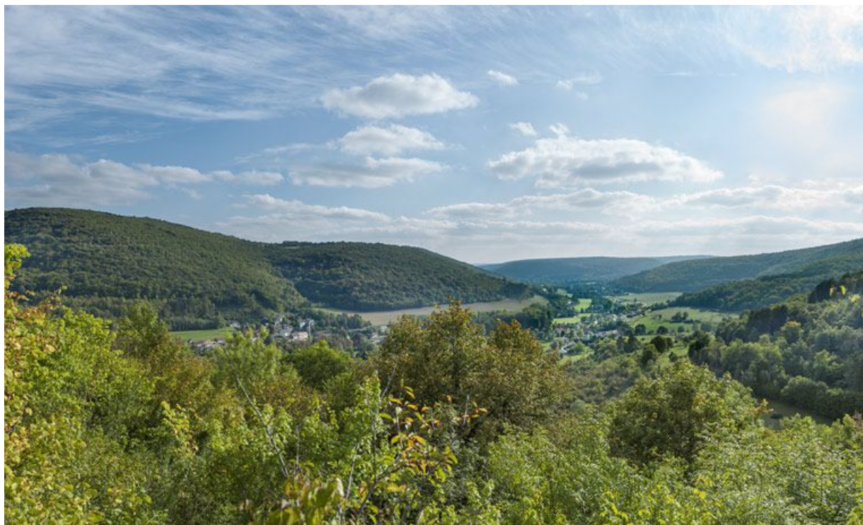
La vallée de l'Ouche, vue de l'ancien château de Marigny en direction de Saint-Victor.