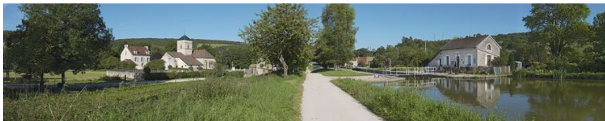
Le paysage en amont du site d'écluse 16. Sur la gauche, l'église et le presbytère de Crugy.

N° de l'illustration : 20122102233NUC4AQ