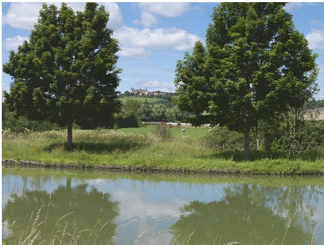
Une trouée sur le canal : l'autoroute A6 et le château de Châteauneuf.