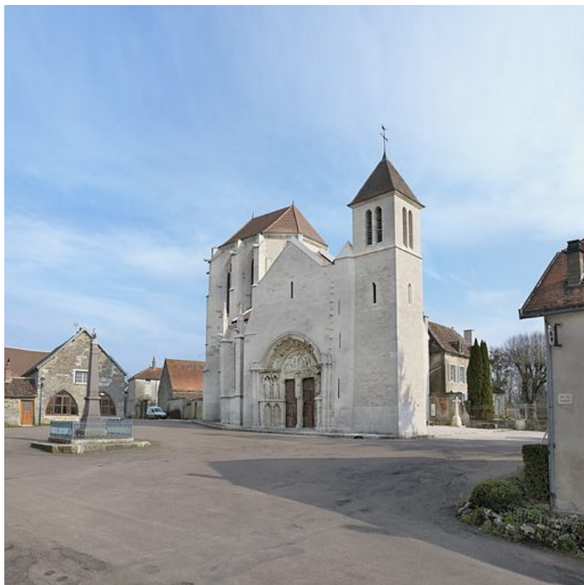
Façade de l'église paroissiale de Saint-Thibault, avec à gauche, le monument aux morts.