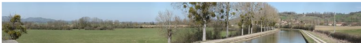
Grand paysage avec le village de Braux et la butte de Thil.

N° de l'illustration : 20122102761NUC4AQ