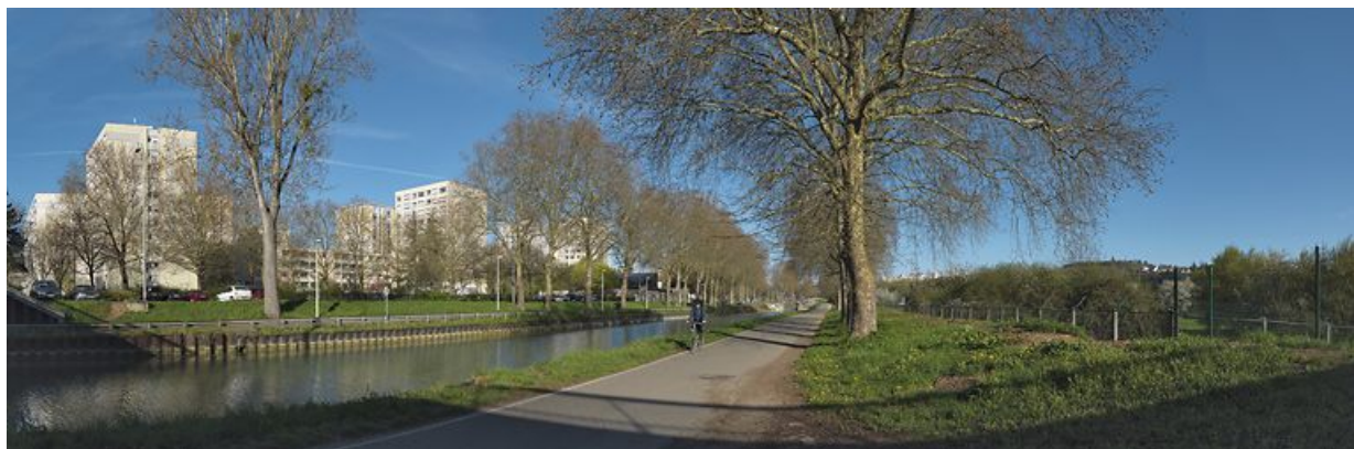
Traversée du canal à Dijon : le quartier de la Fontaine d'Ouche à gauche.