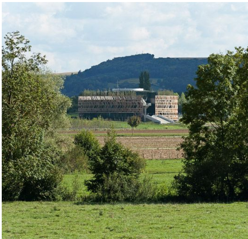
Vue du muséoparc d'Alésia ouvert en 2012 au public.

N° de l'illustration : 20112103999NUC2AQ