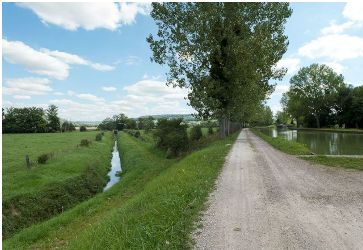
Vue du canal et d'une rigole de déversoir à Mussy-la-Fosse.

N° de l'illustration : 20112104009NUC4AQ