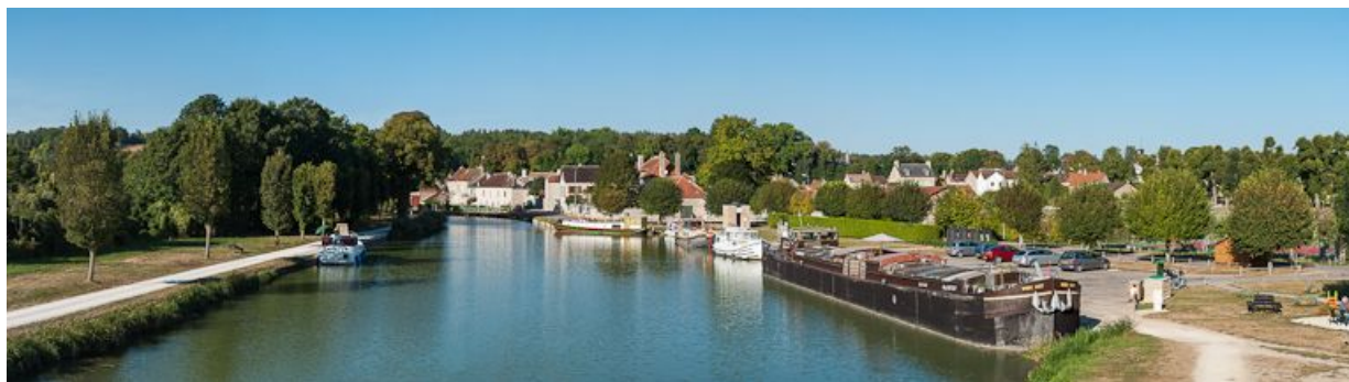
Le port au premier plan, le village de Tanlay en arrière-plan.

N° de l'illustration : 20128900506NUC4AQ