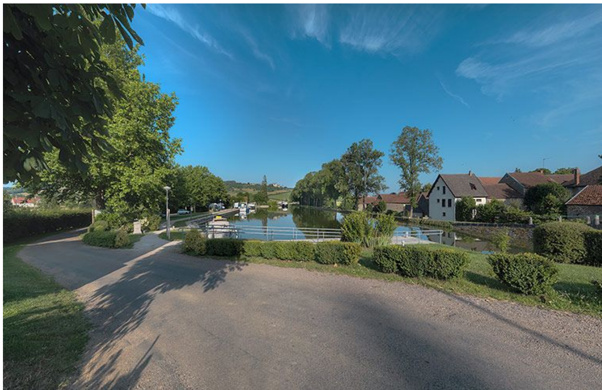
Ensemble du site du village de Vandenesse vue d'amont.

N° de l'illustration : 20122102106NUC4AQ