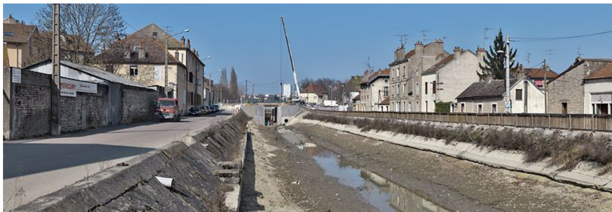
La traversée du canal à Dijon : habitations et locaux professionnels en bordure du canal. Le bief est vide pour permettre la réfection du pont sur l'écluse 55.