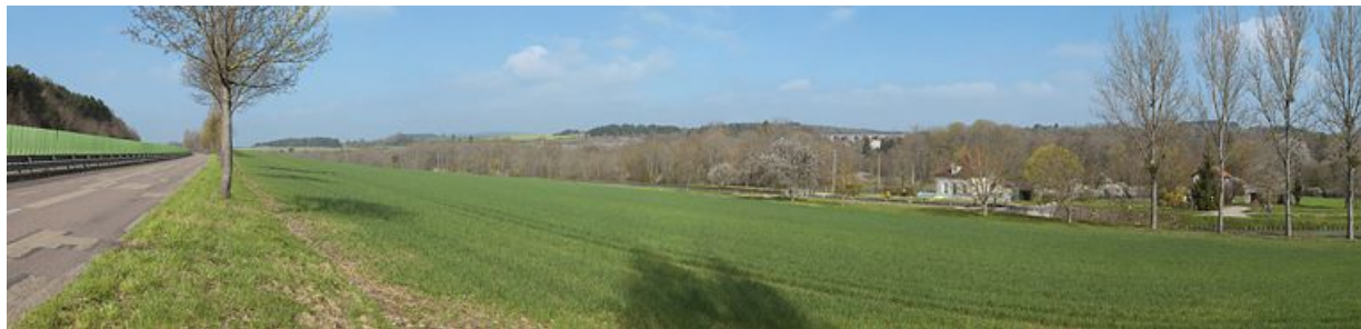
La traversée de Fleurey-sur-Ouche par le canal : vue sur le viaduc ferroviaire de Fain.

N° de l'illustration : 20122102573NUC4AQ