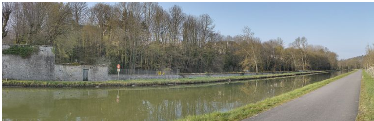
La traversée de Fleurey-sur-Ouche par le canal : enceinte du château de l'ancien prieuré Saint-Marcel et jardins des autres demeures.

N° de l'illustration : 20122102570NUC4AQ