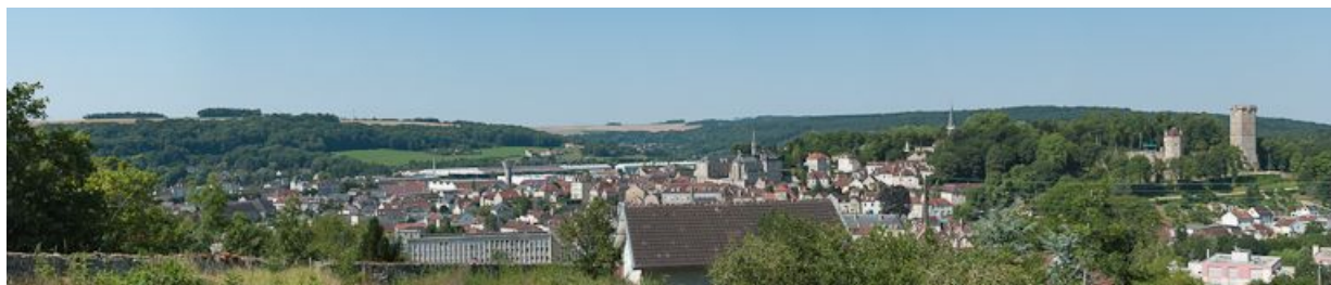
Vue d'ensemble de la ville de Montbard.

N° de l'illustration : 20122101914NUC4AQ