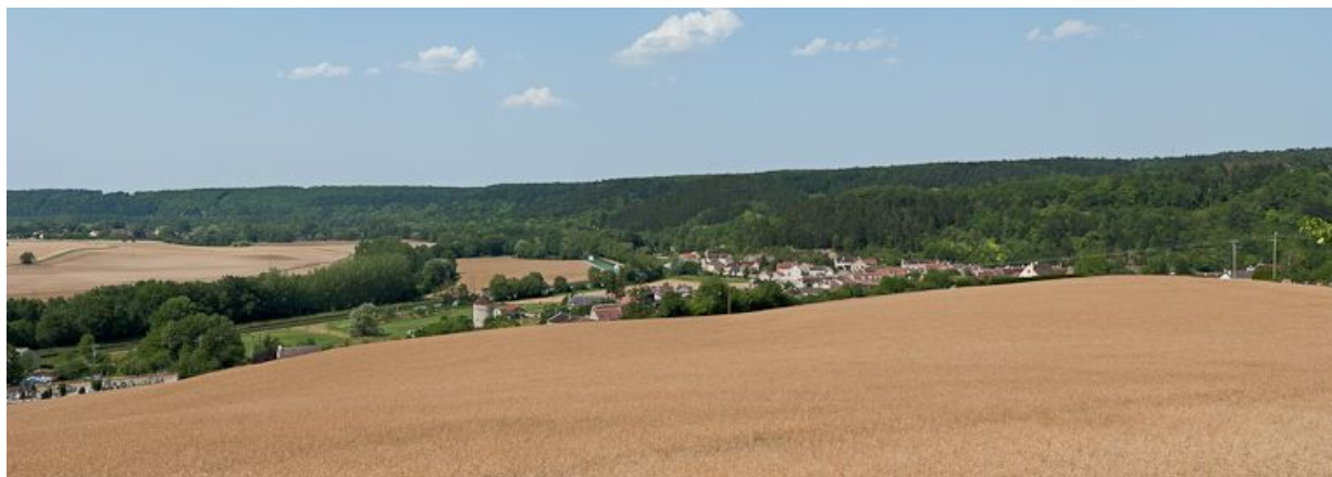
Vue générale du canal.

N° de l'illustration : 20118900320NUC4AQ