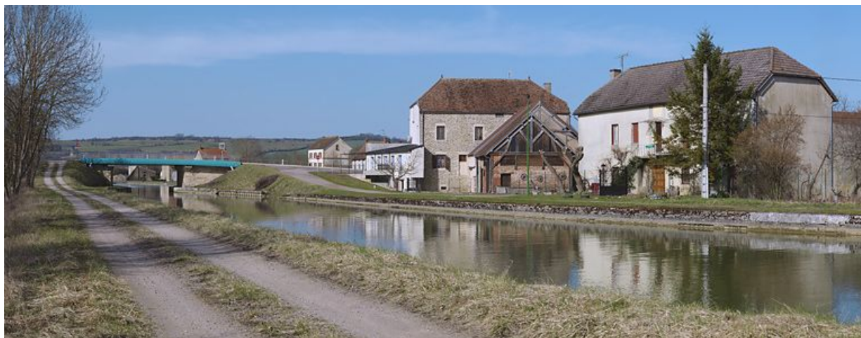
Arrivée en amont du pont à Clamerey : fermes sur la rive droite.