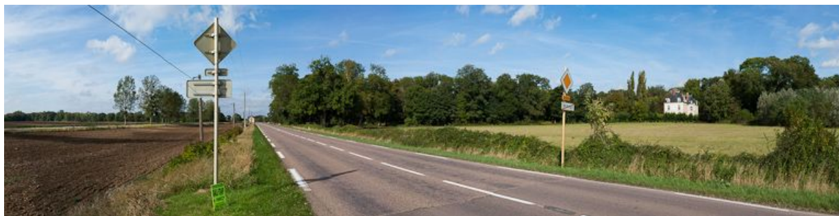
Le château de Percy depuis la route.

N° de l'illustration : 20128900572NUC4AQ