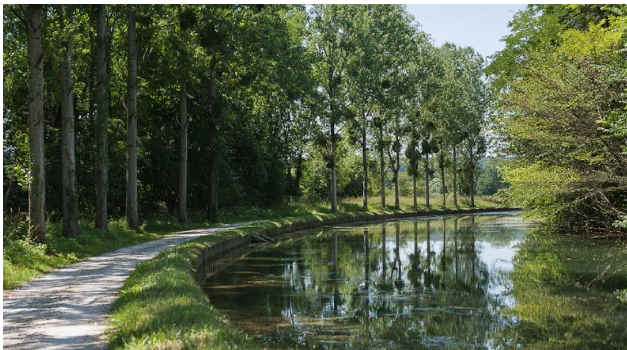
Chemin de halage et alignement d'arbres le long du bief 75.

N° de l'illustration : 20128900365NUC4AQ