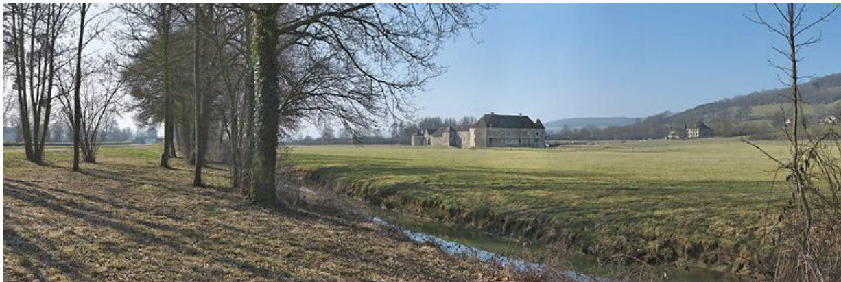
Le château d'Eguilly dans son environnement : le pont sur le canal, l'Armançon, le château, la demeure et la chapelle liées au château. Le village d'Eguilly sur le coteau.