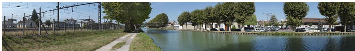
Panorama du canal traversant Migennes en direction de l'Yonne. A gauche, le site SNCF et la gare, à droite, la ville reconnaissable à ses halles.

N° de l'illustration : 20128900671NUC4AQ