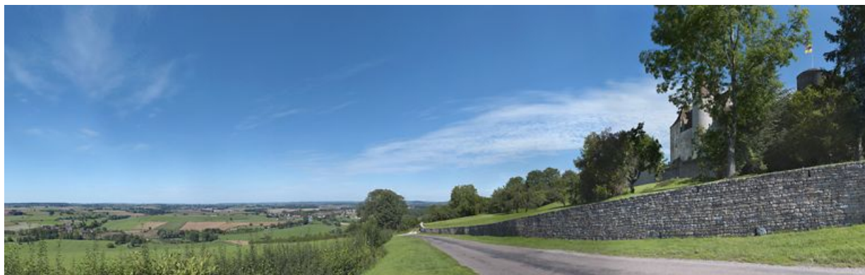
Le canal vu de la colline de Châteauneuf-en-Auxois. A gauche, le canal, à droite, le château.

N° de l'illustration : 20112103433NUC4AQ