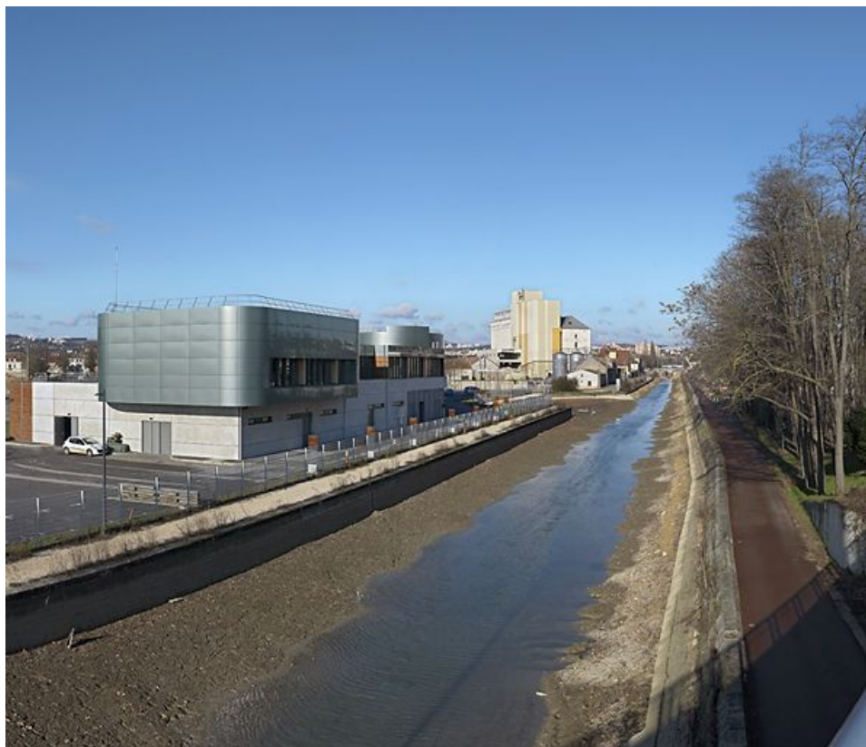
Nouveau poste d'aiguillage informatisé de la SNCF, sur la rive droite du canal à Dijon (à gauche de l'image). Le bief est vide pour permettre les travaux de réfection du pont sur l'écluse 55.