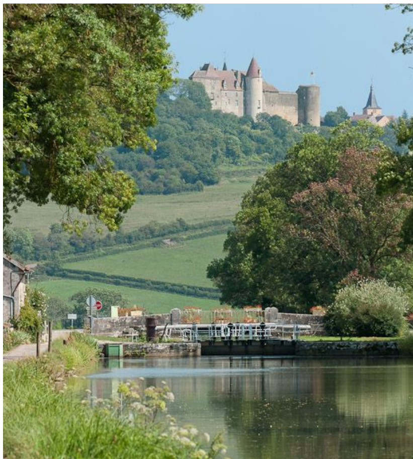
Vue du château de Châteauneuf depuis le bief 08 du versant Saône.

N° de l'illustration : 20112103486NUC2AQ