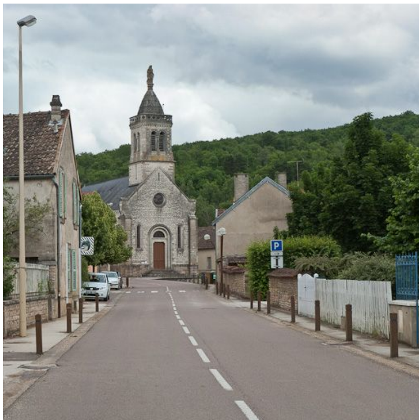
Vue de l'église de Sainte-Marie-sur-Ouche.

N° de l'illustration : 20112103509NUC2AQ