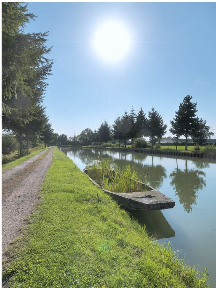
Brise-glace dans le bief 17. Alignement de sapins.