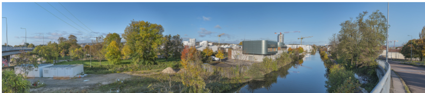
Panorama sur la ville de Dijon, vue depuis le bief 56 S.