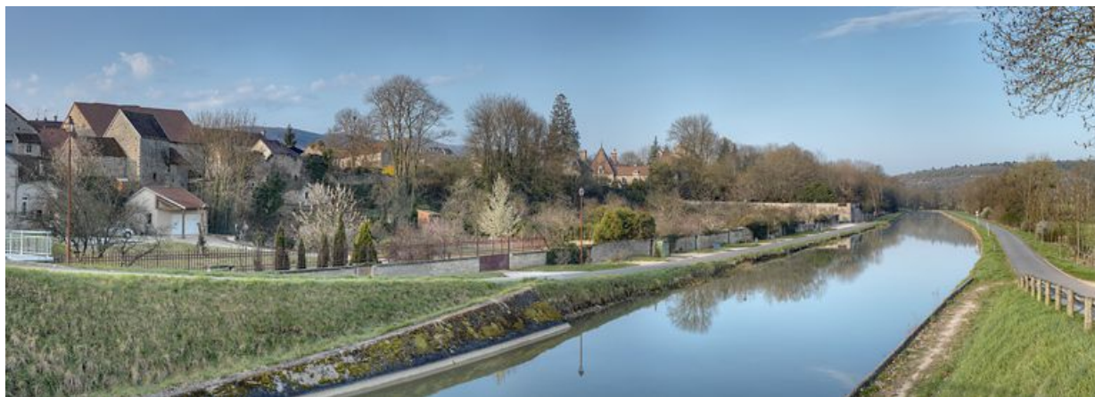
La traversée de Fleurey-sur-Ouche par le canal : le coteau de la rive droite avec jardins au premier plan, puis restes du prieuré Saint-Marcel et jardins des autres demeures.

N° de l'illustration : 20122102569NUC4AQ