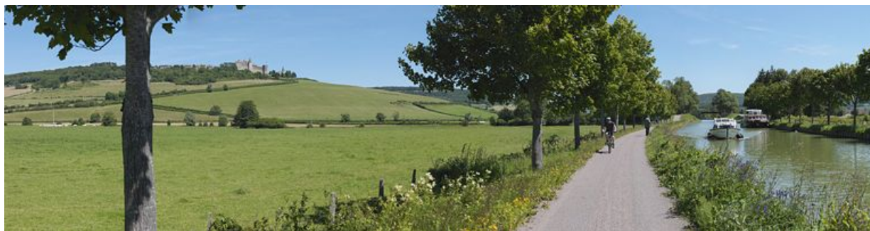
Panorama sur le canal et sur le village de Châteauneuf, en surplomb à gauche : le château.

N° de l'illustration : 20122102141NUC4AQ