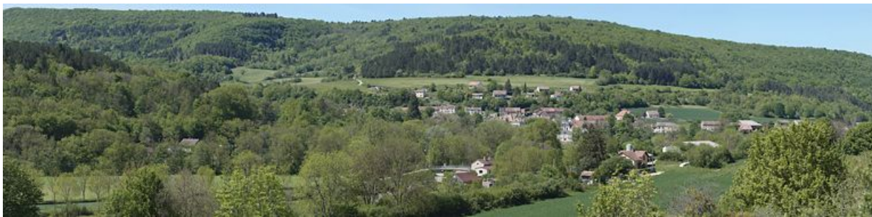
Grand panorama sur le village de Barbirey-sur-Ouche.

N° de l'illustration : 20122102507NUC4AQ