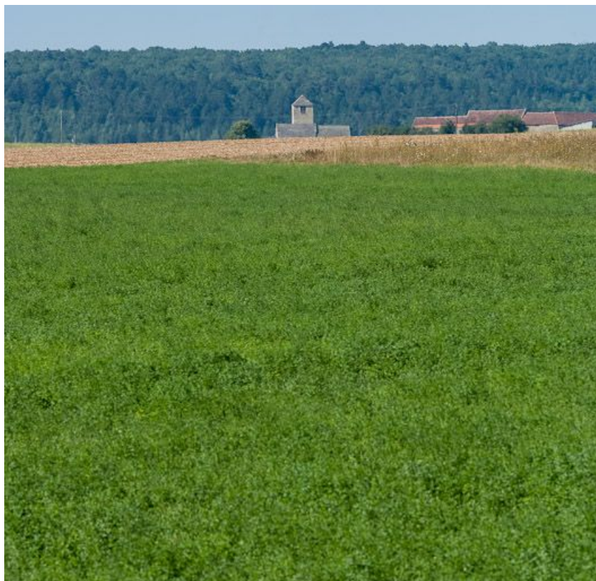
L'église de Chassignelles.

N° de l'illustration : 20128900450NUC2AQ