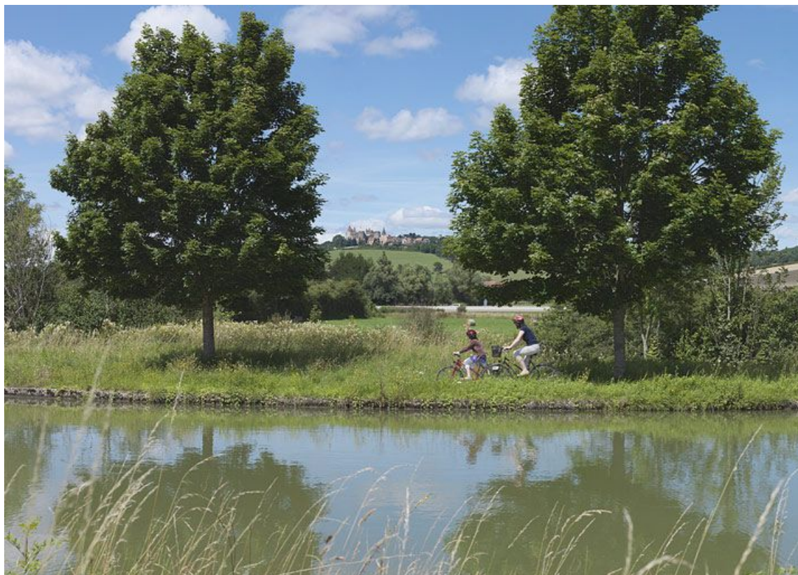
Une trouée sur le canal : l'autoroute A6 et le château de Châteauneuf.