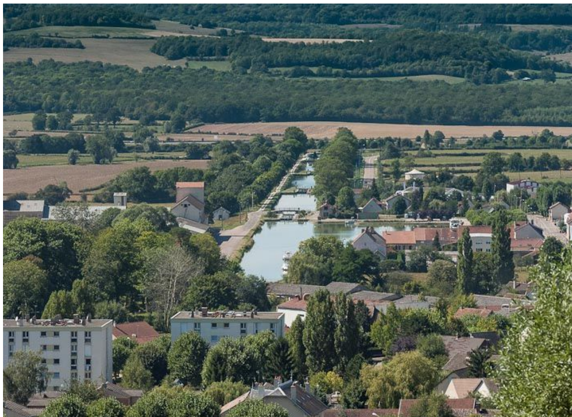
Vue des premiers biefs du versant Yonne à Pouilly-en-Auxois.

N° de l'illustration : 20122101898NUC2AQ