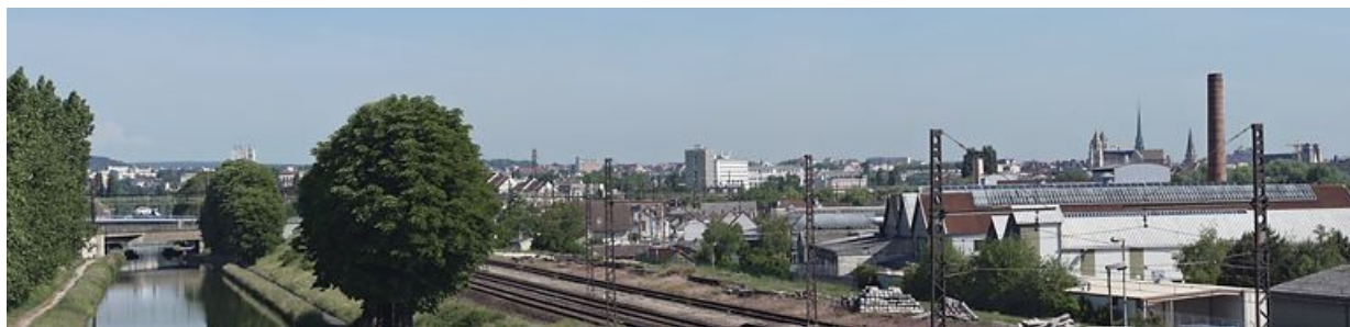
Traversée du canal à Dijon : la ville vue de la passerelle SNCF (IA21003800).