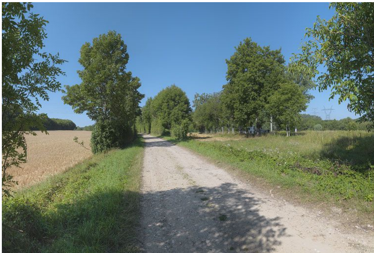
Une vue ordinaire dans la traversée de la vallée de l'Ouche.