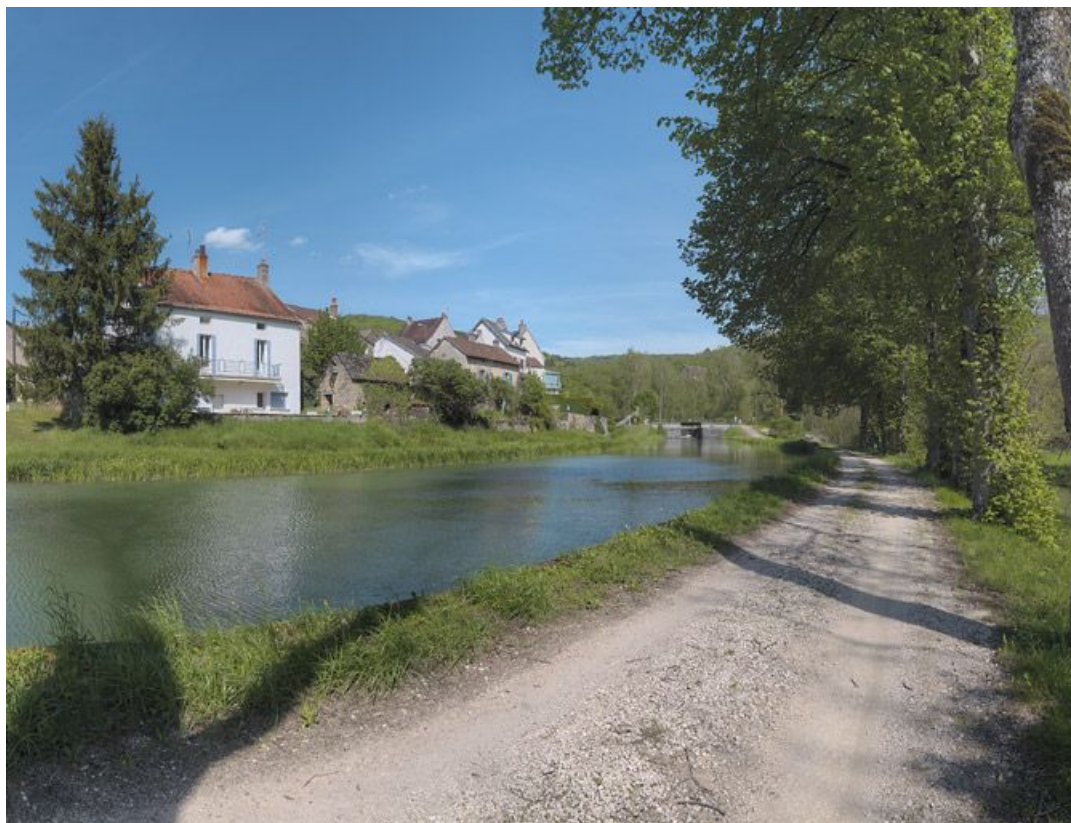
Panorama du canal lors de son passage dans le village de La Bussière.