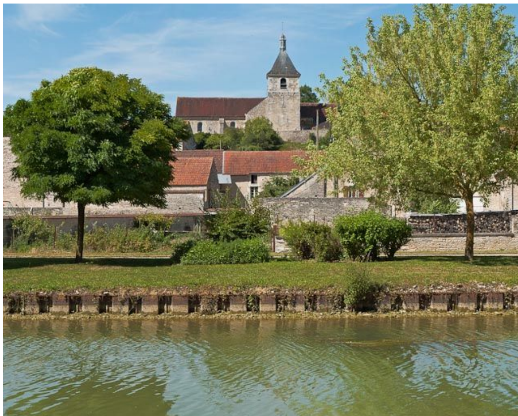
Vue de l'église de Saint-Vinnemer.

N° de l'illustration : 20118900335NUC4AQ