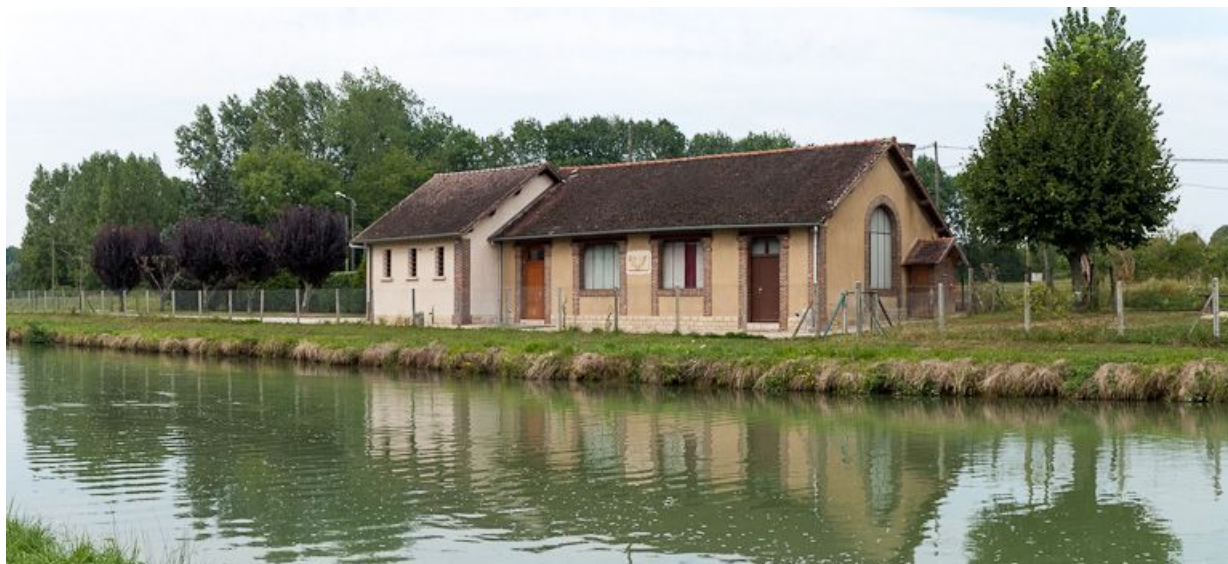
La salle des fêtes de Percey, le long du canal.

N° de l'illustration : 20128900583NUC4AQ