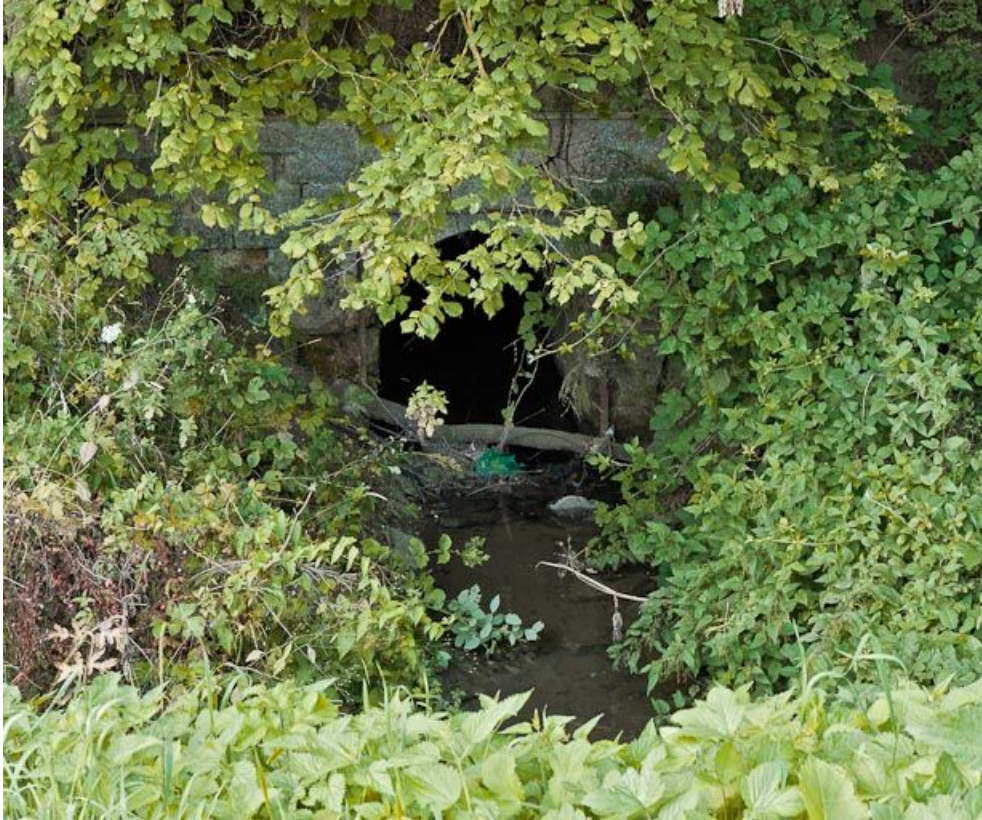
Vue de l'aqueduc.

21, Pouilly-en-Auxois, lieudit : bief 01 du versant Yonne