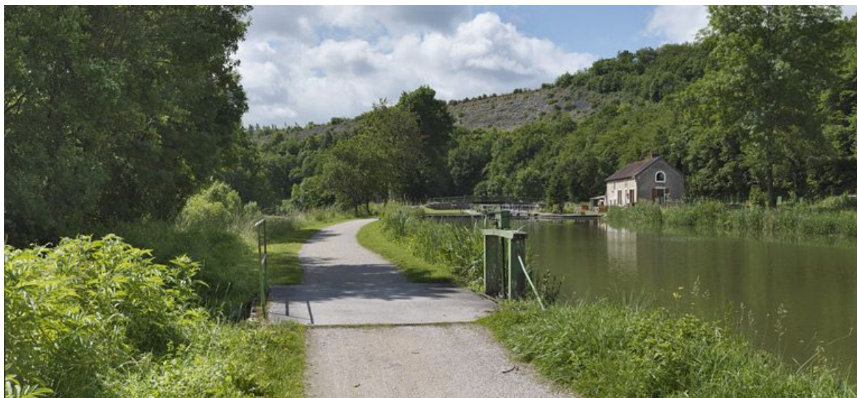
Déversoir rive gauche, à l'arrière-plan, le site d'écluse 19.

21, Crugey, lieudit : bief 19 du versant Saône